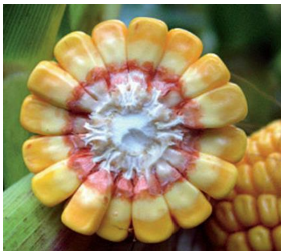
Slika 1. Mliječna linija na zrnu kukuruza