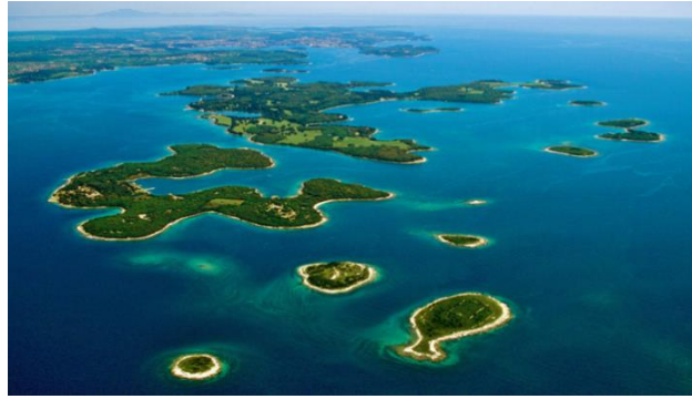
Slika 2. Otočje Brijuna