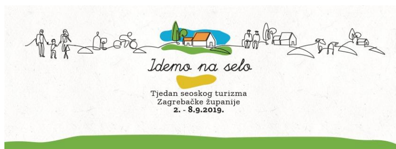
Slika 1. Projekt „Idemo na selo“