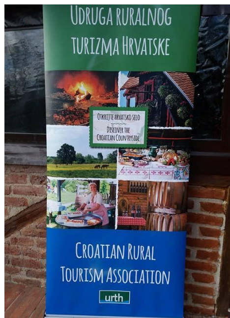
Slika 2. Promotivni plakat/roll-up Udruge

Udruga se promovira na nekoliko načina. Udruga je izradila vlastitu web stranicu, 5 otvoreni su Facebook i Instagram profili Idemo na selo, a dobru promociju omogućila je i medijska kampanja „Idemo na selo“ koja se odnosila na seoski turizam Zagrebačke županije. „Sada se većinom oslanjamo na dijeljenje pozitivnih iskustva naših posjetitelja, blogera 6 i influencera 7 koji to rade besplatno...“ ističe voditeljica Kuratko Pani. Dobru promociju svakako predstavlja zadovoljan turist. Ukoliko je posjetitelj seoskog turizma zadovoljan, on će se ponovno vratiti ili preporučiti prijateljima, obitelji...da posjete takvo mjesto.