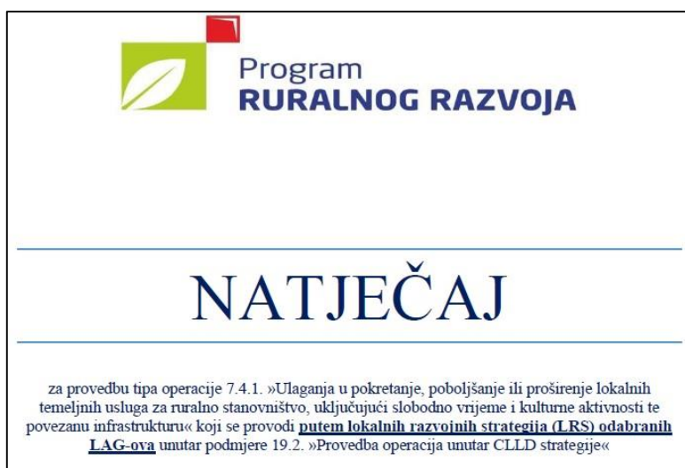
Slika 4. Izgled naslovne strane objavljenog Natječaja