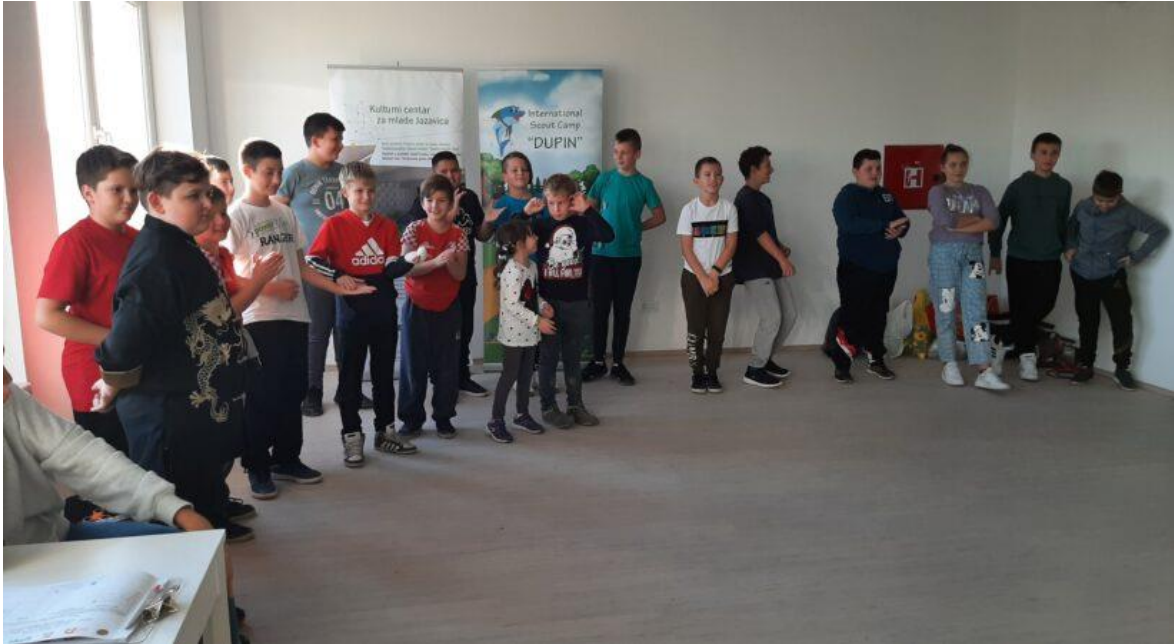
Slika 11. Održavanje radionice za djecu u sklopu Kulturnog centra za mlade Jazavica

zatražene potpore u ovom projektu iznosio je 98.380,78 EUR (741.249,99 HRK) te je taj iznos u fazi konačne isplate bio u prosincu 2022. godine. Projekt je sufinanciran sredstvima Europske unije u postotku od 85%, a ostatak je financiran iz Državnog proračuna u iznosu od 15%. Radovi na Kulturnom centru za mlade obuhvaćali su zemljane, zidarske i betonske radove te unutarnje uređenje, ugradnju stolarije i sanitarnih uređaja. Interijer centra opremljen je novim namještajem i kuhinjskom opremom.