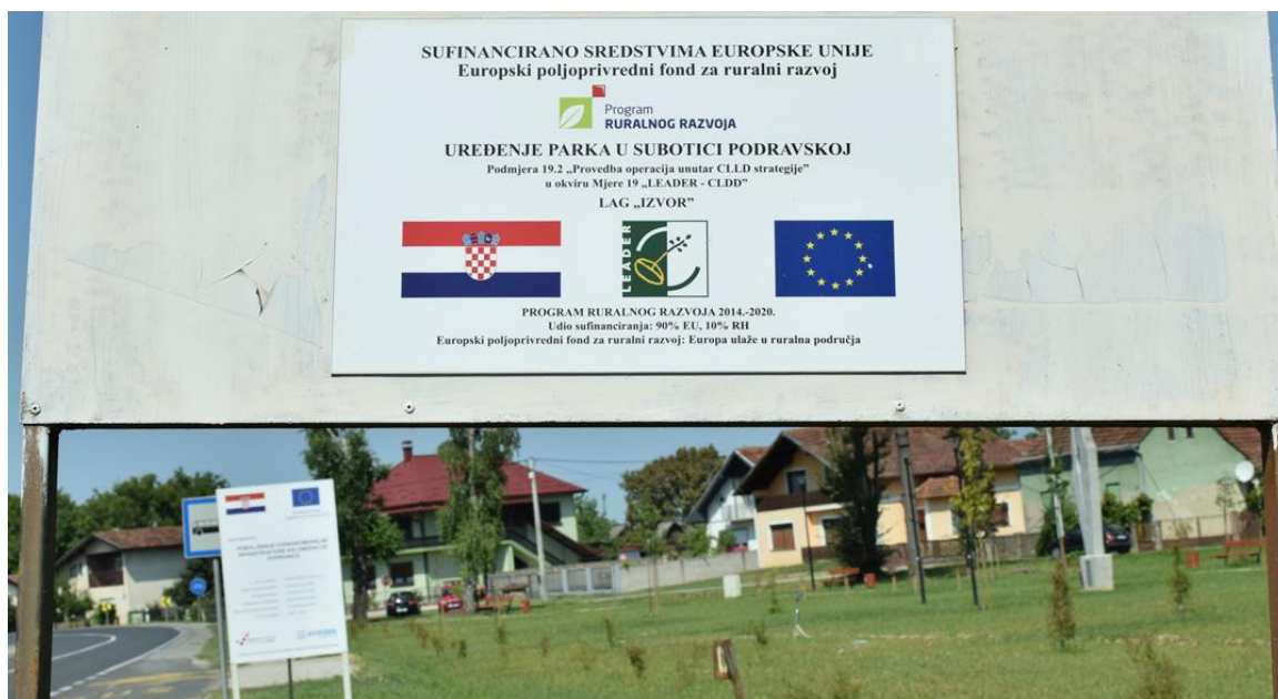
Slika 9. Postavljena oznaka o sufinanciranosti projekta u parku u Subotici Podravskoj

Kako se navodi u objavi na internetskoj stranici Općine Rasinja 20 , građevinski radovi uključivali su izgradnju šetnice, opločene rubnjacima, izgradnju sjenice u središnjem dijelu, postavljanje klupa, prokop kanala za odvod oborinskih voda s južne i sjeverne strane premoštenog s dva drvena mostića koji služe za ulaz u park. Uz šetnicu su postavljeni elegantni metalni stupovi s LED štedljivim svjetiljkama, usmjerenim prema zemlji, što će pticama omogućiti miran san, a šetačima raskošno osvijetliti prostor za ugodan boravak u večernjim satima (slika 10). Sve navedeno, kao i dodatno uređenje zelenih površina sadnjom ukrasnog drveća te sjetvom trave, rezultirat će modernim urbanim parkom u ruralnoj sredini općine Rasinja.