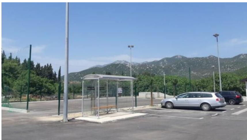
Slika 16. Novoizgrađeni trg u Peračkom Blatu (autobusna stanica, parking i malonogometno igralište)