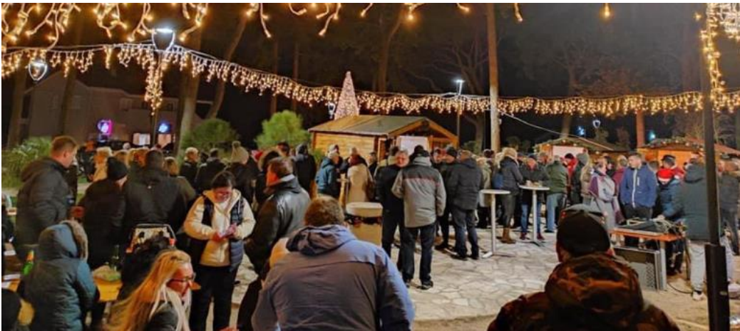
Slika 18. Advent u saniranom i uređenom parku „Dardin“

park unaprijedi i nastavi biti mjesto druženja. Vrijednost sredstava koju je Općina Šolta zatražila te navela u projektu s kojim su se prijavili na LAG natječaj LAG-a Škoji je iznosio 64.308,43 EUR (484.531,87 HRK). Za navedeni projekt im je ukupno ugovoreno te isplaćeno nešto manje novaca u iznosu od 62.066,88 EUR (467.642,88 HRK). Navedeni, isplaćeni iznos je svejedno bio dovoljan te je pokrio sve troškove vezano za projekt.