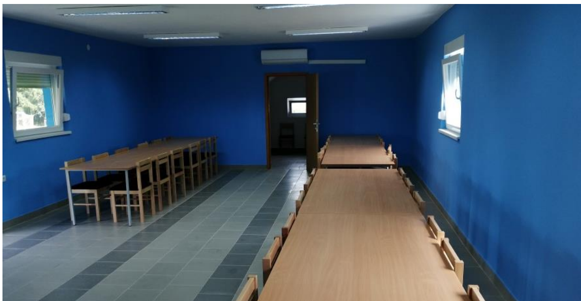
Slika 6. Unutrašnjost rekonstruiranog sportskog doma Turanovac

i vraćanju mladih na zdraviji način života, ovakvim projektom se mladi i djeca sve više druže te ostaju u ruralnoj sredini. Unutrašnjost rekonstruiranog sportskog doma Turanovac (slika 6) stvarno može parirati i onim sportskim domovima koji se nalaze u puno većim i urbanim područjima.