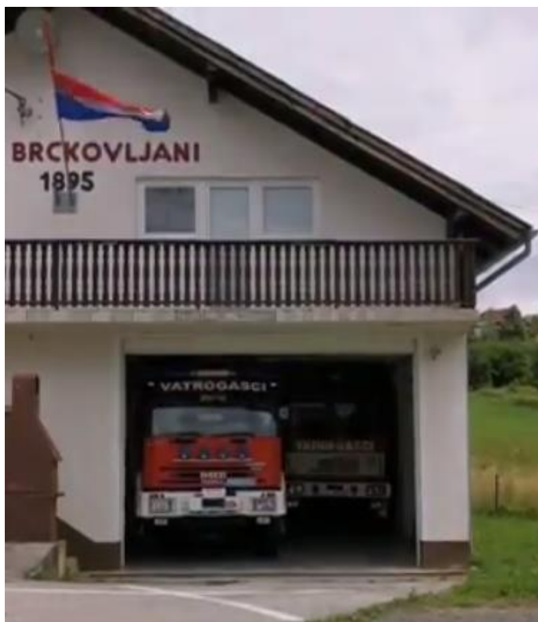
Slika 7. Izgled garaže DVD-a Brckovljani prije prijave i provedbe projekta