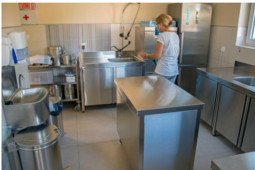
Slika 17. Nova kuhinja u sklopu Dječjeg vrtića Vinkuran