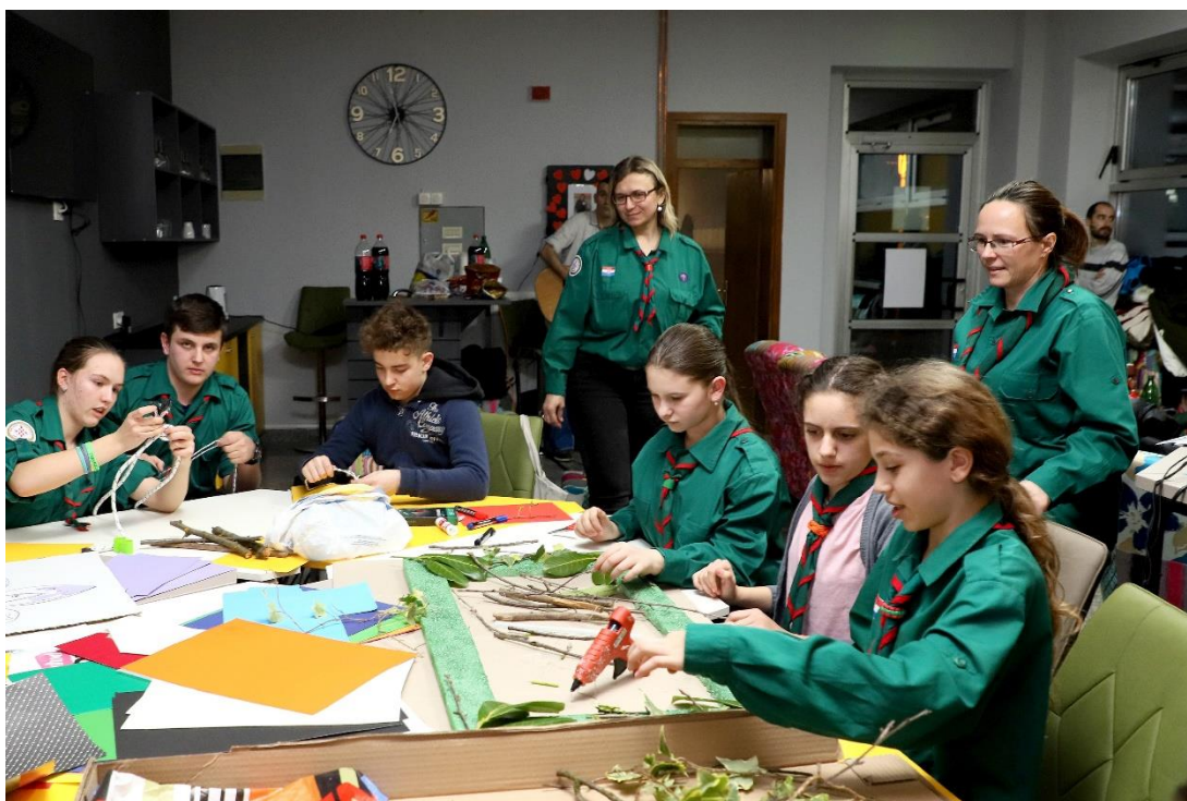
Slika 12. Odred izviđača Zelena patrola Rajić tijekom provođenja jednih od svojih radionica

umjetnosti. Također, na samoj internetskoj stranici Odreda izviđača Zelena patrola Rajić 22 mogu se pronaći razni pozivi na radionice i edukacije koje će se provoditi. Radionica koja je prikazana na slici 11 održana je u sklopu Međunarodnog kampa Dupin koji je okupio izviđače iz Europe tijekom ljeta i cijele godine. Time se može zaključiti kako je ovaj projekt rezultirao privlačenjem ljudi iz velikih urbanih područja u manje gradsko naselje i to putem radionica međunarodnog karaktera. Velika zasluga ovom projektu pripada i Odredu izviđača Zelena patrola Rajić koja je neprofitna, dobrovoljna udruga za promicanje punih tjelesnih, umnih, društvenih i duhovnih potencijala djece i mladih. Svojim radom i organizacijom radionica, humanitarnih akcija i nizom drugih aktivnosti u sklopu Kulturnog centra za mlade Jazavica (slika 12), zasigurno su pridonijeli da cijeli ovaj projekt zaživi i pokaže kako manja gradska naselja također mogu biti zanimljiva i puna sadržaja različitog karaktera.