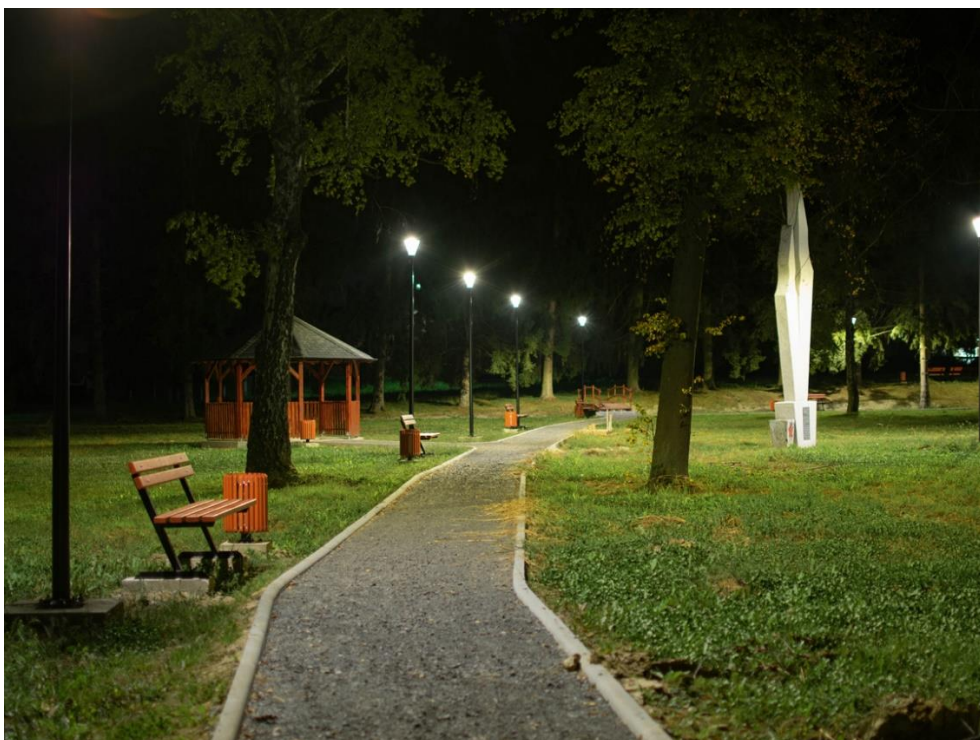
Slika 10. Izgled novouređenog parka u Subotici Podravskoj