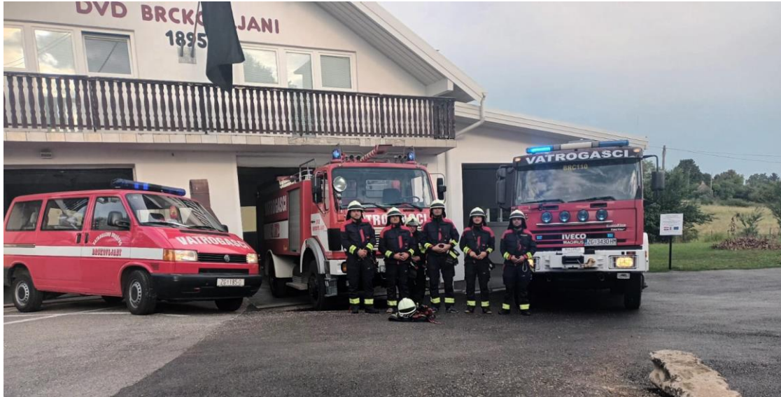
Slika 8. Vatrogasci DVD-a Brckovljani ispred novoizgrađene pomoćne zgrade

a to je da unaprijedit društveni život u ruralnom području na višu razinu. Također, modernizacija ovog DVD-a, zasigurno je i rezultirala zadržavanjem vatrogasaca u ovoj ruralnoj sredini u kojoj su dobili bolje uvjete za rad (slika 8).