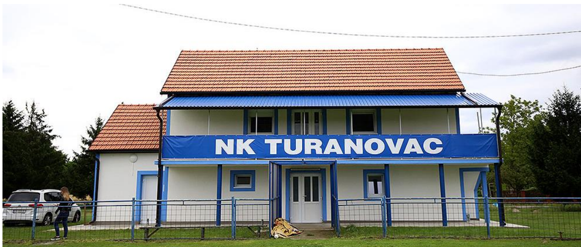
Slika 5. Izgled rekonstruiranog sportskog doma Turanovac

internetskoj stranici koja objavljuje novosti na području Virovitičko-podravske županije (na čijem području djeluje i LAG Virovitički prsten), može se pronaći i kako načelnik Općine Lukač ističe da je i on sam u nogometu cijeli svoj život te da upravo od nogometa kreće i društveni život malih sredina 18 . U travnju 2019. godine, na 20. sjednici Općinskog vijeća Općine Lukač, načelnik općine je između ostalog spomenuo i prijavu na projekt za rekonstrukciju sportskog doma u Turanovcu. Projekt je na LAG natječaju odobren te je u 2022. godini došao u fazu konačne isplate u iznosu koji je naveden na početku. Iste godine, radovi na sportskom domu u Turanovcu privedeni su kraju (slika 5), a cijeli prostor je predan NK Turanovcu na korištenje.