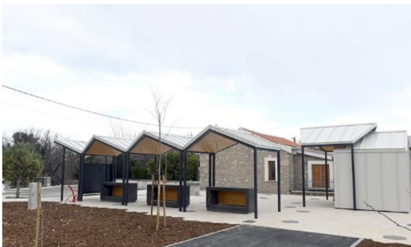
Slika 14. Novoizgrađena tržnica u Jadranovu