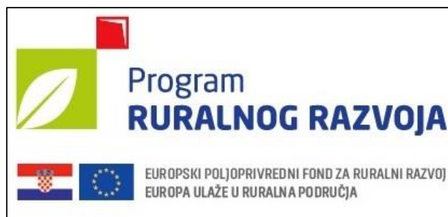
Slika 3. Logotip Programa