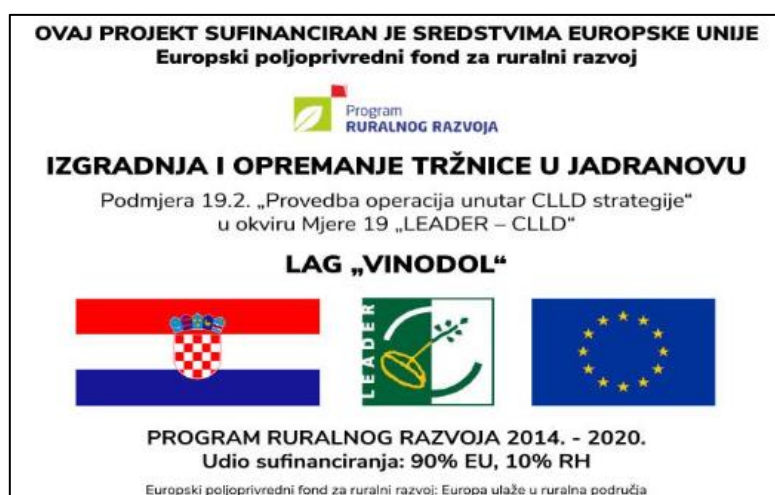
Slika 13. Oznaka o sufinanciranosti projekta za izgradnju i opremanje tržnice u Jadranovu

Jadranovu (slika 13) . Ukupna vrijednost projekta je 115.576,68 EUR (870.812,50 HRK) od kojih je dio sufinanciranih iz bespovratnih sredstava dobivenih na LAG natječaju 31.994,82 EUR (241.064,97 HRK) u sklopu tipa operacije 7.4.1. Jadranovo je mjesto koje broji 1.077 stanovnika te nije imalo tržnicu za opkrbu stanovništva i sve većeg broja turista s lokalnim poljoprivrednim proizvodima s OPG-ova koji se nalaze na području LAG-a Vinodol. Stoga, došlo se na ideju za izradu projekta izgradnje i opremanja tržnice u Jadranovu koja bi bila izgrađena na površini od 270 m 2 .