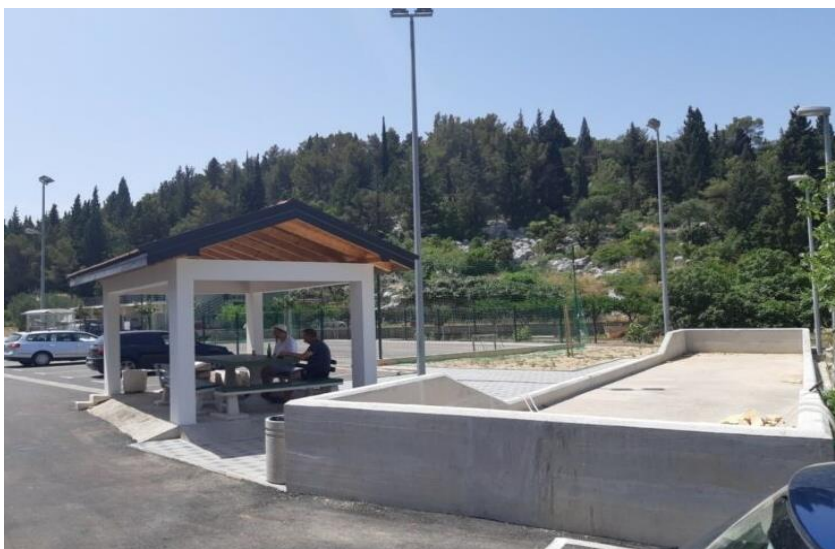
Slika 15. Novoizgrađeni trg u Peračkom Blatu (boćalište)