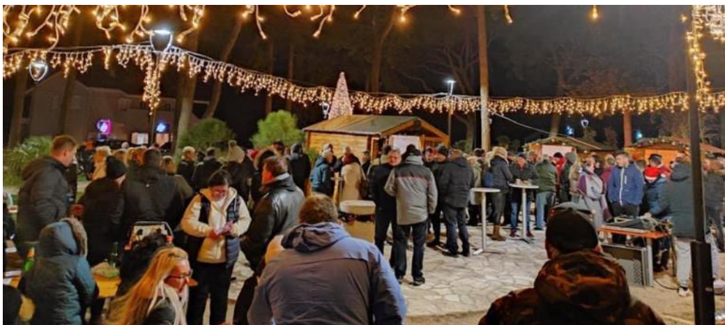
Slika 18. Advent u saniranom i uređenom parku „Dardin“

park unaprijedi i nastavi biti mjesto druženja. Vrijednost sredstava koju je Općina Šolta zatražila te navela u projektu s kojim su se prijavili na LAG natječaj LAG-a Škoji je iznosio 64.308,43 EUR (484.531,87 HRK). Za navedeni projekt im je ukupno ugovoreno te isplaćeno nešto manje novaca u iznosu od 62.066,88 EUR (467.642,88 HRK). Navedeni, isplaćeni iznos je svejedno bio dovoljan te je pokrio sve troškove vezano za projekt.