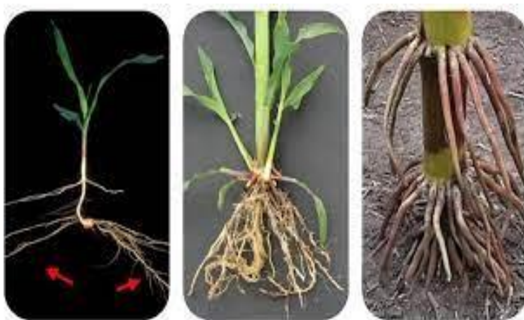
Slika 2. Razvoj korijena kod kukuruza

Kukuruz, kao i sve ostale prosolike žitarice, klija jednom primarnim klicinim korjenčićem, a nakon izbijanja primarnog korjenčića razvijaju se i bočni klicini korjenčići, koji prvo rastu horizontalno, a onda kreću sa rastom u dubinu (Slika 2.).