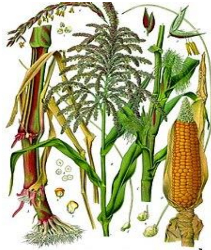
Slika 3. Sistematika kukuruza