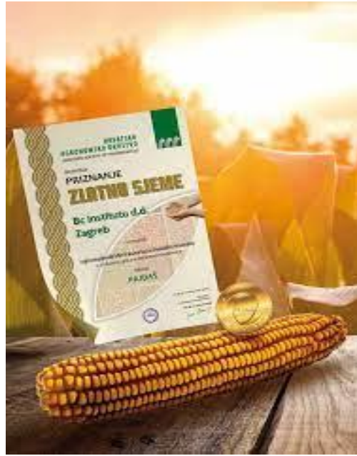
Slika 8. Priznanje Zlatno sjeme za Bc hibride