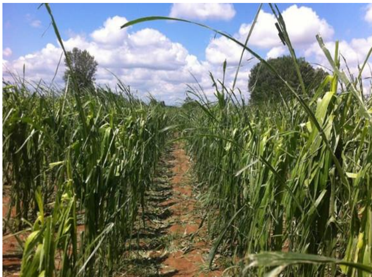
Slika 6. Štete uzrokovane tučom na kukuruzu