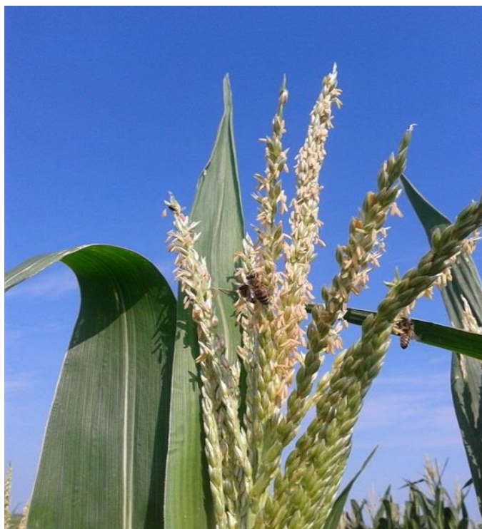
Slika 4. Metlica kukuruza (muški cvat)