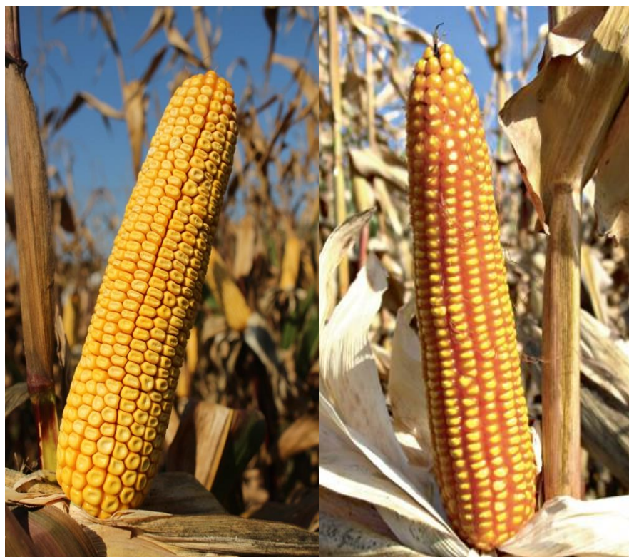
Slika 1. Klip kukuruza tipa zuban (lijevo) i tvrđunac (desno)

boja, a karakteristično je da, kod sazrijevanja, brašnasti dio smanjuje svoj volumen i zbog toga se stvara udubljenje na vrhu zrna zbog čega zrno ima oblik konjskog zuba. Zbog slabijeg sastava bjelančevina zuban se koristi uglavnom za prehranu stoke. Tvrđunac je kvalitetniji po udjelu bjelančevina od zubana, klip i zrno su manji, skloniji je stvaranju zaperaka i koristi se najviše u ljudskoj prehrani (Kovačević i Rastija, 2014.).