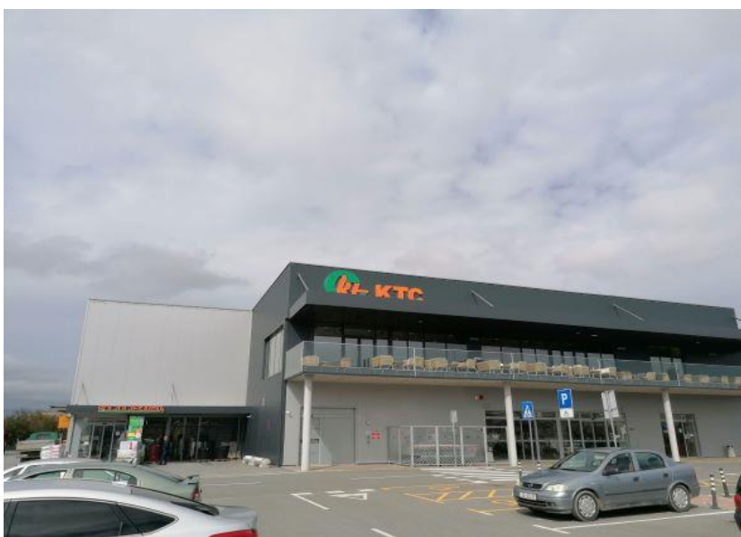
Slika 9. Supermarket i poljoljekarna Vrbovec

Tvrtka KTC d.d. je obiteljska tvrtka u vlasništvu Ivana Katavića, osnovana je 1992. a prvi trgovački centar je otvorila 1994. u Križevcima. Zapošljava preko 1500 djelatnika, a uz trgovinu, što je osnovna djelatnost, tvrtka se bavi ugostiteljstvom, turizmom i uzgojem povrća u vlastitim plastenicima. Tvrtka ima 27 supermarketa, 22 poljoljekarne, 15 benzinskih postaja i niz ugostiteljskih objekata, restorana i cafe barova u 25 hrvatskih gradova.