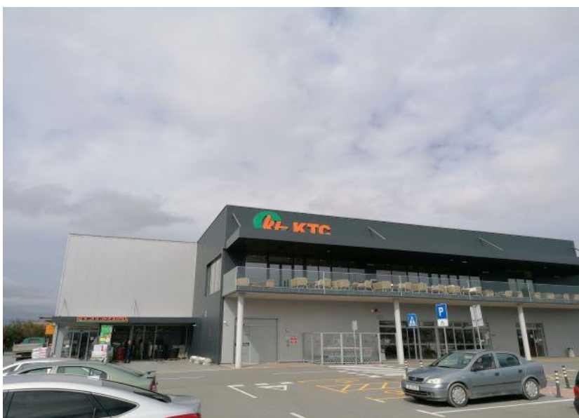
Slika 9. Supermarket i poljoljekarna Vrbovec

Tvrtka KTC d.d. je obiteljska tvrtka u vlasništvu Ivana Katavića, osnovana je 1992. a prvi trgovački centar je otvorila 1994. u Križevcima. Zapošljava preko 1500 djelatnika, a uz trgovinu, što je osnovna djelatnost, tvrtka se bavi ugostiteljstvom, turizmom i uzgojem povrća u vlastitim plastenicima. Tvrtka ima 27 supermarketa, 22 poljoljekarne, 15 benzinskih postaja i niz ugostiteljskih objekata, restorana i cafe barova u 25 hrvatskih gradova.