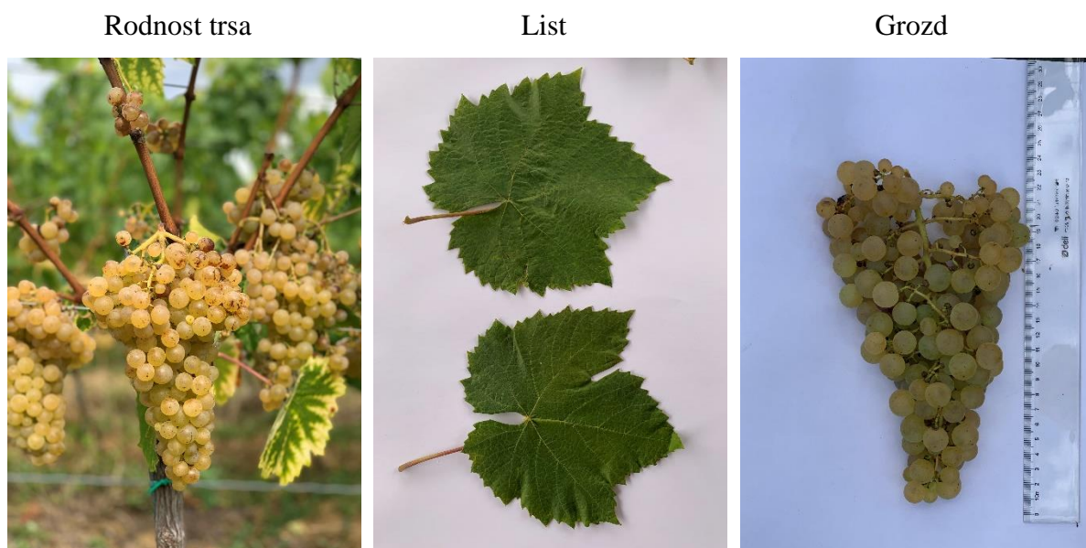
Slika 6. Sorta Starohrvatska belina

Ispitivane sorte u vinogradu Trgocentra d.o.o. su fotografirane, a fotografije za svaku sortu zabilježene su u kategoriji rodnost trsa, list i grozd. Za svaku sortu prikazano je sve navedeno (slika 6 do slika 14). Svrha fotografiranja je vizualno prikazati izgled i raznolikost odabranih ispitivanih autohtonih sorti.