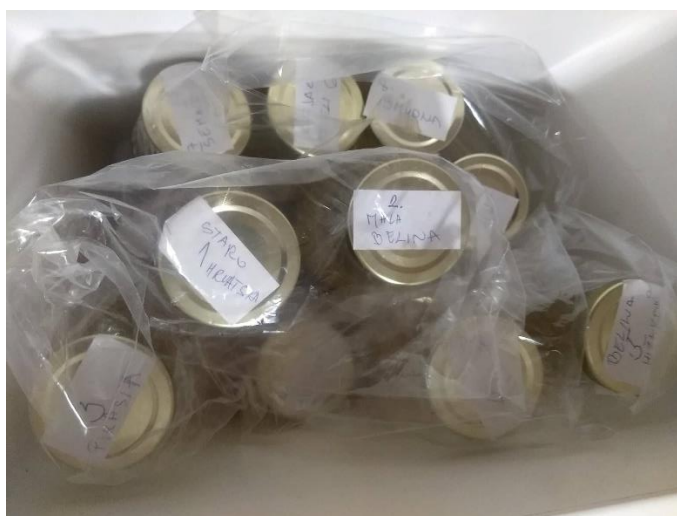
Slika 5. Uzorci moštova ispitivanih sorti spremni za dostavu u laboratorij

Nakon što su označene, boce su smještene u putni hladnjak. Uzorci su predani u laboratorij HORVAT Univerzal d.o.o. u Varždinu 24. rujna. U laboratoriju je na uređaju Winescan analizirano jedanaest parametara za svaku sortu. Analizirani su slijedeći parametri: °Brix, specifična gustoća, reducirajući šećeri gr/L, glukoza gr/L, fruktoza gr/L, ekstrakt gr/L, pH, ukupne kiseline gr/L, jabučna kiselina gr/L, vinska kiselina gr/L, glukonska kiselina gr/L. Na slici 5 prikazani su uzorci mošta dostavljeni u laboratorij.