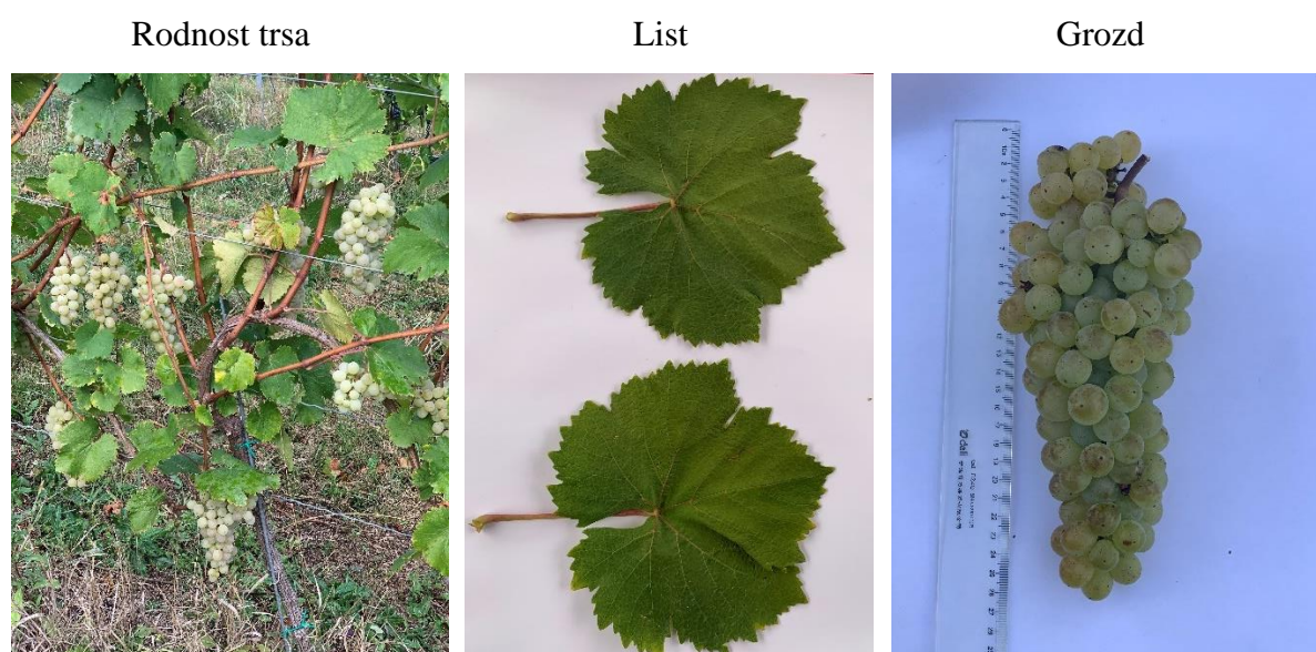
Slika 7. Sorta Pikasta belina