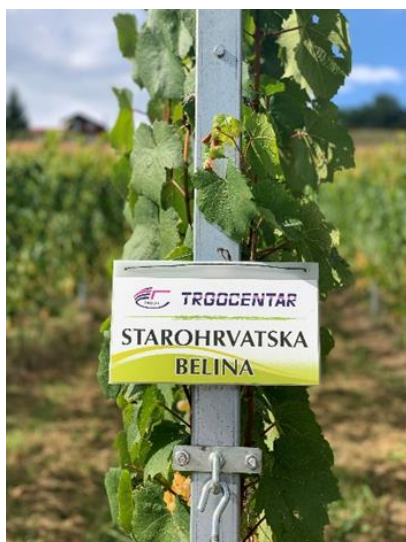
Slika 1. Oznaka vinograda Trgocentar d.o.o. Zabok / Starohrvatska belina