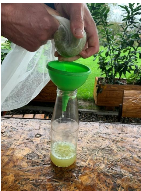
Slika 4. Tiještenje i cijedenje mošta

Na slici 4 prikazano je cijedenje mošta iz ubranih uzoraka za svaku sortu.