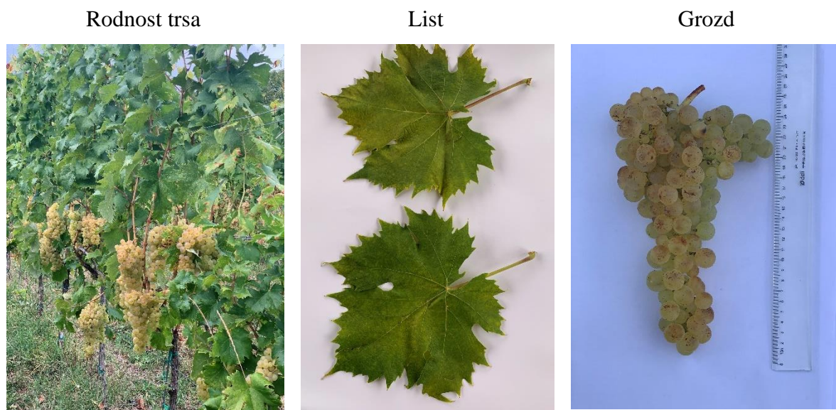
Slika 14. Sorta Mirkovačka belina