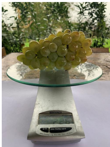
Slika 3. Vaganje grozda

Na slici 3 prikazan je postupak vaganja težine grozda, na temelju kojeg je izračunata prosječna težina grozda za svaku sortu, te potencijalni urod po hektaru.