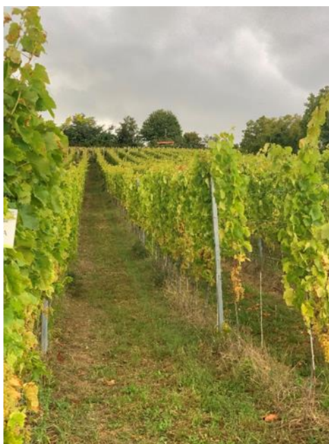
Slika 2. Vinograd Trgoscentra d.o.o., 2021.

Na slici 3 prikazan je postupak vaganja težine grozda, na temelju kojeg je izračunata prosječna težina grozda za svaku sortu, te potencijalni urod po hektaru.