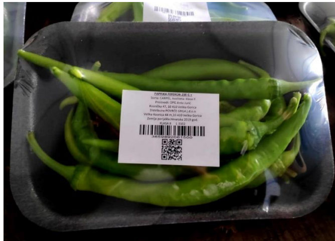
Slika 4. Izgled QR koda na pakiranom proizvodu