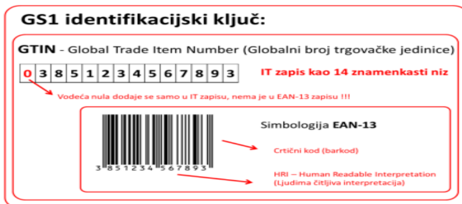
Slika 7. Primjer GTIN-koda

GTIN služi kao ključ za dohvat podataka prethodno zapisanih u bazu. GTIN može koristiti GS1-8, GS1-12, GS1-13 ili GS1-14 standardnu strukturu kodiranja. U informatičkom smislu GTIN se u bazi podataka pohranjuje kao niz (string) dužine 14 znakova koji mogu biti samo znamenke. GTIN se često poistovjećuje s nazivom „EAN kod“, što je vjerojatno posljedica njegove najčešće primjene na proizvodima u obliku GTIN-13 strukture (13-znamenaste) zapisane u EAN-13 simbologiji (slika 7).