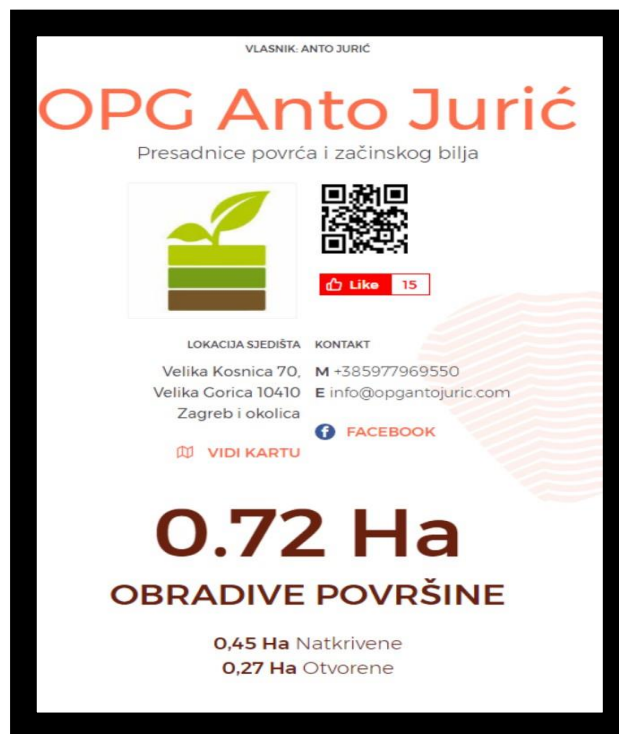
Slika 5. Skeniranje QR koda i povezivanje se s platformom