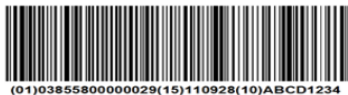
Slika 12. GS1-128 simbologija