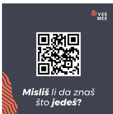
Slika 3. Primjer QR koda

Kod se stavlja na deklaraciju ili se stavlja kao zasebna deklaracija te je čitljiv putem bilo kojeg smartphone uređaja i nije potrebna dodatna instalacija aplikacija (slike 3-6).