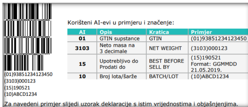
Slika 10. Primjer deklaracije u obliku GS1 Databar-a

razini RH, ovdje se kao identifikacijski ključ koristi globalno jedinstven GTIN „supstance“ (npr. riba, orada iz ulova, kao generički pojam sa cijenom izraženom po kg). Tu se koristi AI=10. Kako svaki pojedinačni „komad“ ima drugačiju masu, potrebno je uz GTIN „supstance“ dodati i masu upravo tog komada. Tu se koristi AI=3103 (neto masa na 3 decimale). Kako to tehnologija omogućava, ovdje još treba dodati informaciju „Najbolje upotrijebiti do“ (AI=15) i broj lota/šarže (AI=10). Sve ovo se onda izražava u simbologiji GS1 DataBar Expanded Stacked . Na slikama 10. i 11. prikazano je objašnjenje značenja pojedinih brojeva, odnosno simbola, a na slici 11. dodatno je navedena i potrebna sljedivost.