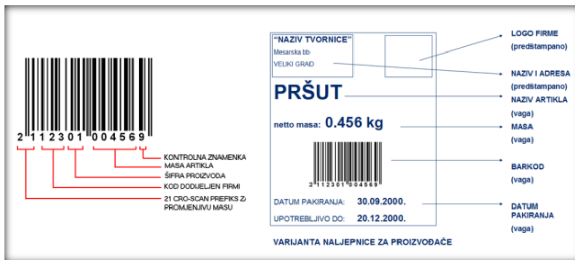
Slika 9. Opis i značenje brojeva ispod crtičnog koda te obvezni podaci na deklaraciji

crtičnim kodom angažira tehnologe i stručnjake za ambalažu (primarno je da karakteristike proizvoda ostaju sačuvane odnosno da je masa proizvoda u trenutku pakiranja jednaka masi u trenutku prodaje). Na slici ispod vidljivo je značenje brojeva ispod crtičnog koda, kao i opis svega što je zakonska obveza onoga što se na deklaraciji mora nalaziti.