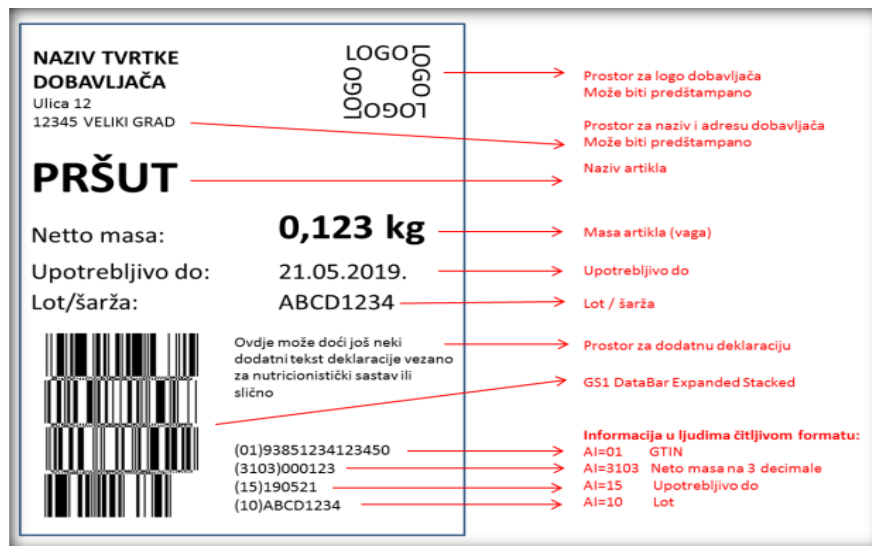
Slika 11. Deklaracija na maloprodajnoj trgovačkoj jedinici s varijabilnom masom kod koje je potrebna sljedivost korištenjem GS1 DataBar simbologije