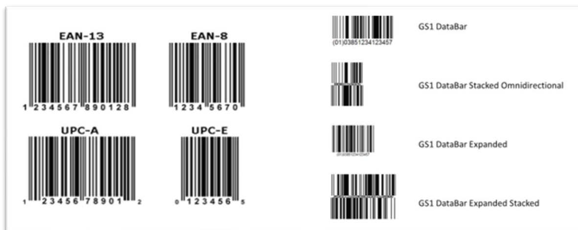
Slika 8: Primjeri GTIN kodova i GS1 DataBar-ova