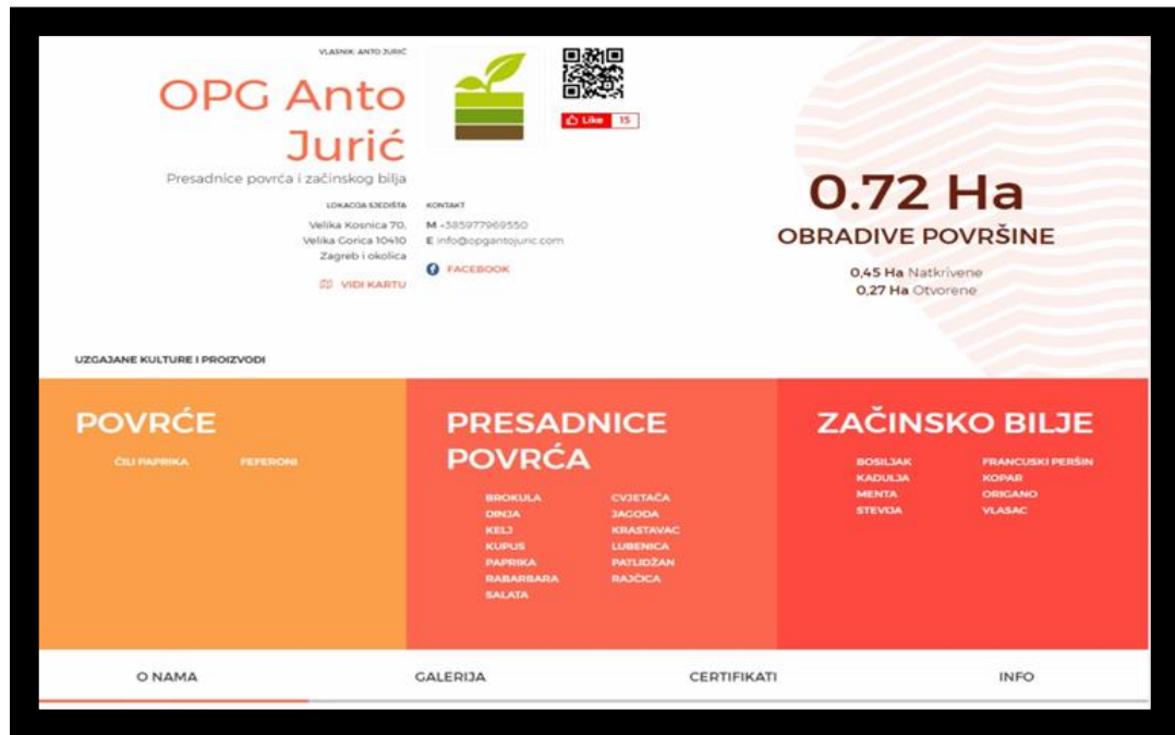
Slika 6. Osnovni podaci i prikaz djelatnosti