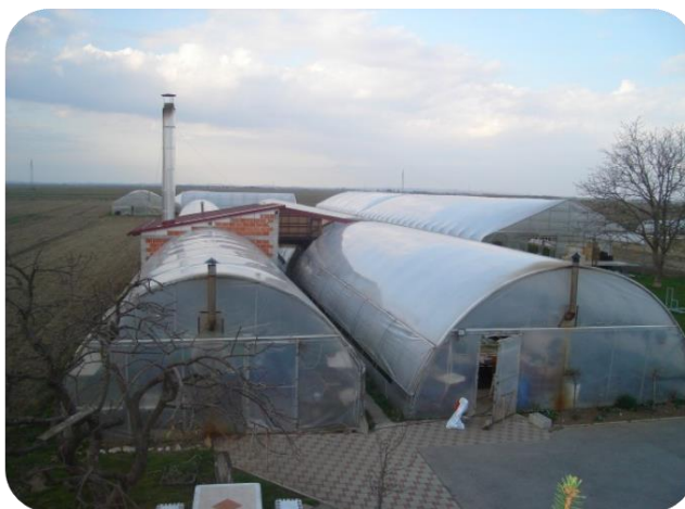
Slika 1. Plastenici PG Težak Mladen

Danas gospodarstvo posjeduje 10 ha oranica na kojima uzgaja kukuruz, pšenicu, krumpir i varaždinsko zelje. Gospodarstvo također posjeduje i 0,56 ha zaštićenih prostora (slika 1) u kojima uzgaja presadnice povrća (rajčice, paprike, salate, kupusa...) i cvijeća (sezonsko cvijeće).