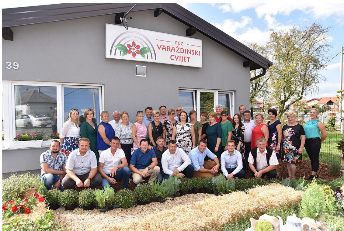
Slika 2. Članovi PCZ Varaždinski cvijet