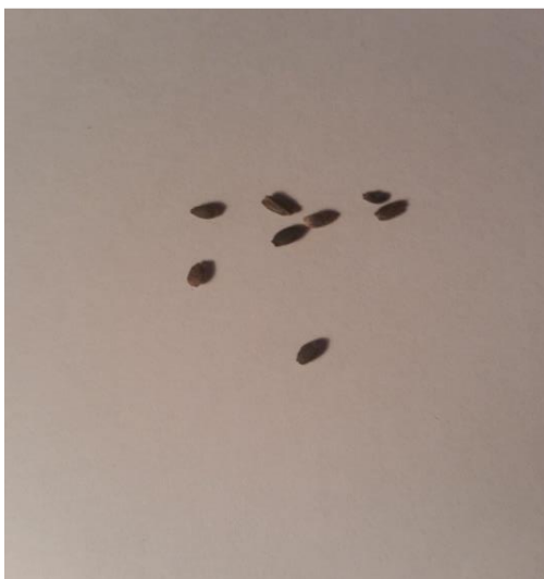
Slika 1. Sjeme crvene kadulje ( Salvia splendens L.)

Listovi su nasuprotni, ovalni ili srcoliki, tamnozeleni, izražene nervature, krupno nazubljenog ruba, s naličja pepeljast. U povoljnim uvjetima može doseći visinu do 1 m. Grmolikog je rasta, a stabljika joj je četverouglasta. Cvjetovi su u kasnu jesen vatreno crvene boje. Uspijeva na sunčanom i toplom položaju uz umjerenu vlagu. Tlo ne smije biti jako hranjivo jer će se razvijati manji broj cvjetova uz više listova. Uzgajaju se mnogi kultivari ljubičastih, bijelih i grimiznih boja. Najljepša je u jesen jer je tada na vrhuncu svoj razvoja. Razmnožava se sjemenom i reznicama. Sjeme koje je crne do tamno smeđe boje, 2 mm dužine i 1 mm širine. Sije se u siječnju i veljači u kontejnere u zaštićenom prostoru (Auguštin, 2003).