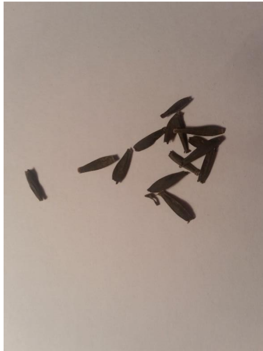
Slika 5. Sjeme daliije ( Dahlia pinnata L.)

Cvjetovi su jednobojni, dvobojni ili višebojno prošarani, nijansirani u raznim kombinacijama boja. Zahtjeva mnogo sunca, te dobro drenirano tlo bogato humusom. Sjeme koje je crne boje veličine 1,5 cm. Najbolje se razmnožava sjemenom ili reznicama (Karlović, Vrdoljak, Pagliarini, 2005).