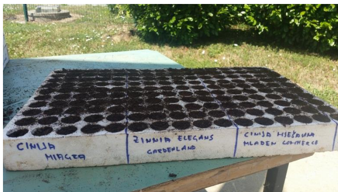
Slika 20. Primjer ispitivanja klijavosti sjemena u kontejneru na cvjetnoj vrsti cinija ( Zinia elegans L.)