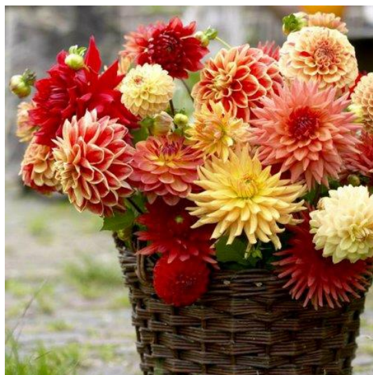
Slika 6. Dahlia pinnata L., Daliija, Georgina