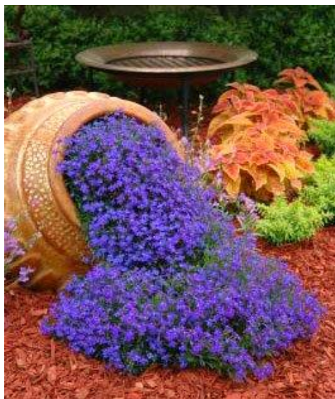
Slika 12. Lobelija ( Lobelia erinus L.)