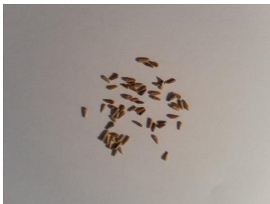
Slika 7. Sjeme Lijepe kate ( Callistephus chinensis L.)

Lijepa kata je jednogodišnja zeljasta cvjetna vrsta, koja pripada porodici Asteraceae. Specifična je po svom mirisu. Uzgajaju se niske, patuljaste sorte do 15 cm visine, i visoke sorte koje dosegnu visinu preko 70 cm. Stabljika je vrlo razgranata i piramidalna. Cvjetovi su različitih boja i veličina. Cvatu u bijelim, ružičastim, crvenim, ljubičastim i plavim nijansama, a ima i dvobojnih koji sličje cvjetnim vrstama poput krizantema ili anemone. Cvate od srpnja do listopada ovisno o sorti. Lijepa kata uspijeva na sunčanom položaju i u glinasto humusnom tlu s puno hranjiva. Razmnožava se sjemenom. Ono varira u smeđim nijansama do 1 cm veličine (Auguštin, 2003 ).