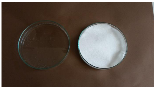
Slika 16. Priprema petrijevki za postavljanje sjemenki na filter papir

Energija i klijavost sjemena ispitani su u 4 ponavljanja po 50 sjemenki