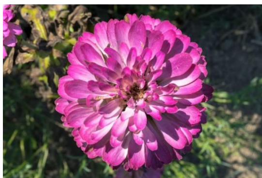
Slika 8. Lijepa kata ( Callistephus chinensis L.)