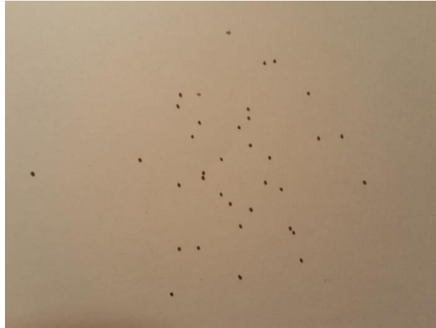
Slika 3. Sjeme petunije ( Petunia hybrida L.)