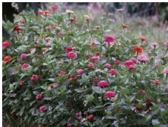
Slika 10. Cinija ( Zinnia elegans L.)