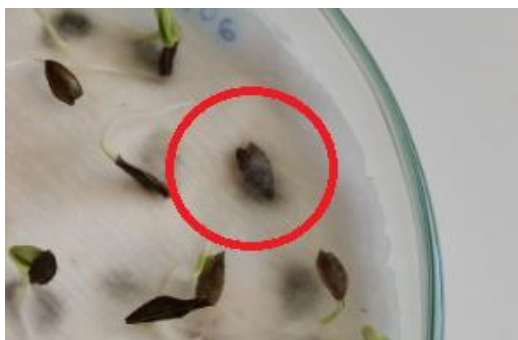
Slika 19. Mrtvo sjeme ( MS )