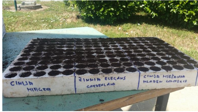
Slika 20. Primjer ispitivanja klijavosti sjemena u kontejneru na cvjetnoj vrsti cinija ( Zinia elegans L.)