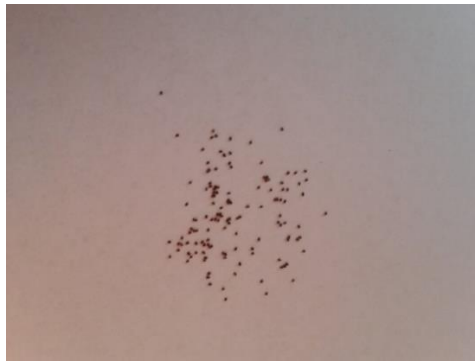
Slika 11. Sjeme lobelije ( Lobelia erinus L.)

Lobelija je jednogodišnja, grmolika vrsta, koja spada u porodicu Lobeliaceae . Raste kao grmić visok 10 cm koji je prepun malih listova i plavičastih do plavičasto ljubičastih sitnih cvjetova. Listovi su naizmjenični, nazubljenog ruba, ponešto sitno dlakavi. Gornji listovi su linearni, a donji ovalni. Tijekom rasta stvara jastučasti grm, te se koristi za sadnju cvjetnih gredica, kao obrub duž gredica, za sadnju u zdjelama ili sandučićima na balkonima. Uzgajaju se uspravni i viseći kultivari. Preferira hranjiva tla bogata humusom, dobre propusnosti za vodu. Podnosi sunce, ali ne i vrućine, stoga je zaključno da prednost ima sjenovit položaj. Obilno cvate od lipnja do kraja rujna. Sjeme je okruglo i crno, vrlo sitno, gotovo nevidljivo (Auguštin, 2003).