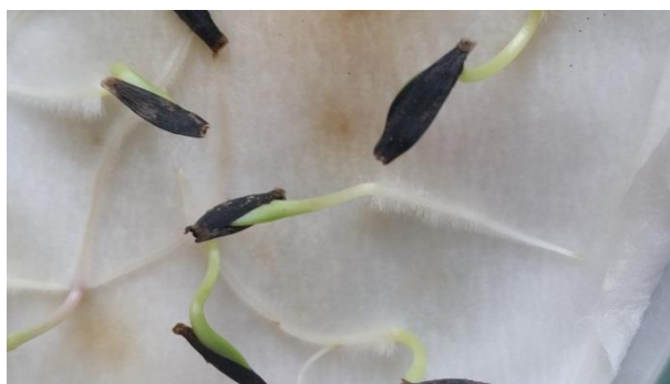
Slika 17. Normalan klijanac ( NK )

Nakon proteka broja dana predviđenih za ispitivanje izračunata je klijavost sjemena, kao postotak broj normalnih klijanaca (NK), broj anomalnih klijanaca (AK), broj mrtvog sjemena (MK).