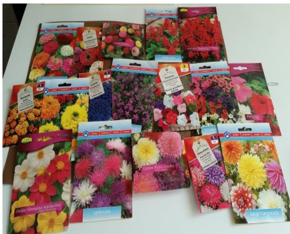
Slika 15. Odabrane vrste certificiranog sjemena cvjetnih vrsta