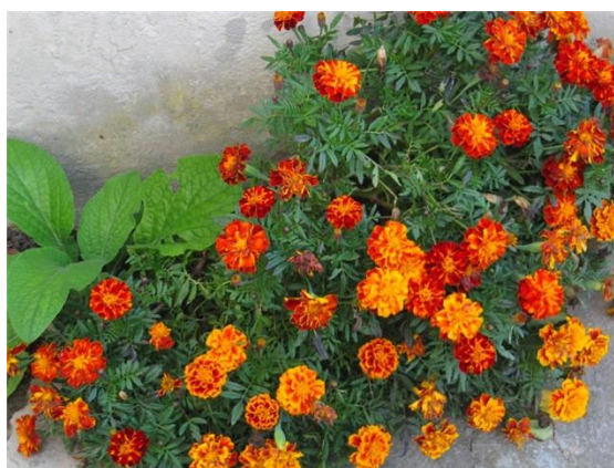
Slika 14. Kadifica ( Tagetes erecta L.)