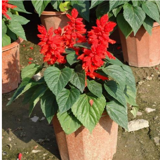
Slika 2. Crvena kadulja ( Salvia splendens L.).