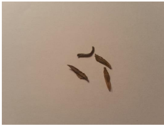
Slika 9. Sjeme cinije ( Zinnia elegans L.)

Cinija je jednogodišnja cvjetna vrsta iz porodice Asteraceae . Jedna je od najzahvalnijih ljetnih cvjetnica visine od 20 do 70 cm. Stabljika joj je uspravna, jednostavna ili razgranata, prekrivena dlačicama. Listovi su nasuprotni, ovalnog oblika, sroliki, dlakavi i hrapavi. Cvjetovi su smješteni na vrhu stabljike u različitim nijansama boja osim plave. Cvatnja traje od lipnja pa sve do listopada. Razmnožava se sjemenom koje je srolikog ili šiljastog oblika do 1 cm dužine, smeđe nijanse. Zahtjeva sunčano mjesto, zaštićeno od vjetra. Uspijeva na humusnom tlu, ali će uspijevati i na siromašnim tlima. Osnovna namjena cinija je sadnja na cvjetnu gredicu s ostalim ljetnicama, međutim zbog različitih veličina može se koristiti i u druge svrhe (Gospodarski list, 2013 ).