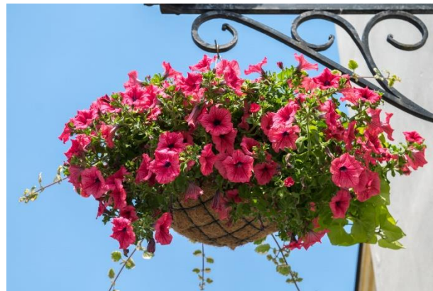
Slika 4. Petunija ( Petunia hybrida L.)