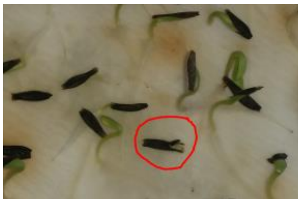
Slika 18. Anomalni klijanac ( AK )