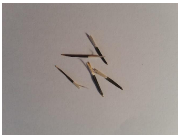
Slika 13. Sjeme kadifice ( Tagetes erecta L.)

Kadifica je jednogodišnja vrsta iz porodice Asteraceae . Razlikujemo visoke i niske sorte. Niske su visine od 30 cm do 60 cm., dok visoka naraste do 1 m. Nazivaju ih često „kranjčeci“. Ima specifičan miris po čemu su i prepoznatljive. Uspravnog je rasta, razgranata, a na kraju cvjetne stapke nalazi se veliki loptasti žuti, narančasti ili bijeli cvat. Listovi su neparnoperasti, tamnozeleno boje. Na otvorene gredice sadi se polovicom svibnja. Izlučevine iz korijena kadifica, mirisom tjeraju nametnike i nematoda iz tla pa su dobrodošle u svakom vrtu. Podnose sunčana mjesta, laganu polusjenu, te sušu. Sjeme je igličastog oblika dužine od 1,50 do 2 cm (Auguštin, 2003.). Boja sjemena je crna, iako se u uzorku mogu naći sjemenke bež boje koje su najčešće šture i ne klijavu.