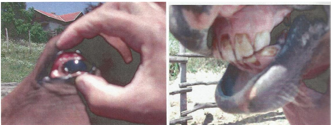
Slika 9. Pregled sluznice oka i provjera stanja kapilarne cirkulacije radi utvrđivanja eventualne dehidriranosti