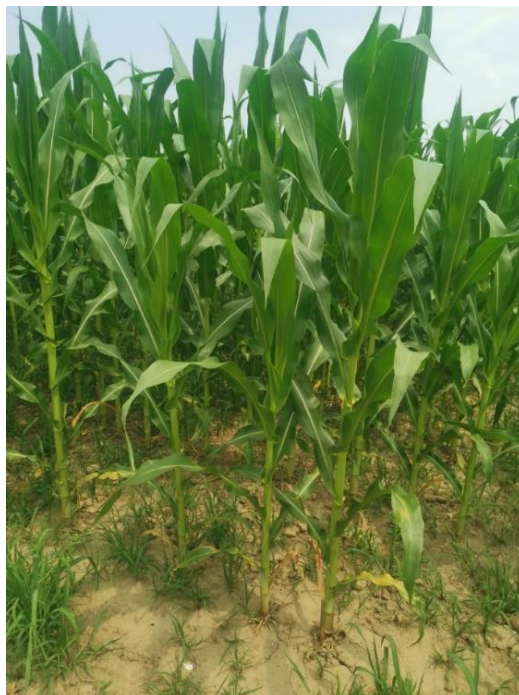
Slika 2. Stabljika kukuruza

Stabljika kukuruza (Slika 2) je robusna, glatka, koncentrična, ali elastična i ispunjena parenhimom (nije šuplja kao prave žitarice). Sastoji se od nodija (koljenaca) i internodija (međukoljenaca). Ovisno o klimatskim uvjetima, plodnosti tla, agrotehničkim mjerama, ali i o područjima uzgoja, kukuruz može razviti stabljiku od 0,5 m pa do 7 m (u Hrvatskoj najčešće do 3 m). Neki hibridi podložni su stvaranju zaperaka koji se formiraju iz podzemnih koljenaca. Zaperci nisu poželjni zbog toga što troše hranjive tvari i oduzimaju vegetativni prostor primarnoj biljci. Nodiji stabljike pokriveni su rukavcima listova gdje se u središnjem djelu stabljike formiraju ženski spolni organi, klipovi, kojih može biti od jedan do pet (najpoželjnije od jedan do dva). Na vrhu stabljike razvija se i muški spolni organ, tzv. metlica (Kovačević i Rastija, 2014).