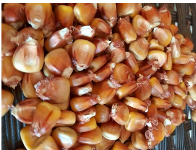
Slika 4. Zrno kukuruza

Zrno kukuruza ( caryopsis ) (Slika 4) je jednosjemeni plod, a sastoji se od tri glavna dijela: omotača, endosperma i klice (Kovačević i Rastija, 2014). Omotač je dio ploda koji služi za zaštitu unutrašnjeg dijela ploda od bioloških i mehaničkih oštećenja. Pigmenti, koji se nalaze u stanicama omotača, daju crvenu do prozirnu boju. Stanice endosperma ispunjene su škrobom koji je uz proteine iznimno važan za rast klice. Najvažniji dio ploda, klica, nalazi se iznad drške. Bogata je uljem (33%), bjelančevinama (18,4%), šećerom i pepelom (10,8%) (Grbeša, 2016).