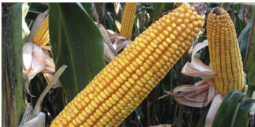
Slika 7. Pioneer hibrid P9911

P9911 - pripada FAO grupi 450, a po strukturi je tvrdi zuban. Preporučeni sklop je 70-75 000 biljaka/ha. To je hibrid sa vrlo visokim potencijalom rodosti u svim uvjetima uzgoja. Zrno je u tipu tvrdog zubana odlične kvalitete. Stabljika je viša. Može se koristiti i za spremanje kvalitetne silaže zbog stabljike sa izraženim „stay green“ efektom. Tolerantnost na sušu je iznadprosječna. Odlična adaptabilnost omogućava uzgoj na području čitave Hrvatske ( https://www.corteva.hr/proizvodi/sjeme.html ).