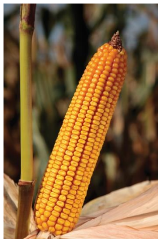
Slika 5. Hibrid Bc 572

Bc 572 – pripada FAO grupi 500. Ima odličnu kvalitetu zrna, brzo otpušta vodu iz zrna i ima veliku rodnost. Ima nižu, čvrstu stabljiku te duge zelene listove. Klip mu je velik, privlačnog izgleda. Veoma je tolerantan na sušu ( https://bc-institut.hr/kukuruz/bc-572/ ).