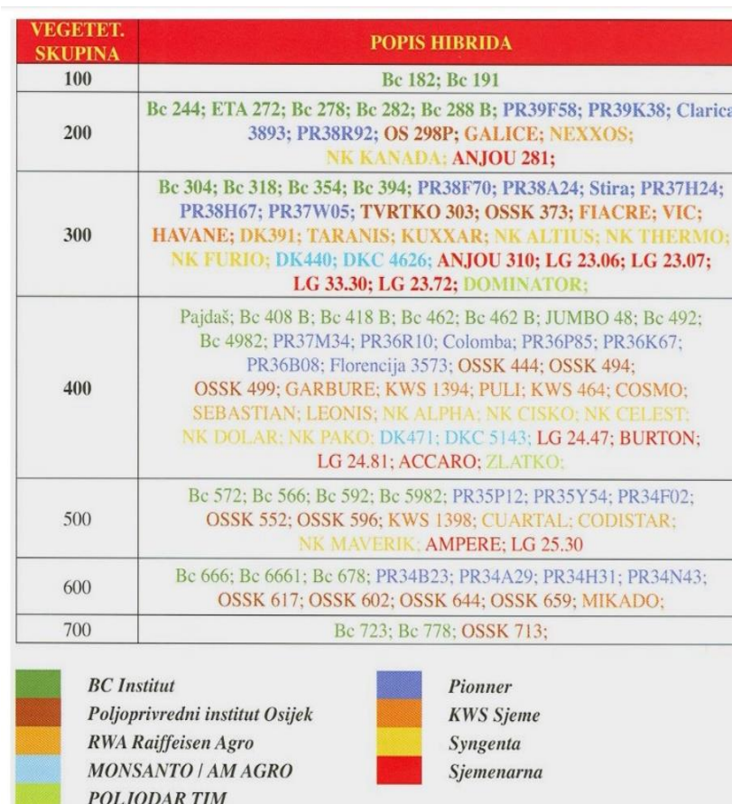
Tablica 2. Popis hibrida kukuruza po vegetacijskim skupinama (FAO 100 – 700), proizvođačima i distributerima