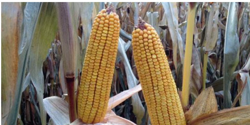
Slika 8. Pioneer hibrid P0023

P0023 - pripada FAO grupi 420, a po strukturi je zuban. Preporučeni sklop je 70- 75 000 biljaka/ha. Hibrid pogodan za uzgoj na području čitave Hrvatske. Otpuštanje vlage iz zrna je vrlo brzo. Ima dobru toleranciju na sušu. Podnosi više temperature tijekom cvatnje ( https://www.corteva.hr/proizvodi/sjeme.html ).