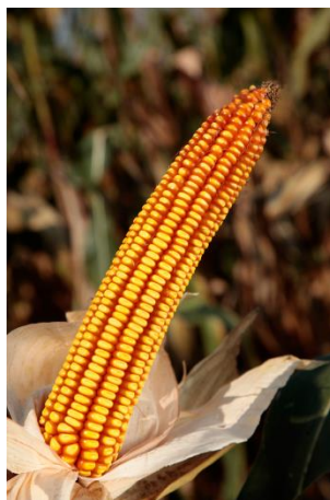
Slika 6. Hibrid Bc Pajdaš

Bc Pajdaš - pripada FAO grupi 490. Zove se još i prijateljem bez mane zbog svojih karakteristika. Ima visok urod i odličnu kvalitetu zrna te odličan rani porast. Stabljika mu je niska i čvrsta, list zeleni dugi, a klip velik. Ima crveno, krupno zrno te je tolerantan na kukuruznog moljca ( https://bc-institut.hr/kukuruz/pajdas/ ).