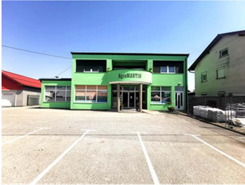
Slika 4. Poduzeće AgromARTIN d.o.o.