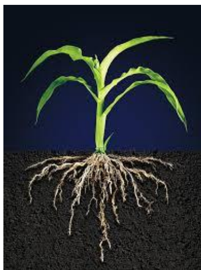
Slika 1. Korijen kukuruza