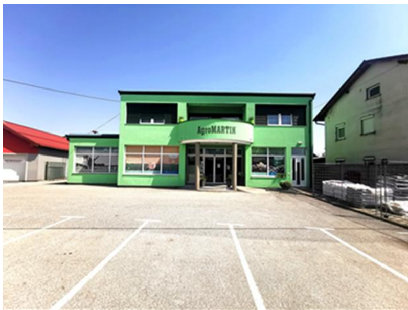
Slika 4. Poduzeće AgromARTIN d.o.o.