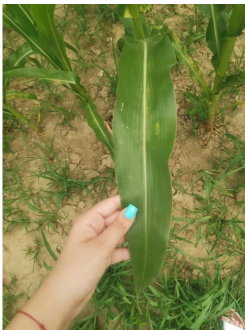
Slika 3. List kukuruza

tada od presudnog značaja za mladu biljku. Mraz i niske temperature mogu ih uništiti, a posljedica je kašnjenje fenofaza rasta i razvoja. Nakon pojave pravih listova klicini listovi se osuše. Pravi listovi (Slika 3) građeni su od jezička, plojke i rukavca, smješteni su spiralno na stabljici i pričvršćeni su za nodije stabljike rukavcem. Plojka je građena specifično, u obliku slova „V“, kako bi na taj način prikupila i najmanju količinu vode i usmjerila je prema korijenu. Na svakom nodiju nalazi se po jedan list pa koliko biljka ima nodija, toliko ima i listova. Rokovi sjetve utječu na stvaranje broja listova pa tako kukuruz posijan u optimalnom roku ima više listova nego onaj koji je posijan kasnije, naknadno ili postrno. Najveće listove kukuruz razvija u središnjem dijelu dok se prema tlu i prema vrhu njihova količina smanjuje. Središnji listovi imaju najznačajniju ulogu u stvaranju suhe tvari. Listovi omotača klipa ili listovi komušine razvijaju se na nodijima drške klipa koji su jako zbijeni pa listovi komušine čvrsto pokrivaju jedan drugoga i samo se na vanjskim listovima stvara zelena boja (klorofil). Broj listova na stabljici istovjetan je broju listova komušine omotanih oko klipa. Listovi omotača veoma su važni jer štite klip od vanjskih štetnih utjecaja (bolesti, štetnici, niske temperature, ptice i dr.).