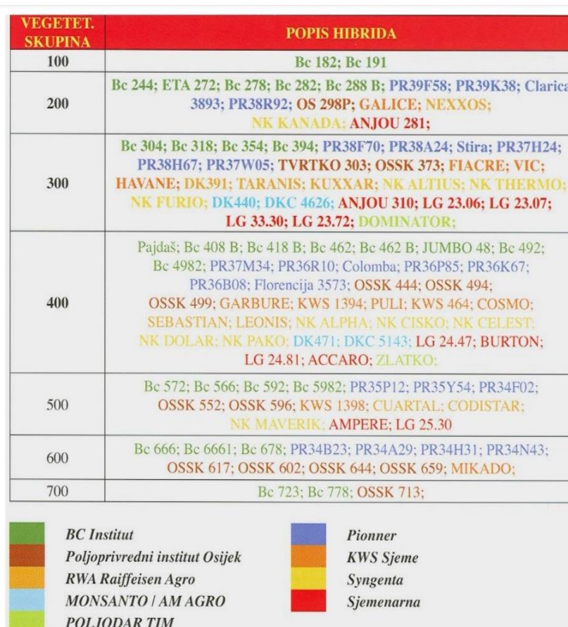
Tablica 2. Popis hibrida kukuruza po vegetacijskim skupinama (FAO 100 – 700), proizvođačima i distributerima