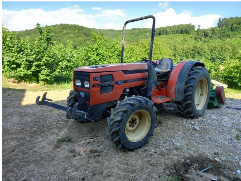
Slika 6. Traktor Same Frutteto