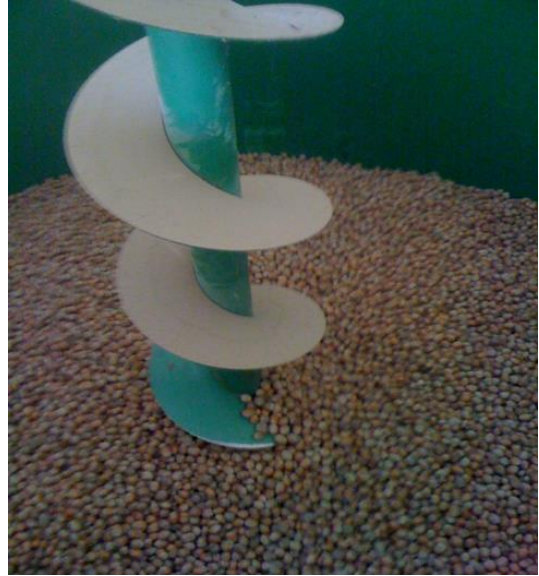
Slika 18. Unutrašnjost Sušare