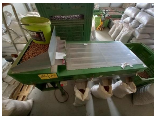
Slika 25. Kalibrator