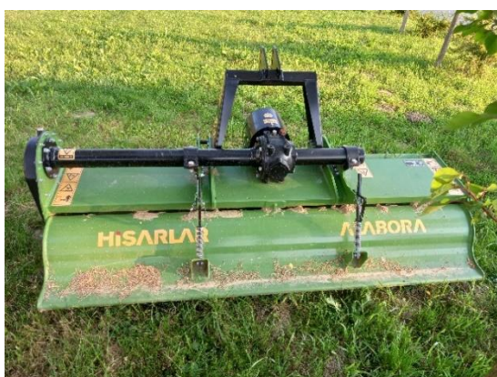
Slika 9. Freza Hisarlar