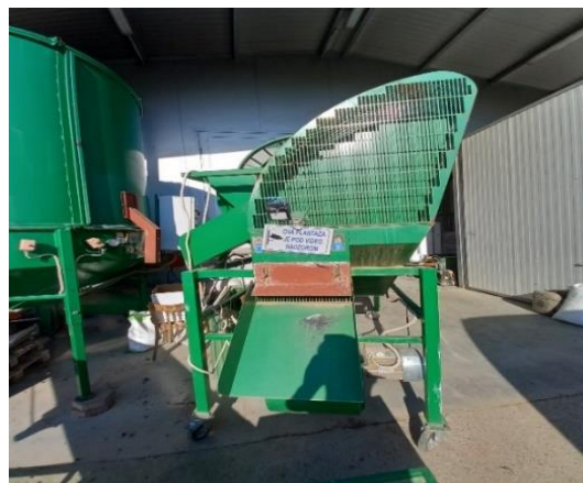
Slika 19. Separator