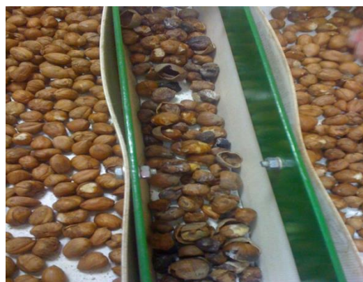
Slika 28. Traka za prebiranje