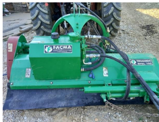
Slika 8. Malčer Facma