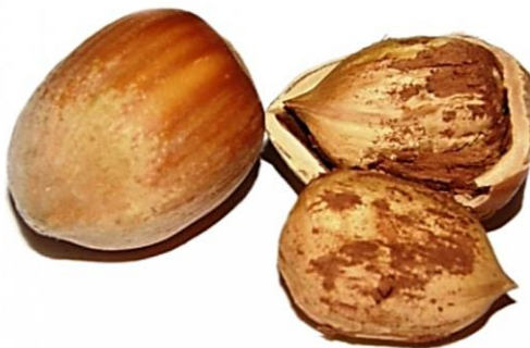
Slika 1. Istarski duguljasti lješnjak