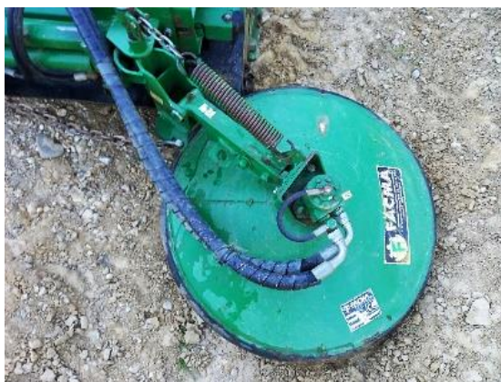
Slika 7. Malčer Facma

Malčer ima višestruku namjenu u poljoprivredi. Može se koristiti u održavanju zelenih površina, usitnjavanju žetvenih ostataka te ostataka rezidbe u voćnjacima. Obrt Minas Zrno 1 posjeduje malčer firme Facma 180 sa pomičnim diskom za unutar rednu obradu. Malčer je vrlo robusne konstrukcije te ima mogućnost hidrauličnog pomaka. Kada je maksimalno izvučen njegova duljina iznosi 180cm uz dodatak diska od 60 cm što je idealno za malčiranje u dva prohoda budući da je među redni razmak u nasadu 5m. Težina malčera je 600 kg uz dodatak diska koji teži 70kg. Na radnoj osovini se nalazi 16 radnih elemenata „čekića“, a na disku 6 radnih elemenata u obliku noževa. Disk je sa vanjske strane obložen gumom kako prilikom udara u stablo ljeske ne bi došlo do oštećivanja kore stabla. Na malčeru se nalaze četiri remena koja prenose zaokretni moment sa reduktora na osovinu. Prilikom korištenja malčera provjerava se razina ulja, zategnutost remenja te se podmazuju ležajevi i kardanski prijenosnik Malčiranje plantaže obavlja se od 8 do 10 puta godišnje ovisno o vremenskim prilikama. Nakon svake upotrebe stroja stroj se opere visoko tlačnim peračem od zemlje i ostataka trave kako ne bi došlo do pojave korozije. Na slikama 7. i 8., prikazan je navedeni malčer.