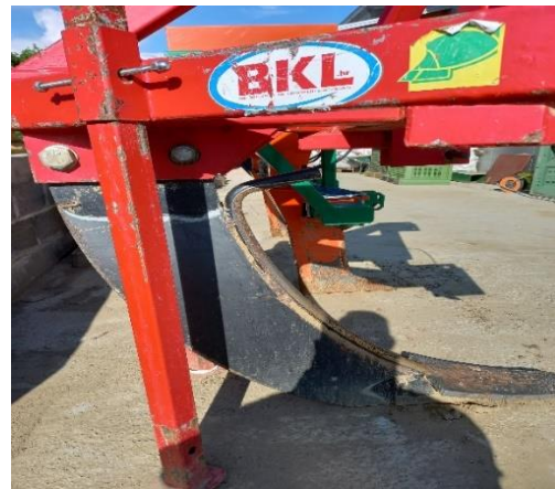
Slika 11. Podrivač