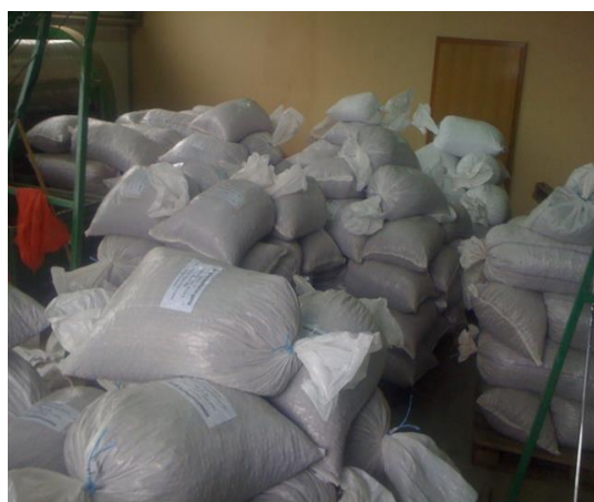
Slika 29. Pakiranje lješnjaka