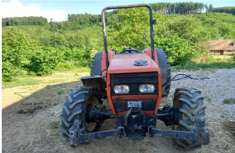
Slika 5. Traktor Same Frutteto