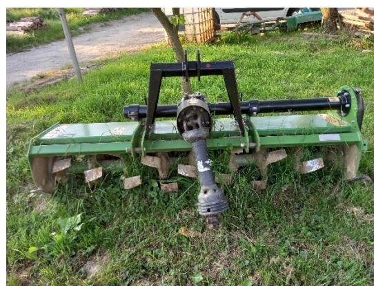
Slika 10. Freza Hisarlar