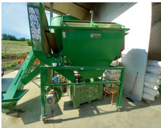
Slika 18. Separator

Nakon berbe lješnjak je potrebno dodatno pročistiti. Tome služi separator za odvajanje nečistoća. Kosi transporter postavi se ispred separatora te se u njega nasipa lješnjak iz vreće. Lješnjak putuje transporterom te dolazi u separator. Separator odvaja lješnjak od nečistoća poput malih grana, zemlje, lišća i ostalog. Protok zraka koji stvara ventilator odvaja proizvod od ostataka pomiješanih s njim, u funkciji specifične težine. Pokreće ga električna energija, koristi vlastiti motor snage 3 kW. Na izlaznom otvoru postavi se sanduk u kojeg ispada očišćeni lješnjak. Na slikama 18. i 19., prikazan je navedeni separator