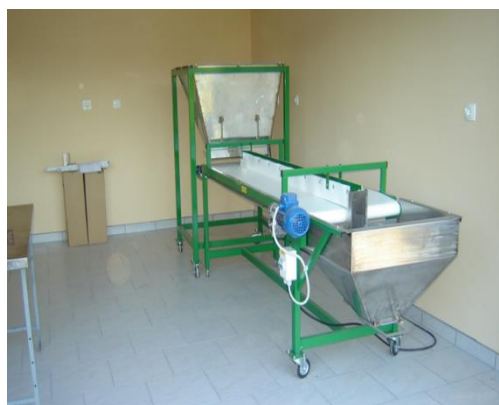
Slika 27. Traka za prebiranje

Drobljeni lješnjak dolazi na traku za prebiranje. Idealno je da na traci radi pet ljudi. Inox Daruvar traka za prebiranje ima 2 korita. U veće korito, kapaciteta 60kg nasipa se drobljeni lješnjak te se on kreće po pokretnoj traci. Dva radnika sjede na jednoj strani trake, dva na drugoj strani te jedan vrši završnu kontrolu na manjem koritu kapaciteta 40kg. Na sredini trake je ograđen manji odjeljak u koji radnici ubacuju ljuske koje ostaju nakon drobljenja. Polovične i smežurane lješnjake radnici stavljaju u posebne posudice. Traka je osvijetljena kako bi radnici lakše uočili ljuske, smežurane i polovične lješnjake. Kapacitet rada trake ovisi o kvaliteti lješnjaka i radnom učinku ljudi koji ovdje rade. Kod uobičajene kvalitete, dnevno se može prebrati do 500 kg jezgre lješnjaka. Nakon što se napuni manje korito ono se ispušta u vreće te se vreće pakiraju uglavnom po 25kg, ovisno o narudžbi. Pomoću ove trake moguće je u potpunosti prebrati lješnjak. Na slikama 27. i 28. prikazana je navedena traka za prebiranje.