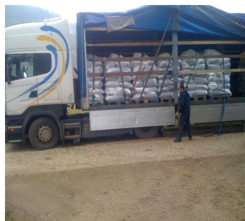
Slika 3019. Odvoz lješnjaka