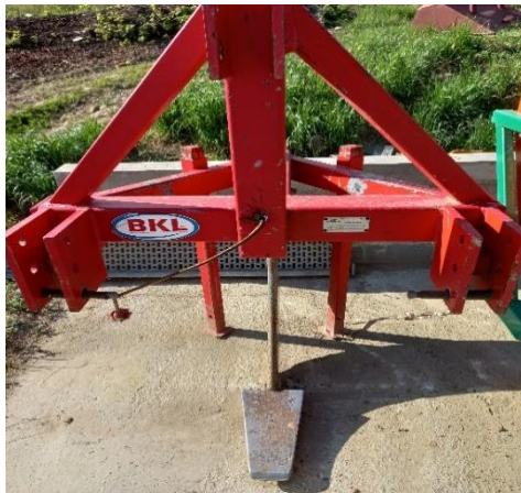
Slika.11. Podrivač

Podrivač se koristi u obradi tla za prozračivanje zemlje, rješavanja zaostalog korijenja drveća i korova, razbijanja zbitosti tla na dubini ispod razine tradicionalnog korištenja tanjurače ili drljače. Većina poljoprivrednih strojeva mogu razbiti i okrenuti površinu tla do dubine 15-20 cm, dok će podrivač razbiti i popustiti tlo u dvostruko većim dubinama. Obrt koristi BKL-ov podrivač sa jednim radnim tijelom. Jednom godišnje se njime prođe po sredini reda na dubinu od 30- 40 cm te se tako tlo prozrači. BKL-ov podrivač je izuzetno jednostavan za korištenje jer je sve mehanički. Nakon upotrebe, podrivač se zaštiti WD sprejom kako ne bi došlo do pojave korozije. Na slikama 11. i 12., prikazan je navedeni podrivač.