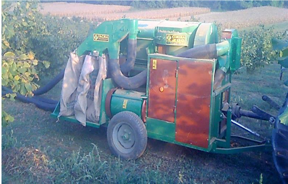
Slika 16. Kombajn