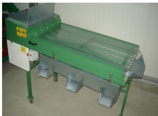
Slika 24. Kalibrator

Nakon što se lješnjak posuši dolazi na stroj za kalibriranje. Kalibriranje je neophodno kako bi se plodovi što kvalitetnije, uz vrlo malo loma, kasnije mogli zdrobiti drobilicom. Vrlo je bitno da je lješnjak u potpunosti očišćen od komušine kako ne bi došlo do zastoja tokom kalibriranja. Kalibrator inox- Daruvar sadrži četiri para rotirajućih valjaka koji su međusobno odmaknuti na početku 12mm a na kraju 18mm. Rotacijom i nagibom valjaka lješnjak putuje između njih, te prema veličini ispada u metalne usmjerivače na kojima su postavljene PVC vreće. Tako se postiže kalibraža lješnjaka 12-18mm. Zbog jednakih veličina plodova nakon kalibriranja drobilica će plodove zdrobiti uz oko 2% loma. Kalibrator pokreće Končarev elektro motor sa reduktorom snage 220 V. Kapacitet rada na ovom kalibratoru iznosi 150 kg/h. Kalibrator je pokretan, montiran je na kotače. Redovito održavanje kalibrатора sastoji se od: čišćenja prašine, podmazivanja ležajeva i eventualne zamjene potrošenih remena. Na slikama 24. i 25., prikazan je navedeni kalibrator.