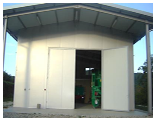
Slika 4. Proizvodni pogon