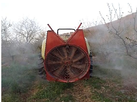
Slika 13. Atomizer Agromehanika