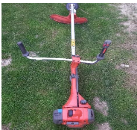
Slika 14. Trimer Husqvarna

Obrt Minas zrno 1 koristi Husqvarnin 545rx trimer za košnju trave između redova gdje ju disk malčera ne može dohvatiti. Na plantaži postoje dvije velike strmine gdje su posađeni lješnjaci međutim nije moguće obavljati poslove pomoću traktora i njegovih priključaka te se tu trava kosi trimenom. Husqvarnin 545 rx trimer opremljen je antivibracijskim sustavom u 4 točke s olakšanim paljenjem dekompresijskim ventilom. Trimer je izuzetno snažan (2,8 KS), zapremnina motora je 45,7 cm 3 , te težine 8,9 kg. Opremljen je poluautomatskom glavom pogodnom za flaks debljine 3-3,3 mm te dodatnim trokrakim nožem. Na trimenu se nalazi jednocilindrični dvotaktni motor. Prije svake upotrebe spremnik za gorivo se napuni do kraja, kako bi se pri svakoj upotrebi koristilo novo gorivo. Nekoliko puta tijekom sezone skida se filter zraka i čisti pomoću kompresora te se podmazuje glava trimera. Na slikama 15. i 16., prikazan je navedeni trimer.