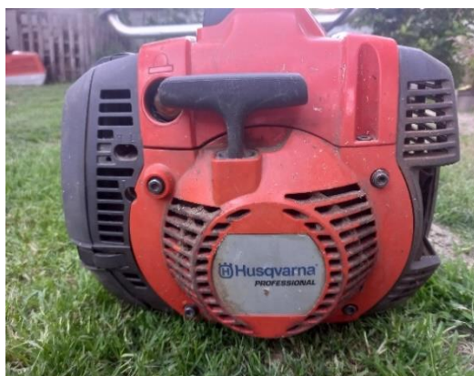
Slika 15. Trimer Husqvarna