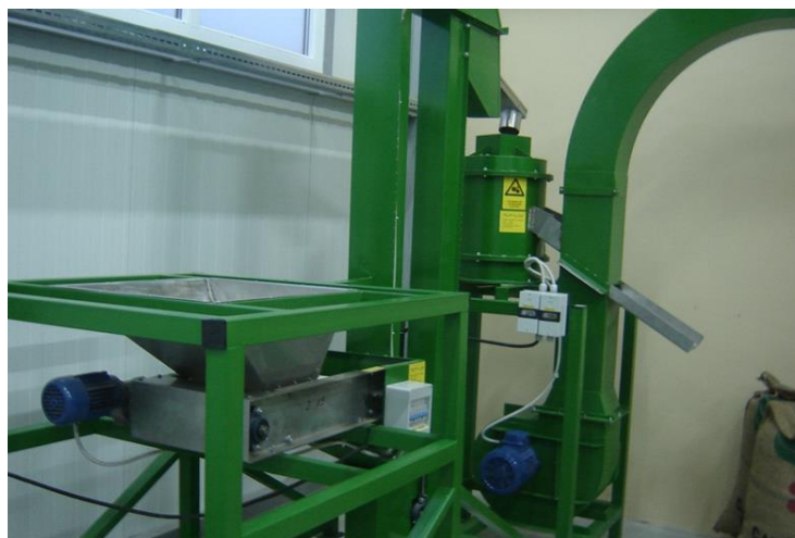
Slika 26. Drobilica

Nakon što je lješnjak kalibriran po veličinama dolazi na drobljenje, odnosno odvajanje ljuske od ploda. Drobilica inox Daruvar radi na način da se prema veličini kalibriranog lješnjaka zategnu ili otpuste ploče za drobljenje. Zatim se lješnjak nasipa u „korito“ te se transportnom trakom dovede do lopatica koje ga bacaju u bubanj. U bubnju se nalaze dvije nazubljene ploče koje se okreću te tako drobe lješnjak. Nakon što je lješnjak zdrobljen, ljuska i plod zajedno putuju do ventilatora. Ventilator ispuše ljusku kroz jedan otvor van dok plod ostaje i putuje do daljnjeg otvora ispred kojeg se postavi PVC vreća u koju pada plod. Važno je da prilikom drobljenja rešetka na ventilatoru ne bude previše otvorena kako se uz ljusku ne bi izbacivao sitni i polomljeni lješnjak. Treba na vrijeme zamijeniti vreću kako se ventilator ne bi zaštopao te onda ne bi izbacivao ljusku. Također treba dobro namjestiti otvor na transportnoj traci kako ne bi došlo previše lješnjaka na nju i tako zaštopalo lopatice koje vode do bubnja. Drobilicu pokreće Končarov elektromotor sa reduktorom snage 380V. Kapacitet rada ove drobilice je 200kg/h. Redovito održavanje drobilice sastoji se od: čišćenja prašine, podmazivanja ležajeva i eventualne zamjene potrošenog remenja. Na slici 26., prikazana je navedena drobilica.