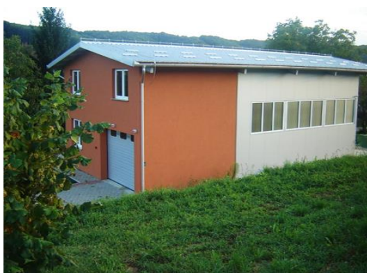
Slika 3. Proizvodni pogon

Obrt Minas Zrno 1 posluje od 1992. godine u Ludbregu, te se u to vrijeme primarno bavi prženjem i prodajom kave po lokalnim trgovinama i ugostiteljskim objektima. Godine 2004. počinje sa sadnjom lješnjaka, te se plantaža iz godine u godinu širila da bi danas obuhvaćala površinu od 7,3 ha odnosno cca. 3500 sadnica lijeske. Posao sa kavom se i dalje nastavio, međutim u puno manjem opsegu zbog dolaska većih trgovačkih lanaca ( Plodne i Spar) te je plantaža lješnjaka postala glavna djelatnost obrta. Plantaža se nalazi u selu Segovina, nedaleko od Ludbrega. Prvih godina većina poslova na plantaži obavljala se ručno što je iziskivalo puno uloženog truda i vremena sve do 2012. - te godine kada je preko IPARD projekta sagrađena proizvodno- polovna zgrada u sklopu plantaže s namjenom obrade, dorade, prerade i distribucije lješnjaka. Ovo je najmoderniji novi pogon za doradu i skladištenje lješnjaka u našem kraju. Preko projekta su nabavljeni i svi strojevi koji su potrebni za preradu i proizvodnju lješnjaka (sušara, krekalica elevatori, kalibrator, traka za prebiranje, kombajn za berbu). Navedeni strojevi su uvelike zamijenili dotadašnji ljudski rad te tako olakšali proizvodnju lješnjaka, povećali dohodak obrta i omogućili reinvestiranje u povećanje površina pod nasadom lijeske na 7,3 ha. Na slikama 3. i 4., prikazan je navedeni objekt.