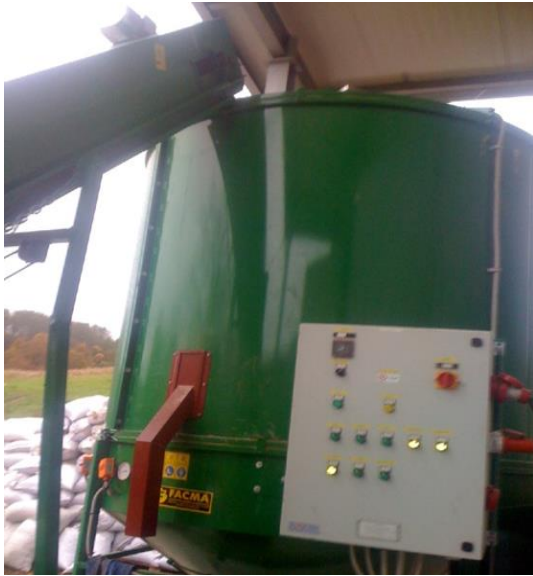
Slika 17. Sušara