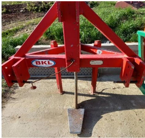
Slika.11. Podrivač

Podrivač se koristi u obradi tla za prozračivanje zemlje, rješavanja zaostalog korijenja drveća i korova, razbijanja zbitosti tla na dubini ispod razine tradicionalnog korištenja tanjurače ili drljače. Većina poljoprivrednih strojeva mogu razbiti i okrenuti površinu tla do dubine 15-20 cm, dok će podrivač razbiti i popustiti tlo u dvostruko većim dubinama. Obrt koristi BKL-ov podrivač sa jednim radnim tijelom. Jednom godišnje se njime prođe po sredini reda na dubinu od 30- 40 cm te se tako tlo prozrači. BKL-ov podrivač je izuzetno jednostavan za korištenje jer je sve mehanički. Nakon upotrebe, podrivač se zaštiti WD sprejom kako ne bi došlo do pojave korozije. Na slikama 11. i 12., prikazan je navedeni podrivač.