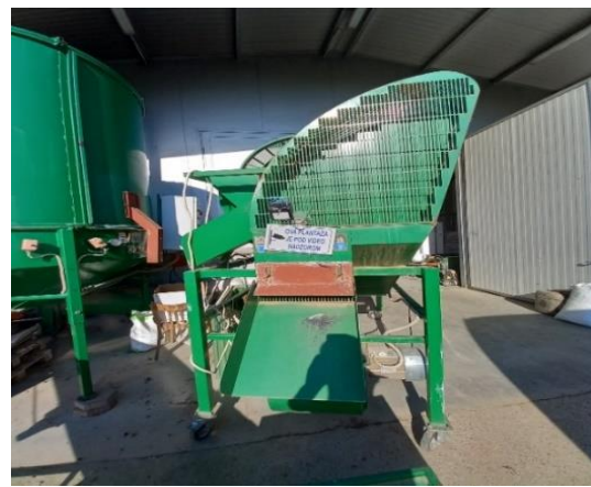
Slika 19. Separator