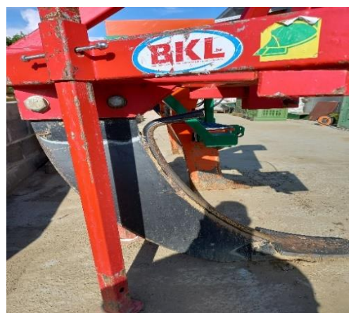
Slika 11. Podrivač