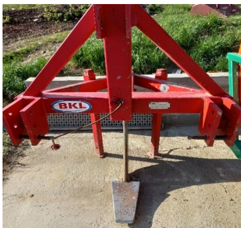
Slika.11. Podrivač

Podrivač se koristi u obradi tla za prozračivanje zemlje, rješavanja zaostalog korijenja drveća i korova, razbijanja zbitosti tla na dubini ispod razine tradicionalnog korištenja tanjurače ili drljače. Većina poljoprivrednih strojeva mogu razbiti i okrenuti površinu tla do dubine 15-20 cm, dok će podrivač razbiti i popustiti tlo u dvostruko većim dubinama. Obrt koristi BKL-ov podrivač sa jednim radnim tijelom. Jednom godišnje se njime prođe po sredini reda na dubinu od 30- 40 cm te se tako tlo prozrači. BKL-ov podrivač je izuzetno jednostavan za korištenje jer je sve mehanički. Nakon upotrebe, podrivač se zaštiti WD sprejom kako ne bi došlo do pojave korozije. Na slikama 11. i 12., prikazan je navedeni podrivač.