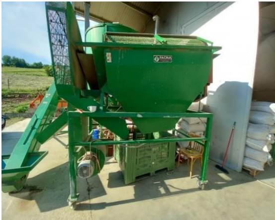
Slika 18. Separator

Nakon berbe lješnjak je potrebno dodatno pročistiti. Tome služi separator za odvajanje nečistoća. Kosi transporter postavi se ispred separatora te se u njega nasipa lješnjak iz vreće. Lješnjak putuje transporterom te dolazi u separator. Separator odvaja lješnjak od nečistoća poput malih grana, zemlje, lišća i ostalog. Protok zraka koji stvara ventilator odvaja proizvod od ostataka pomiješanih s njim, u funkciji specifične težine. Pokreće ga električna energija, koristi vlastiti motor snage 3 kW. Na izlaznom otvoru postavi se sanduk u kojeg ispada očišćeni lješnjak. Na slikama 18. i 19., prikazan je navedeni separator