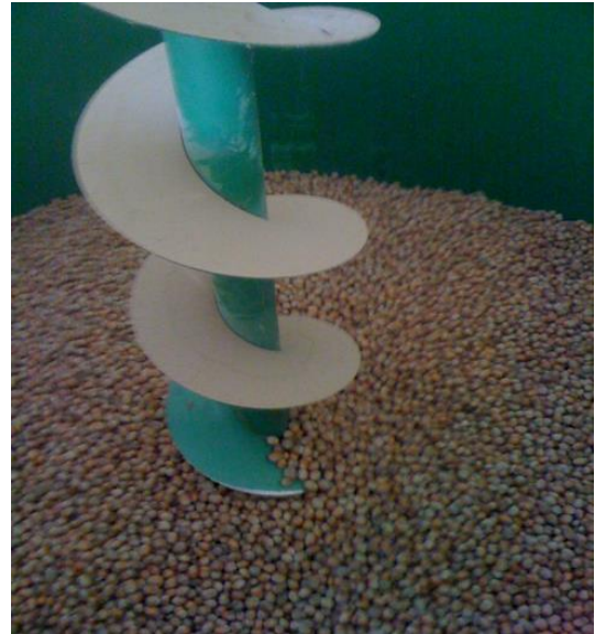
Slika 18. Unutrašnjost Sušare