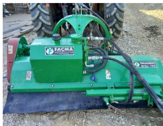
Slika 8. Malčer Facma