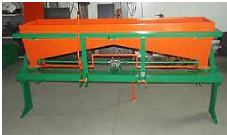
Slika 12. Deponator

Deponatori gnojiva namijenjeni su sa ciljem povećanja iskoristivosti gnojiva i samim time povećanja prihoda i kvalitete. Gnojivo se zahvaljujući njima može plasirati direktno u tlo te tako biti dostupnije voćkama. Metalko je dvoredni deponator koji ima mogućnost pomicanja radnih tijela od 60-160 cm. Radna tijela prilikom gnojidbe nasada lješnjaka su podešena na jednakom razmaku kakav je između kotača traktora kako bi se spriječilo dodatno zbijanje tla koje traktor uzrokuje sojom težinom. Ovim deponatorom se gnojivo maksimalno može unijeti 40 cm u tlo. Kapacitet spremnika je 300kg što je dosta za deponiranje jednog Ha nasada. Kardan pogoni mješač koji miješa gnojivo kako bi se razbile eventualne grude gnojiva koje bi prouzrokovale zaštopavanje cijevi. Hidrauličnom regulacijom protoka na ljestvici od 1-8 moguće je rasporediti koliko želimo gnojiva potrošiti. Prije korištenja deponatora potrebno je podmazati sve ležajeve, a nakon korištenja deponator treba isprati visokotlačnim peraćem kako gnojivo koje uvijek ostane u nekim nedohvatljivim kutovima ne bi uzrokovalo pojavu korozije. Na slici 13., prikazan je navedeni deponator.