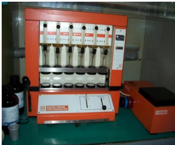
Slika 13. Ekstrakcija masti po Soxletu

sirovih masti povećanjuje sadržaj lipida u krmivima u kojima se oni nalaze u netopivom obliku kao što su fosfolipidi i lipoproteini, soli masnih kiselina ili sapuni.