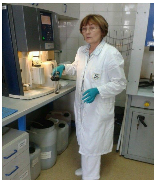
Slika 12. Aparat za destilaciju proteina po Kjeldalhu