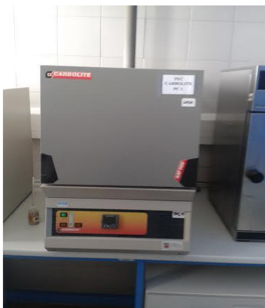
Slika 11. Peć za žarenje