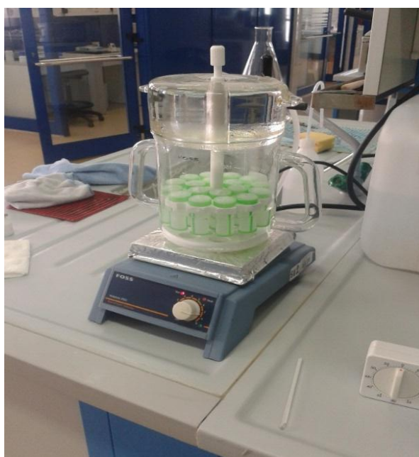
Slika 14. Analizator Fibercap za određivanje sirovih vlakana

Sirova vlakna predstavljaju organski ostatak hrane koji se nije otopio pri kuhanju u otopini 0,225 M sumporne kiseline i zatim 0,313 M otopini natrijeve lužine sukladno proceduri Henneberg i Stohmann (1859). Cilj određivanja sirovih vlakana je odvojiti visoko probavljive od nisko probavljivih ugljikohidrata. Metoda se temelji na pretpostavci da otapanje u razblaženoj kiselini pa lužini oponaša proces probave u probavnom sustavu životinja. Nadalje sadržaj sirovih vlakana je pokazatelj energetske vrijednosti krmiva, a visoki sadržaj sirovih vlakana je znak niske dostupnosti energije. Analizom sirovih vlakana ne određuju se u potpunosti svi sastojci vlaknine voluminozne krme, već samo 50 -80% celuloze, 25% hemiceluloze i 10-50% lignina, a pektini i silikati se ne određuju (Van Soest, 1964). Sirova vlakna određuju se u laboratoriju Odjela za kontrolu kvalitete stočne hrane na analizatoru Fibercap prikazanom na slici 9.