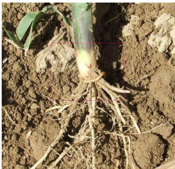
Slika 2. Korijen kukuruza

Korijen kukuruza prodire u dubinu i do dva metra, a u širinu više metara, zahvaća veliki volumen tla, crpeći vodu i hranu. Najveći dio korijenove mase kukuruz razvije do 30 cm dubine, ima dobru upojnu snagu, pa mu to omogućuje da i na lošijim tlima i u uvjetima suše daje relativno dobre prinose. Na razvoj korjenova sustava utječe hibrid, tip tla i njegova plodnost, klimatski uvjeti, agrotehnika, vrijeme i dubina sjetve, hranidba, njega, i zaštita (Kovačević i Rastija, 2009.).