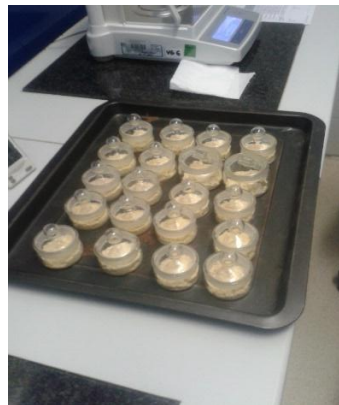
Slika 9. Uzorci