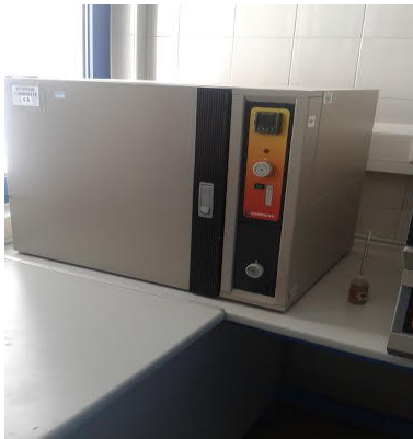
Slika 8. Sušionik

m_2 - masa uzorka prije sušenja u gramima