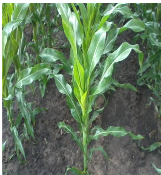
Slika 3. Stabljika kukuruza