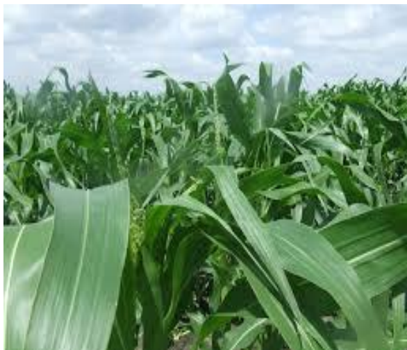
Slika 4. List kukuruza

Na stabljici kukuruza lišće je spiralno raspoređeno (slika 4). Glavni dijelovi su rukavac i plojka. Rukavac u obliku cijevi obuhvaća dio stabljike između dva koljenca, ali nije za nju srastao. Mjesto na kojem je rukavac pričvršćen za stabljiku zadebljalo je, a to prstenasto zadebljanje naziva se lisno koljenca. Plojka lista je vrpčasta oblika sa zašiljenim vrhom. Na prijelazu rukavca u plojku nalazi se kožnati listić koji se naziva jezičac ili ogrljak. Najduži su listovi na sredini stabljike, prema bazi i vrhu.