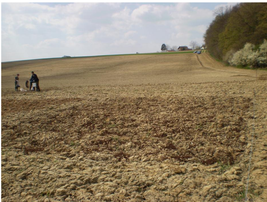
Slika 5. Gnojidba parcela

Utjecaj organske gnojidbe na prinos, kemijski sastav i hranidbenu vrijednost zrna kukuruza istraživani su tijekom 2010. godine na pokušalištu Visokoga gospodarskog učilišta u Križevcima. Postavljen je gnojidbeni pokus po slučajnom bloknom rasporedu u četiri ponavljanja. Za potrebe pokusa korišten je kompostirani stajski gnoj iz četiri različite proizvodnje: goveđi, konjski i pileći gnoj, te separat svinjske gnojovke. Gnoj je kompostiran na način da su formirane hrpe piramidalnog oblika 2 x 2 x 1 m, koje su po potrebi vlažene i povremeno ručno miješane radi prozračivanja. Proces kompostiranja trajao je 9 mjeseci, a tako dobivenim kompostom izvršena je gnojidba tla. Gnojidbene varijante bile su sljedeće: I – kontrola bez gnojidbe, II – mineralna gnojidba (200 kg/ha N, 150 kg/ha P 2 O 5 i 300 kg/ha K 2 O), III – 10 t/ha komposta od goveđeg gnoja, IV- 10 t/ha komposta od konjskog gnoja, V – 10 t/ha komposta od separata svinjske gnojovke, VI – 6 t/ha komposta od pilećeg gnoja. Veličina svake parcele iznosila je 70 m 2 (7x10 m).