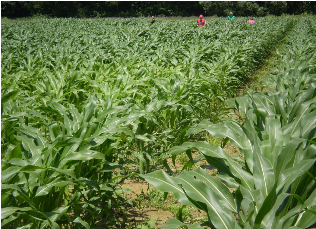
Slika 1. Kukuruz u pokusu

Za pretpostaviti je da će gnojidba kukuruza mineralnim gnojem rezultirati najvećim prinosom i najvećom metaboličkom i neto energijom.