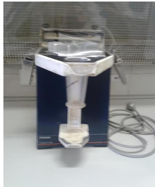
Slika 6. Mlin za krupno mljevenje uzoraka Slika 7. Mlin za sitno mljevenje uzoraka