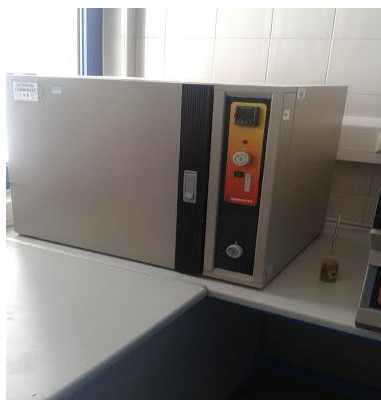
Slika 8. Sušionik

m_2 - masa uzorka prije sušenja u gramima