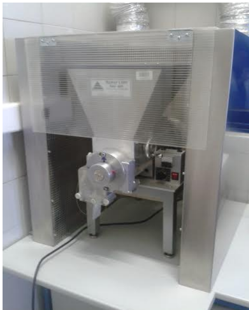
Slika 6. Mlin za krupno mljevenje uzoraka

Prije stavljanja u postupak uzorci se moraju pripremiti, odnosno usitniti na veličinu čestica od 1 mm i homogenizirati. U Odjelu za kontrolu kvalitete stočne hrane koriste se mlinovi prikazani na slikama 1. i 2. Tako pripremljeni stavljaju se u posude u kojima se čuvaju.