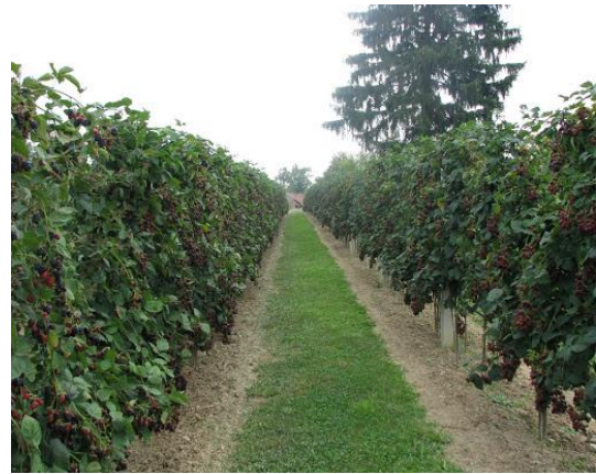
Slika 10. Integrirani kupinjak – Herman

Tijekom 2013. provedeno je jednogodišnje istraživanje na dva lokaliteta i na dvije sorte kupina uzgajane po principima integrirane i ekološke proizvodnje. U vegetacijskoj godine prikupljani su svi potrebni podatci o primjenjivanim agrotehničkim mjerama u uzgoju kupina. Berba je obavljena jednokratno, a za potrebe pokusa uzeti su iz svakog nasada prosječni uzorci od cca 1 kg zrelih plodova u tri ponavljanja. Uzorci su dostavljeni na analizu u agrokemijski laboratorij Visokog gospodarskog učilišta u Križevcima.