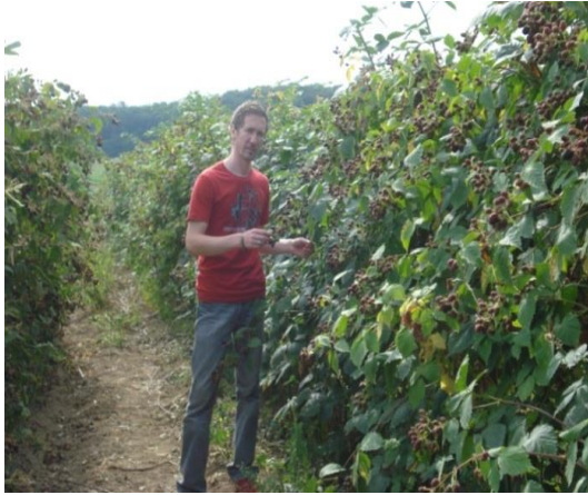
Slika 9. Ekološki kupinjak – Platužić