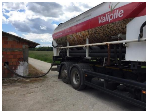
Slika 7. Prihvat smjese u silos