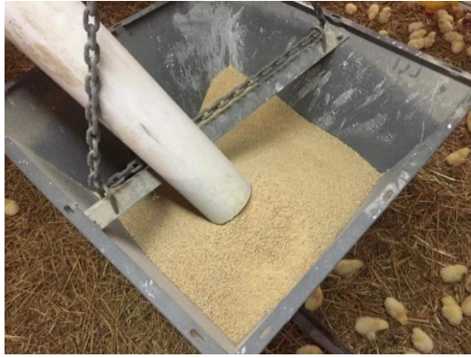
Slika 6. Smjesa u usipniku za hranu na farmi