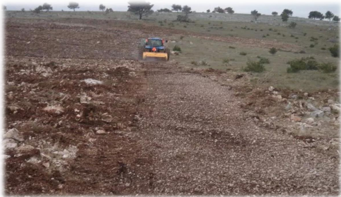
Slika 4: Prikaz rada uređaja za usitnjavanje kamena

Nakon završenih poslova sustavnog uređenja terena, pristupilo se poslovima popravka fizikalnih, kemijskih i bioloških svojstava tla, odnosno poslovima pripreme tla za sadnju vinograda. To je obuhvatilo dva osnovna zahvata: melioracijsku gnojidbu i rigolanje (duboko oranje), koji djeluju na popravljavanje plodnosti tla koje u ovom slučaju obavlja uređaj za usitnjavanje kamena (slika 4) i podrivač – riper (slika 6) pri pripremi terena za podizanje vinograda.