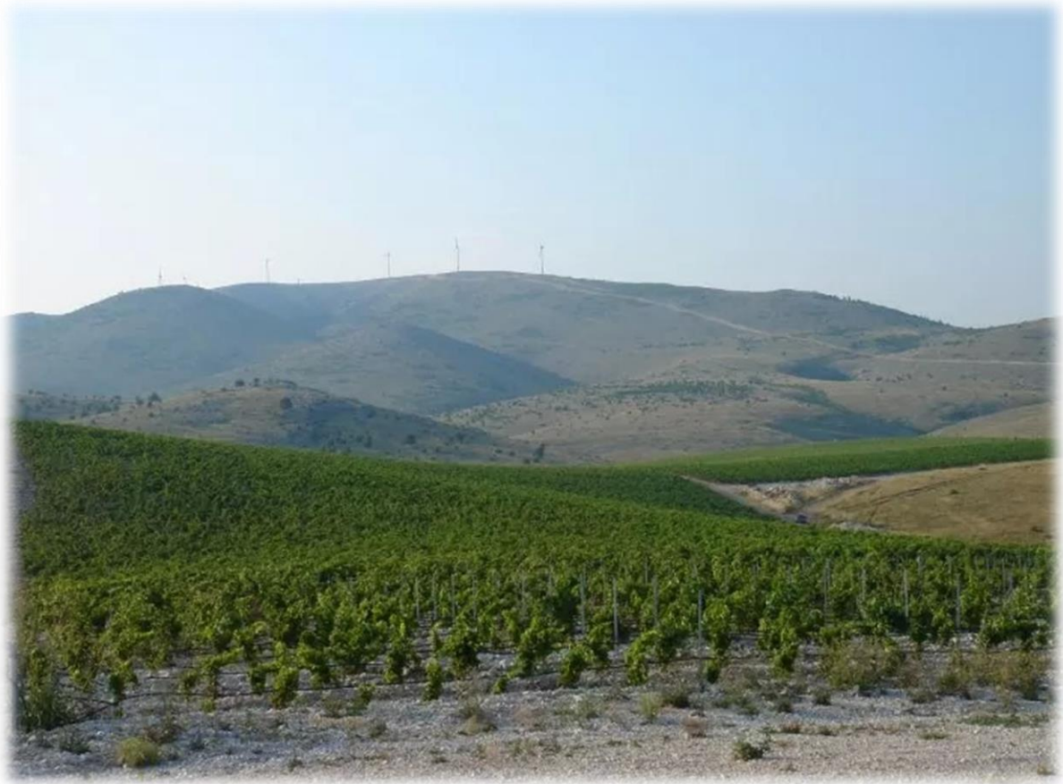
Slika 3: Položaji vinograda tvrtke Vinoline d.o.o.