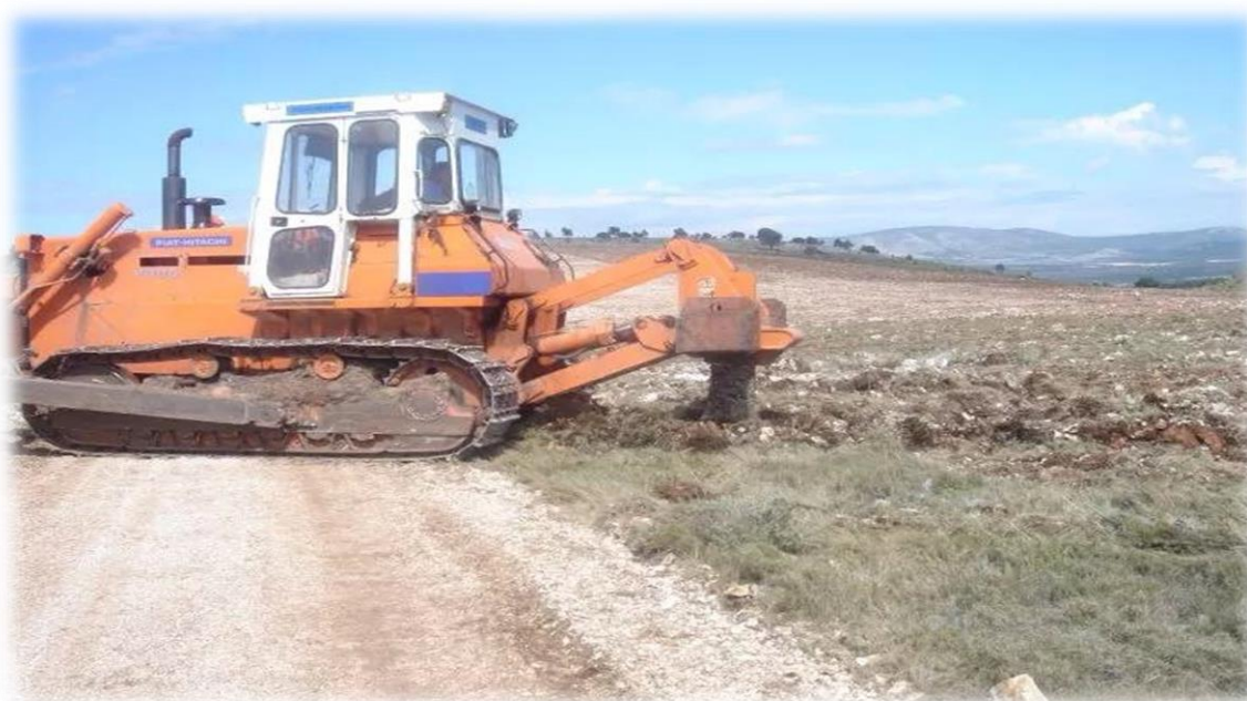
Slika 7: Rad podrivačem u pripremi sadnje vinograda tvrtke Vinoline

U tablici 2 može se vidjeti koliki su troškovi pripreme terena 1 ha vinograda. Naime, u tablici su prikazani troškovi mehanizacije koja je korištena u samoj pripremi terena, tj. broj potrebnih sati rada strojeva na terenu, te cijena jednog sata rada stroja, što je u konačnici dovelo do troška od 90.483 kn po 1 hektaru površine.