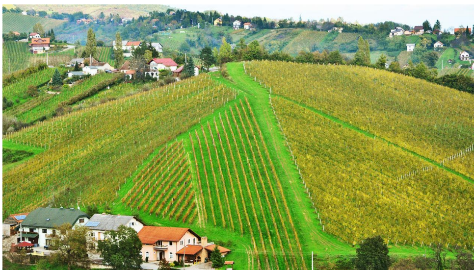
Slika 2. Primjer poljoprivredne površine u Zagrebačkoj županiji

Što se tiče voćarske kulture, najviše se uzgajaju jabuke (oko 80% voćarstva otpada na jabuke), a zastupljene su i kruške, šljive, marelice, breskve, trešnje, višnje, orasi i bobičasto voće ( www.invest-croatia-zg-county.com , 2019). Na slici 2 je prikazano poljoprivredno područje Zagrebačke županije.