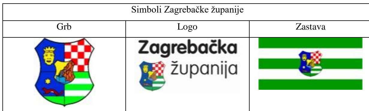
Tablica 1. Simboli Zagrebačke županije

Zagrebačka županija nalazi se u središnjem djelu sjeverozapadne Hrvatske. Sjedište županije nalazi se u Zagrebu. Površinom je šesta po redu, tj. po veličini županija u Hrvatskoj. Prema broju stanovnika, to je treća najveća županija u Hrvatskoj (nalazi se iza Grada Zagreba i Splitsko-dalmatinske županije) ( www.zagrebacka-zupanija.hr , 2019). U sljedećoj tablici nalaze se simboli Zagrebačke županije prema kojima ova županija ima svoju prepoznatljivu grafičku vizuru (Tablica 1).