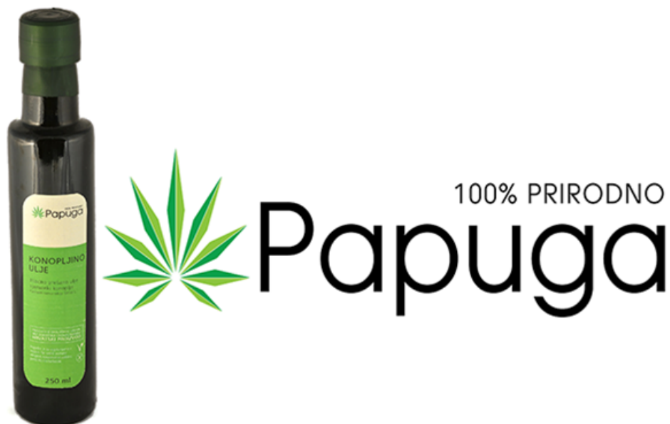
Slika 4. Pakovanje hladno prešanog ulja OPG Papuga i logo proizvoda

Proizvodi od industrijske konoplje na tržištu najčešće su proizvedeni od sjemena iz ekološkog uzgoja zbog jednostavne agrotehnike i njege biljaka tijekom vegetacije. Potrošači su sve više zainteresirani za proizvode konoplje zbog trenda kojim se naglašavaju vrlo pozitivne karakteristike i utjecaji konoplje na zdravlje ljudi. Upravo zbog tog pozitivnog trenda lakše se dolazi do zainteresiranih potrošača i različitih skupina potrošača. U ovom slučaju ciljane skupine potrošača predstavljaju sve skupine neovisno o životnoj dobi, financijskim mogućnostima, zdravstvenom stanju ili životnim navikama. Do novih potrošača OPG dolazi putem preporuka stalnih potrošača, reklamama i povremenim akcijskim prodajama kroz internetske trgovine, promidžbom na društvenim mrežama i izlaganjima proizvoda na sajmovima. Cijenom je ulje OPG-a Papuga dostupno zainteresiranim novim i stalnim potrošačima ulja konoplje. Plan OPG-a je proširenje uzgoja na dodatne poljoprivredne površine, proširenje proizvodnog asortimana uz zadržavanje najviše kvalitete. Cijenom od 60,00 kn za 250 ml hladno prešanog ulja iz ekološkog uzgoja OPG Papuga je konkurentan domaćim i uvoznim uljima iste kategorije. Ujedno je cijenom pristupačan potrošačima različitih kupovnih moći i kategorija. Pakovanje je zanimljivo, prepoznatljivo, zadovoljava ekološke standarde i naglašava zdrav i ekološki proizvod (slika 4.).