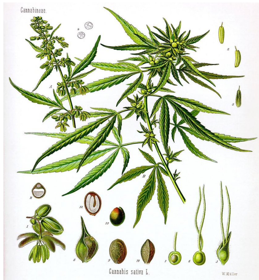
Slika 1. Industrijska konoplja ( Cannabis sativa L.)

Debljina stabljike ovisi o sklopu sjetve, a prosjek je između 3,5 do 8,4 mm. Za proizvodnju vlakna su poželjne visoke i tanke stabljike zbog većeg udjela vlakna. Stanice vlakna pretežno se sastoje od celuloze i djelomično od srodnih tvari kao što su hemiceluloza, pentozani, pektini i lignini. Razlikuju se primarna i sekundarna vlakna. Primarna su najdulja i najčvršća i stvaraju se u perikambiju, a sekundarna su kraća i manje čvrsta i nastaju blizu kambija. Na udio sekundarnih vlakana utječu spol (ženske imaju više) i agroekološki uvjeti proizvodnje (Augustinović, 2016). List je svjetlozelene do tamnozeleno boje, sastoji se od peteljke i plojke, na svakom nodiju nalaze se dva nasuprotna lista. List čini neparan broj nazubljenih liski (5, 7, 11 ili 13). Listovi ženskih biljaka su krupniji od muških (Augustinović, 2016).