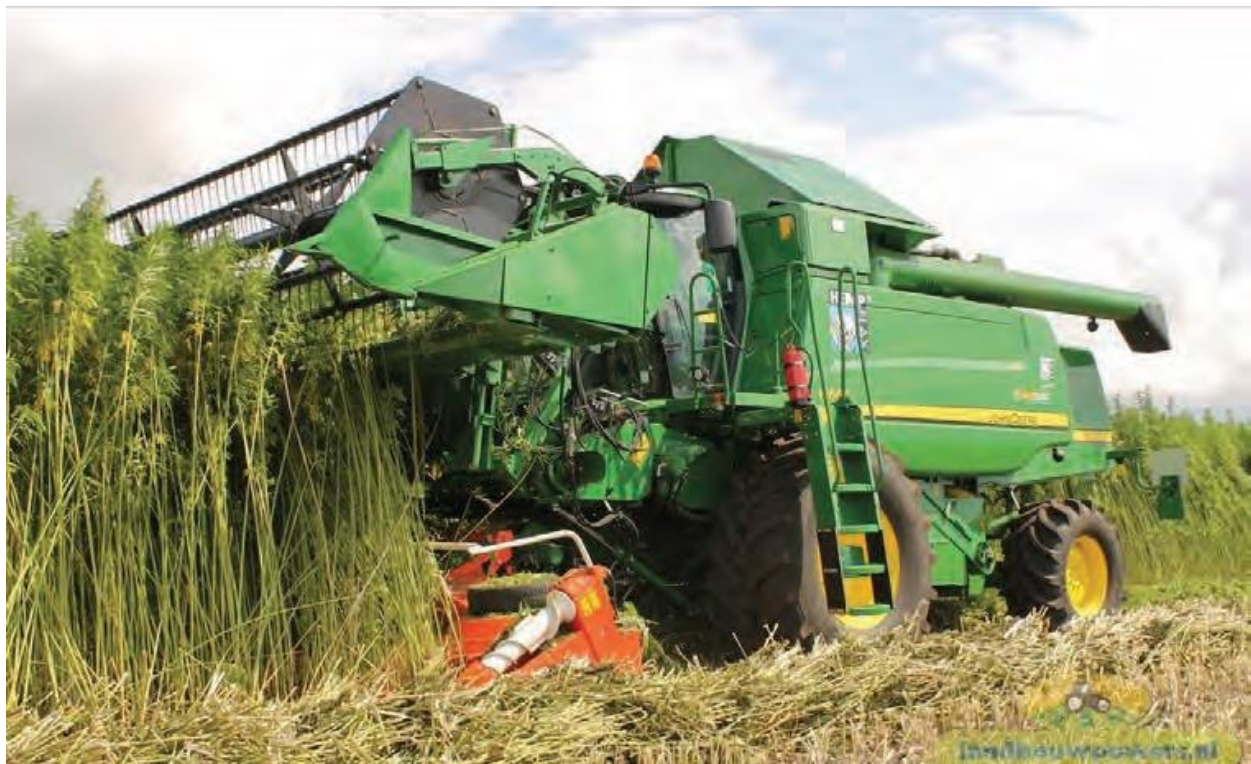
Slika 2. Double-Cut kombajn

Vrijeme žetve između sredine rujna i početka listopada, no teško je predvidjeti jer sjeme konoplje nejednolično dozrijeva. Dozrijevanje ovisi o klimatskim uvjetima i sorti. Žetva se vrši prilagođenim kombajnama, a većinom žitnim u fazi kada je zrelo oko 60-70% sjemena uz podešavanje i nižu brzinu kretanja kombajna (Tresk Penezić i sur., 2014). Zbog širenja uzgoja konoplje na tržištu je sve veća ponuda mehanizacije za žetvu konoplje, posebno sjemena zbog velikih gubitaka na urodu i troškovima dorade. Na slici 2. prikazan je novi koncept kombajna „Double-Cut Combine“ nizozemskog proizvođača koji reže samo vrhove stabljike koje izravno ulaze u utor glave rezača čime se gubitak sjemena minimaliziran (Gusovius i sur., 2016).