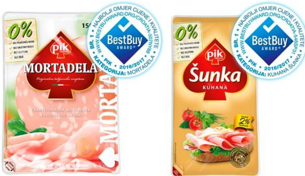
Slika 1. Pik Zlatna šunka i Pik Mortadela dobitnici nagrade Best Buy AWARD