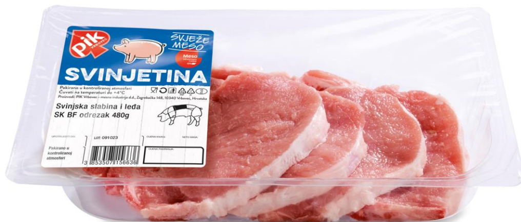
Slika 2. Pik svježe pakirano meso označeno markicom „Meso Hrvatskih farmi”