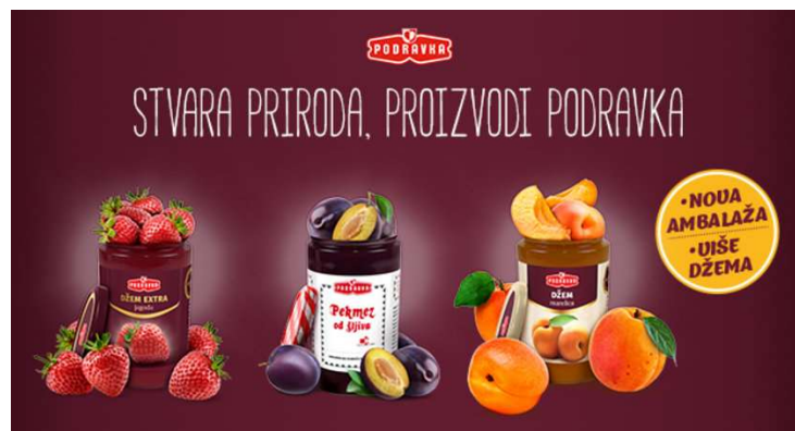
Slika 1. Voćni namazi Podravke

Za prehrambenu industriju novi proizvod je najmanja promjena na postojećem proizvodu zbog toga što zahtjeva odvojeno vođenje procesa, kao i kod potpuno novog proizvoda. Iako, koncenzus se postiže internim propisima u tvrtki koja definira što se smatra novim proizvodom. Primjerice, tvrtka Podravka ima status novog proizvoda tri godine, nakon čega se realizacija proizvoda prati u okviru postojećih proizvoda. Pod time se misli, da se proizvod ukida iz asortimana ukoliko u to vrijeme ne postigne definiranu minimalnu godišnju prodaju i ciljanu profitabilnost. Na nacionalnoj razini, novi proizvodi i inovacije potiču ekonomski rast, zatim povećavaju konkurentnost i izvozni potencijal gospodarstva, povećavaju zaposlenost stanovništva.