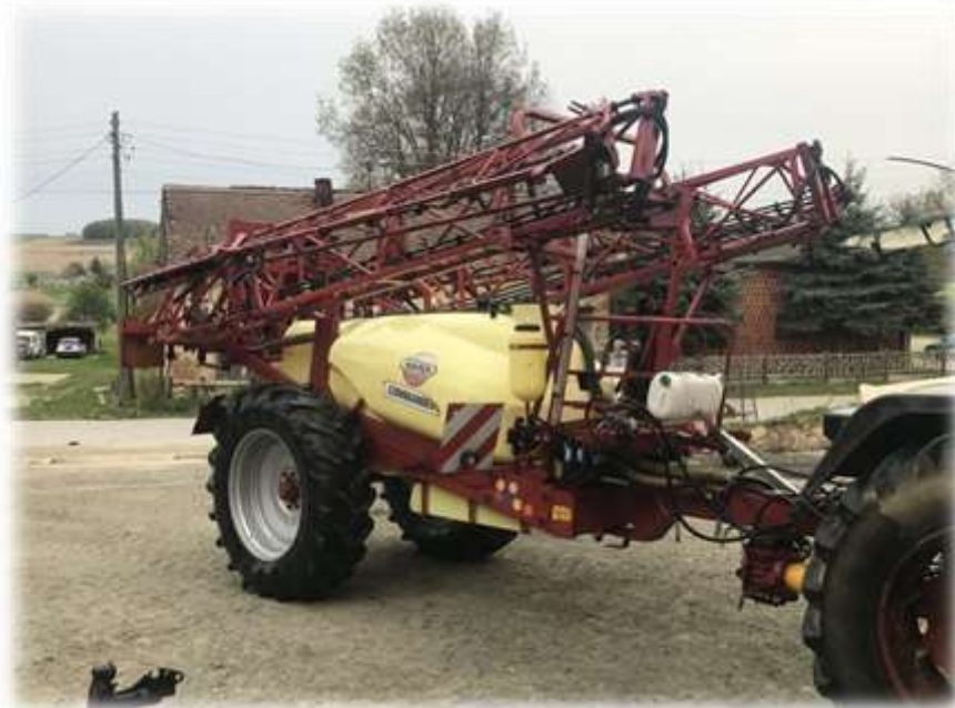
Slika 6. Prskalica Hardi commander u poljoprivrednom poduzeću Agro Land