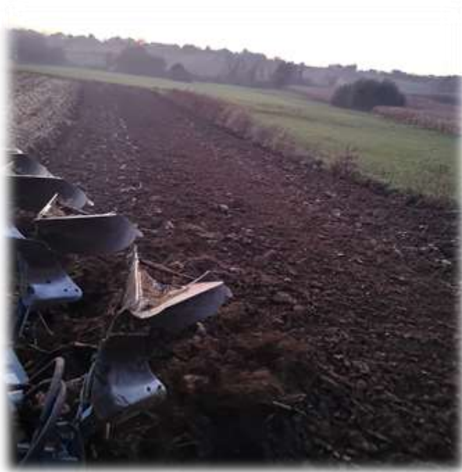
Slika 1. Oranje u poljoprivrednom poduzeću Agro Land

U sezoni oranja 4 zaposlenika su zadužena za obavljanje ove radne operacije u polju. Cijena oranja 1 ha iznosi 500 kn.