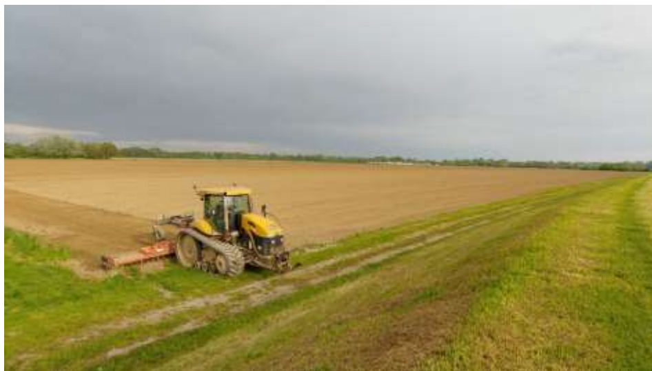
Slika 3. Roto drljanje u poljoprivrednom poduzeću Agro Land