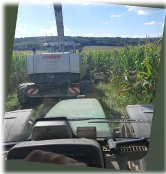
Slika 8. Siliranje u poljoprivrednom poduzeću Agro Land