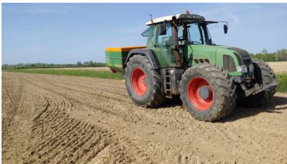
Slika 5 Predsjetvena gnojidba u poljoprivrednom poduzeću Agro Land

U 2018. godini poduzeće Agro Land obavilo je gnojidbu na 900 ha oranica, od čega je na 400 ha obavljena osnovna gnojidba, na 400 ha predsjetvenu gnojidba, a na 100 ha samo prihrana usjeva. Cijena usluge gnojidbe 1 ha iznosi 200 kn.