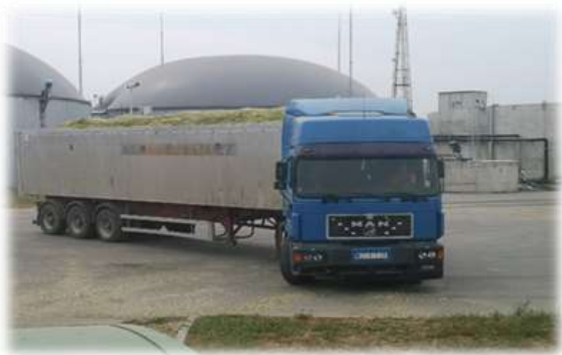
Slika 10. Transport kamionom u poljoprivrednom poduzeću Agro Land

Poljoprivredno poduzeće posjeduje vlastiti kamion za obavljanje transporta na duže relacije. Za transport sjemena s polja na ekonomsko dvorište drugoga gospodarstva koriste se traktori i prikolice. Cijena prijevoza traktorom iznosi 100 kn/ha, dok cijena prijevoza kamionom ovisi o udaljenosti mjesta istovara. Prosječna cijena koja se odnosi za razdoblje proučavano u radu iznosi 1000 kn.