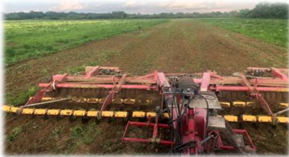
Slika 2. Tanjuranje u poljoprivrednom poduzeću Agro Land