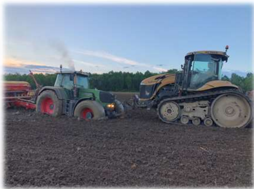
Slika 4. Sjetva u poljoprivrednom poduzeću Agro Land

U promatranom razdoblju za 2018. godinu upravo se navedenom sijačicom posijalo 900 ha oranica. Na oranicama u vlasništvu poduzeća Agro Land posijano je 50 ha, dok je uslužno posijano 850 ha oranica. Cijena sjetve 1 ha iznosi 350 kn.