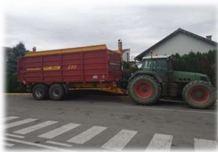
Slika 17. Traktorski prijevoz u poljoprivrednom poduzeću Agro Land

jedan prijevoz i jediničnu cijenu goriva dobije se cijena po jednom prijevozu što iznosi 164,36 kn. Ostvarena dobit u 2017. godini od prijevoza u iznosu od 358.936,00 kn je prikaz koliko usluge mogu pridonijeti iskoristivosti kapaciteta i uspješnosti poslovanja. U 2018. godini poljoprivredno poduzeće Agro Land je nastavilo s uslužnim prijevozom uroda ratarskih kultura. Uz prijevoz kamionom usluga prijevoza je vršena traktorima i traktorskim prikolicama prikazanim na slici 17.