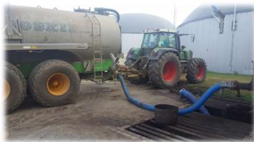
Slika 11. Prijevoz digestata u poljoprivrednom poduzeću Agro Land

Na obavljanju ovoga radnoga zadatka sudjeluju 2 radnika, s tim da im se u iznimnim situacijama priključuju još 2 radnika po potrebi. Cijena prijevoza digestata iznosi 12 kn/m 3 . Godišnje se preveze 200.000 kubika digestata.