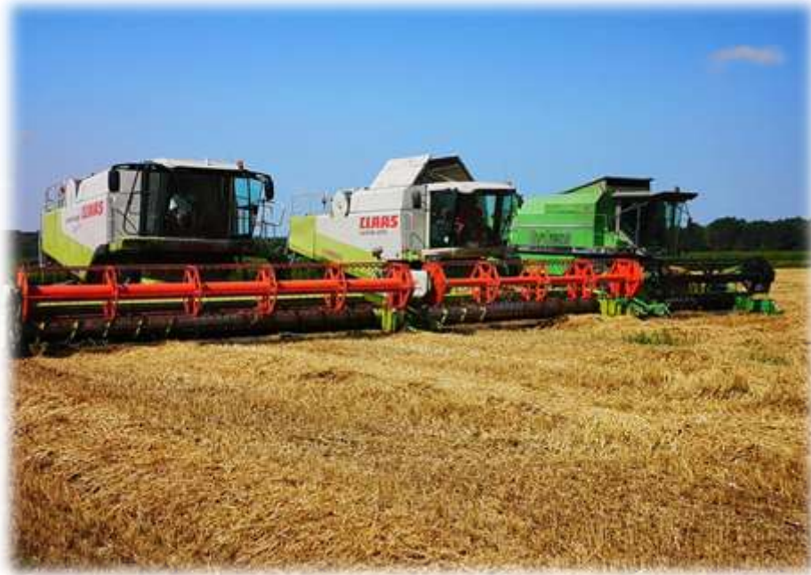
Slika 7. Kombajni Claas lexion 580 TT, Claas lexion 470 i Deutz fahr topliner 4090