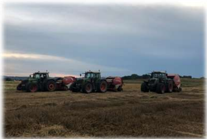
Slika 9. Baliranje slame u poljoprivrednom poduzeću Agro Land