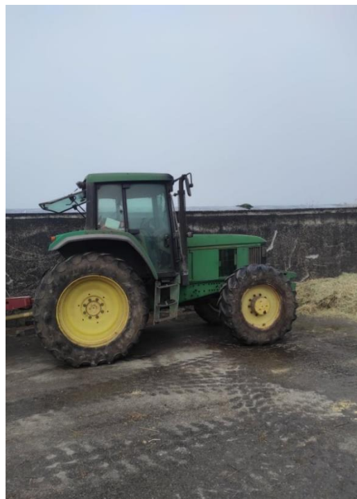
Slika 2. John Deere 6910