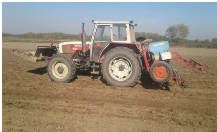
Slika 3. Sjetva ječma, 13.10.2016

Zaštita od korova provedena je u jesenskom periodu što je ekonomski najprihvatljivije. Herbicid Herbafleks je kontaktno – rezidualni herbicid koji svojim spektrom djelovanja pokriva sve korove te jednim prskanjem suzbija cijeli spektar jednogodišnjih travnih i širokolisnih korova. Amistar Extra dobro suzbija sivu i mrežastu pjegavost lista. Bio je primijenjen kada su bili dobri uvjeti za prskanje, što znači da nije bilo vjetera i prosječna temperatura je bila 10,3 °C. Ponovna primjena istog fungicida bila je nakon 3 tjedna, u dobrim vremenskim uvjetima i prosječnom temperaturom 12,2 °C.