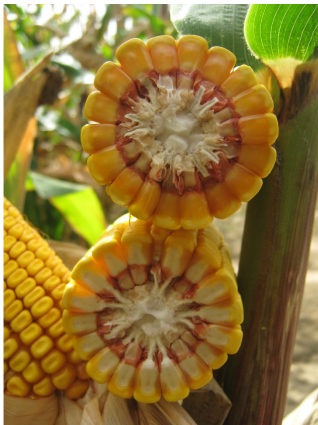
Slika 1. Klip hibrida „Drava 404“