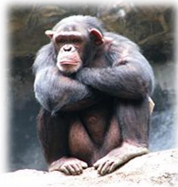
Slika 13. Čimpanza

Nastanjuju zapadnu i središnju Afriku. Nemaju rep, krzno im je crno ili tamno smeđe, lice im je bez dlake i njegova boja ovisi o starosti i podrijetlu, a može biti od svijetlo smeđe do crne boje. Prednji udovi su im dugi i kad su uspravni, dosežu im do ispod koljena. Poligamne su životinje. Nakon razdoblja graviditeta ženke čimpanze koje traje oko 230 dana, ženka rađa jedno mladunče, vrlo rijetko dva, koji teže gotovo dva kg. Mladunče siše majčino mlijeko do starosti od dvije do četiri godine, a spolnu zrelost doseže sa sedam godina. Ženke čimpanze u prirodi prvo mladunče imaju u dobi od 13 ili 14 godina, dok u zatočeništvu imaju ranije. Za mladunče se brine majka i ovisni su o majci do svoje starosne dobi od četiri do pet godina.