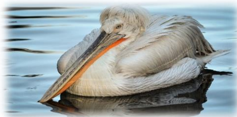
Slika 19. Kudravi nesit

Veličina tijela doseže od 160 do 180 cm. Tijelo je prekriveno srebrno-bijelim i sivim perjem. Donja strana kljuna i kresta, je narančasta, a gola koža oko očiju ružičasta. Tijekom godišnjih doba boja perja se mijenja, pa je ljeti najsajjnija, a zimi blijedo siva. Sezona razmnožavanja kudravog nesita razlikuje se od kolonije do kolonije. Par gradi gnijezdo od mnogih prirodnih materijala koje pričvrste i spajaju izmetom. Dva do četiri jaja par inkubira do 31 dan.