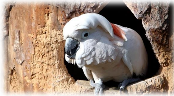
Slika 14. Molučki kakadu

Stanište su mu nizinske prašume ispod 1 000 m nadmorske visine. Duljina tijela mu doseže 50 cm, a masa 850 g. Boja tijela je bijela, ponekad ružičasta. Donji dio krila i rep je žute boje dok na glavi imaju prepoznatljivu perjanicu boje lososa. Kljun i noge su sive. Ženke Molučkog kakadua su nešto veće od mužjaka. Nema puno podataka o razmnožavanju ove vrste u prirodi. Gnijezde se u svibnju, srpnju i kolovozu, kad se ptice obično vide pojedinačno ili u parovima. Gnijezda grade na visokim stablima. Ženka položi jedno do tri jaja (obično dva), koja inkubiraju oba roditelja 28-29 dana.