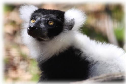
Slika 3. Čupavouhi lemur

Crno-bijeli, ružičasti lemur, Varecia variegata , endemičan je u istočnoj prašumi Madagaskara, smještenom u Indijskom oceanu. Tjelesna masa odraslih crnobijelih lemura kreće se od 2,5 do 4,8 kg. U prosjeku ženke su teže od mužjaka, posebno tijekom uzgoja. Ženke lemure imaju znatno duže repove nego mužjaci. Dužina mužjaka je između 436 mm i 565 mm (prosjek = 493 mm). Duljina ženki je između 469 mm i 570 mm (prosjek = 516 mm). Otprilike šest tjedana prije spolnog odnosa, veličina testisa mužjaka raste i oni postaju agresivniji jedni prema drugima. Ženke na početku estrusa otvaraju vagine, tako da može doći do parenja. Estrus (gonjenje) se javlja jedanput godišnje i traje tjedan dana.