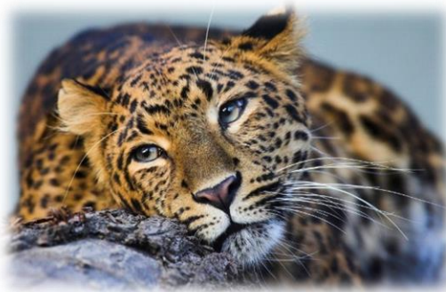
Slika 11. Kineski leopard

Mužjaci kineskog leoparda su veći od ženki. Postoje velike varijacije u veličini s obzirom na regije u kojima žive. Imaju kratke noge s obzirom na dužinu tijela. Boja krzna im varira od žućkaste (u toplim, suhim staništima) do crvenkasto-narančaste (u gustim šumama). Po tijelu imaju crne mrlje u obliku rozeta. Ženke kineskog leoparda su spremne za parenje u bilo koje doba godine. Graviditet ženke leoparda traje 96 dana nakon čega okoti jednog do šest mladunčadi, najčešće dva. Ženke koriste spilje, napuštene jame i brloge ili gušću vegetaciju za okot. Mladi kreću u lov s majkom nakon tri mjeseca i dok teže tri do četiri kg.