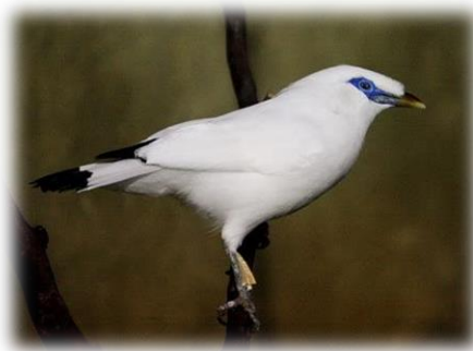
Slika 18. Balijski čvorak

Veličina tijela doseže do 25 cm, a masa tijela od 85 do 90 g. Veliki čvorci s bijelim perjem te crnim vršcima krila i repnih pera. Na glavi imaju duže perje koje podizanjem tvori krestu. Oko očiju imaju karakterističnu plavu kožu. Noge su sivo-plave. Mužjaci i ženke Balijskog čvorka vrlo su slični, samo što mužjaci imaju veću krestu. Monogamna je vrsta, par je usko vezan. Ženka snese dva do tri jaja, iz kojih se nakon 12 do 15 dana inkubacije izležu mladi čvorci. Najčešće samo jedan mladi ptić preživi do samostalnosti.