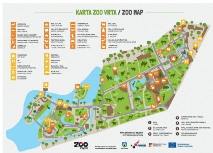
Slika 1. Karta ZOO vrta u Zagrebu

Svrha ovog rada je analizirati utjecaj Zoološkog vrta u Zagrebu na očuvanje ugroženih vrsta životinja te o daljnjim istraživanjima kroz edukativne programe obavijestiti širu društvenu javnost.