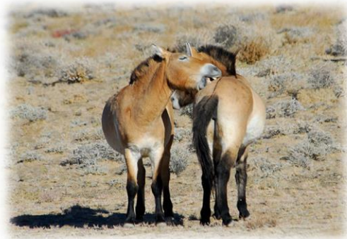
Slika 10. Konj divlji mongolski

Nalazi se u planinama Altai u Mongoliji. Ima kratke noge i kratki vrat, izgleda vrlo ponizno. Ukočena, uspravna crnkasta griva proteže se duž vrata niz leđa. Razdoblje graviditeta ženki mongolskog divljeg konja traje od 11 do 12 mjeseci, a jedno ždrijebljenje ima tijekom travnja ili svibnja. Sat vremena nakon ždrijebljenja, ždreb je u stanju stajati i hodati.