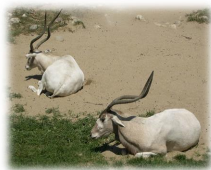
Slika 6. Adaks antilope

Trenutni raspon staništa smanjen je na pustinjske regije u sjeveroistočnom Nigeru, sjevernom dijelu središnjeg Čada, sjeverozapadnom Maliju, istočnoj Mauritaniji, južnoj Libiji i sjeverozapadnom Sudanu. Duljina rogovlja je 150-170 cm (Brehm, 2003), a duljina repa je 25-35 cm, dok su mužjaci nešto veći od ženki. Razmnožavaju se tijekom cijele godine, s porastom populacije u zimi i ranom proljeću. Graviditet adaks antilopa traje 257-264 dana.