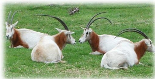
Slika 2. Sabljorogi oriks

Sabljorogi oriks je vrsta životinja koja je u prirodi izumrla zbog pretjeranog izlova i gubitka staništa. To je sisavac bijele dlake sa smeđim mrljama na vratu i prsima. Prosječna dužina tijela je 1,7 m. To je jedini oriks čiji su rogovi zakrivljeni prema natrag. Duljina rogova prosječno iznosi oko 1 m, ali zabilježene su duljine od 1 do 2 m ili više. Oba spola imaju rogove kao i drugi oriksi, s time da su ženkama rogov tanji. Graviditet ženki Sabljorogog oriksa traje između osam i osam i pol mjeseci, a teli jedno tele na godinu, prosječne mase 20 do 30 kg.