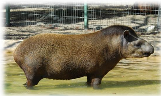
Slika 8. Južnoamerički nizinski tapir

Može se naći uglavnom u Brazilu, ali njegov rajon čini veći dio tropskih šuma Južne Amerike. Rasprostire se od sjeverne Argentine do Venezuele. Masa odraslih brazilskih tapira kreće se od 150 do 250 kg. Visina do grebena varira od 77 cm do 108 cm, dok duljina tijela može doseći 221 cm kod ženki i 204 cm u mužjaka. Sustav parenja tapira još nije utvrđen. Kad su ženke spremne za parenje, mužjaci se natječu za pravo na parenje.