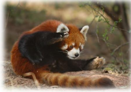
Slika 4. Crveni panda