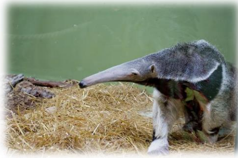
Slika 12. Divovski mravojed