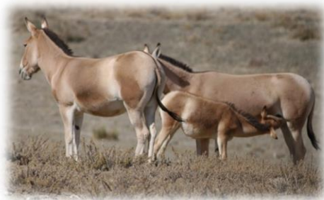
Slika 5. Kulani

Najveća populacija kulana (preko polovine ukupnog broja) nalazi se u južnoj Mongoliji. Boja varira ovisno o distribuciji i sezoni. Ljeti su crvenkasto smeđe boje, a zimi svijetlo do žućkasto smeđe. Ove magarce karakterizira gusta crna pruga s bijelim rubovima. Kulani su monogamni. Mladunci ostaju uz majku tijekom cijele godine.