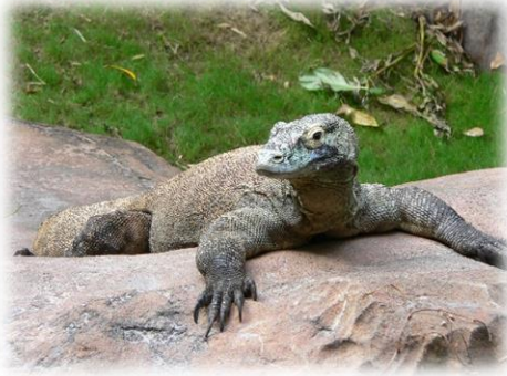
Slika 21. Komodski varan