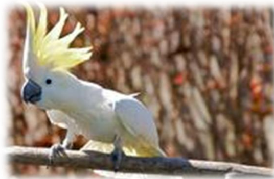
Slika 15. Žutokresti kakadu

Žutokresti kakadu endemična je vrsta u Indoneziji, Timoru, Sulawesiju i okolnom otočju te otočju Masealembu. Fragmentiran okoliš je okoliš podijeljen na manja, odvojena i nepovezana staništa gdje je najveći problem nedostatak hrane, nemogućnost parenja, kompeticije i još mnogo drugih posljedica fragmentacije.