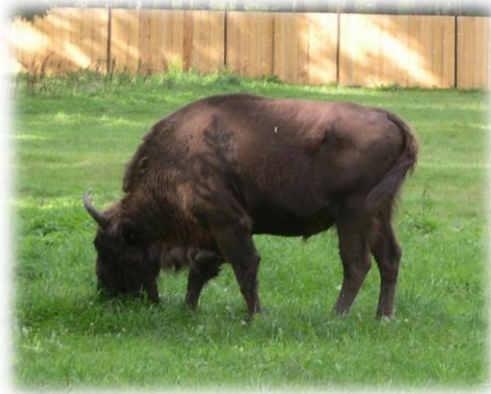
Slika 9. Europski bizoni

pridružuju se miješanom stadu s kravama. Manje skupine obično čine 10 do 12 jedinki, što obično uključuje samo jednog odraslog bika starijeg od šest godina (spolno zrelog) i jednog do tri bizona koji ne sudjeluju u reprodukciji.