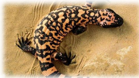
Slika 22. Otrovni bradavičar

Veličina tijela je u rasponu od 75 do 90 cm, a masa tijela od 1,4 do 4 kg. Imaju cilindrično tijelo s dugim debelim repom koji čini gotovo polovicu tjelesne dužine. Glava je šira i spljoštenija, a noge kratke, ali robusne. Trbušna strana tijela prekrivena je malim i mekim ljuskama, a ostatak tijela velikim i čvrstim. Crne su ili tamno smeđe boje sa žutim pjegama. Mužjaci otrovnog bradavičara su veći od ženki. Sezona razmnožavanja je u veljači i ožujku, a parenje traje 30 do 60 minuta. Nakon dva mjeseca ženka izleže i zakapa tri do trinaest jaja. Nakon šest mjeseci inkubacije iz jaja izlaze mladi bradavičari veličine i do 20 cm.