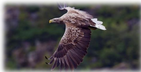
Slika 17. Bjelorepi štekavac

Najveća je ptica grabljivica Panonskih nizinskih prostora. Mužjak i ženka Bjelorepog štekavca žive u paru cijeli život, a povezanost učvršćuju čestim letovima i zajedničkim obrušavanjima. Duljina tijela iznosi 66-94 cm, s repom duljine 20-32 cm i rasponom krila 1,80-2,50 m. Ženke Bjelorepog štekavca su mase od četiri do sedam kg i malo su veće i krupnije od mužjaka čija je masa 3,1-5,4 kg. Rekordna masa od 7,5 kg. Sezona gniježđenja započinje krajem siječnja zauzimanjem teritorija i izgradnjom ili popravljanjem gnijezda.