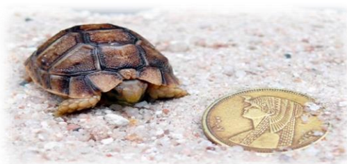
Slika 20. Egipatska čančara

Veličina tijela je 14,4 cm. Malena pustinjska kornjača prepoznatljiva po minijaturnom tijelu. Oklop može biti raznobojan, poput žute, smeđe, zelene ali i izgledom podsjećati na zlatnu. Međutim, boje su blijede kako bi je zaštitile od jakih sunčevih zraka i kamuflirale ih. Glava i udovi također su blijedi. Mužjaci egipatske čančare su manji i izduženiji od ženki, ali imaju veći rep. Partnerstvo i razmnožavanje u divljini zabilježeni su samo u ožujku, dok se u zatočeništvu razmnožava i u drugim mjesecima. Mužjaci se tijekom parenja vrlo glasno glasaju, što nije karakteristično ni za jednu drugu mediteranski kornjaču. Prije parenja mužjak lovi ženku i sudara se u nju. Ženka u pijesak izleže do 5 jaja.