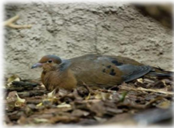
Slika 16. Sokorska gugutka

Sokorska gugutka nekadašnji je endem otoka Socorro što znači da je u prirodi nije bilo nigdje drugdje na svijetu. Njen način života vrlo je specifičan jer za razliku od drugih ptica gugutka većinom obitava na tlu, iako je sasvim dobar letač.