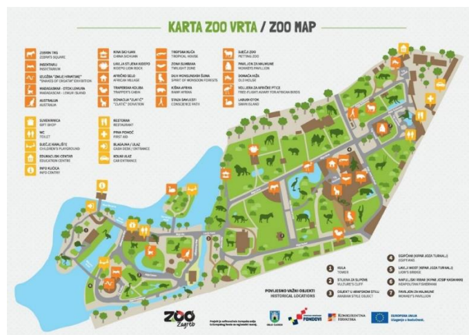
Slika 1. Karta ZOO vrta u Zagrebu

Svrha ovog rada je analizirati utjecaj Zoološkog vrta u Zagrebu na očuvanje ugroženih vrsta životinja te o daljnjim istraživanjima kroz edukativne programe obavijestiti širu društvenu javnost.