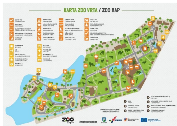
Slika 1. Karta ZOO vrta u Zagrebu

Svrha ovog rada je analizirati utjecaj Zoološkog vrta u Zagrebu na očuvanje ugroženih vrsta životinja te o daljnjim istraživanjima kroz edukativne programe obavijestiti širu društvenu javnost.