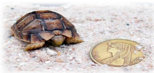
Slika 20. Egipatska čančara

Veličina tijela je 14,4 cm. Malena pustinjska kornjača prepoznatljiva po minijaturnom tijelu. Oklop može biti raznobojan, poput žute, smeđe, zelene ali i izgledom podsjećati na zlatnu. Međutim, boje su blijede kako bi je zaštitile od jakih sunčevih zraka i kamuflirale ih. Glava i udovi također su blijedi. Mužjaci egipatske čančare su manji i izduženiji od ženki, ali imaju veći rep. Partnerstvo i razmnožavanje u divljini zabilježeni su samo u ožujku, dok se u zatočeništvu razmnožava i u drugim mjesecima. Mužjaci se tijekom parenja vrlo glasno glasaju, što nije karakteristično ni za jednu drugu mediteranski kornjaču. Prije parenja mužjak lovi ženku i sudara se u nju. Ženka u pijesak izleže do 5 jaja.