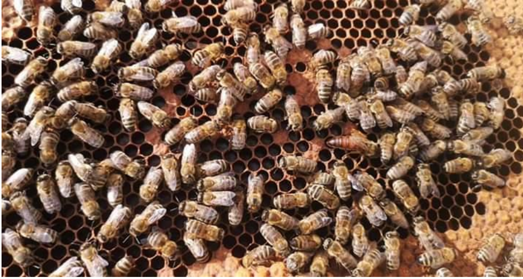
Slika 8. Leglo s pčelama

nedostaje. Na gornjem plodištu se otvori leto. Nakon 24 sata stavi se u gornje plodište zatvoreni matičnjak u nastavak, gdje mora biti otvoreno leto koje se nalazi između okvira s leglom. Matica kroz gornje leto može otići na oplodnju, a nakon oplodnje početi će nesti jaja u gornjem plodištu, dok za to vrijeme stara matica nese jaja u svom nastavku koji se nalazi na podnici košnice (Katalinić i sur., 1968).