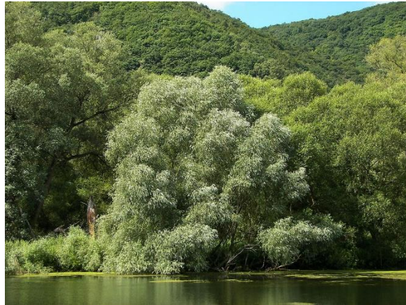
Slika 1. Bijela vrba ( Salix alba L. )