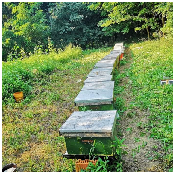
Slika 9. Pčelinjak na OPG-u Jaić

Pčelinjak OPG-a Jaić se nalazi u Vrbici pokraj Bjelovara. Košnice su stacionirane u blizini potoka te su okružene obiljem vegetacije. Zbog blizine potoka pored košnica nalazi se obilje vrbe, johe i lijeske koja predstavlja prvu pašu pčelinjim zajednicama na početku sezone. Također se u blizini i nalazi bagremova šuma koja pčelama predstavlja jednu od najboljih paša tijekom svibnja, kao i šuma kestena i lipe. S druge strane pčelinjaka nalazi se obradiva površina koju OPG koristi za sijanje facelije koja služi za pčelinju pašu u srpnju, također se malo dalje nalazi i livada sa zlatošipkom koju pčele iskorištavaju kao pašu.