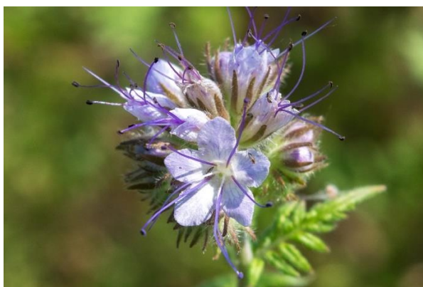
Slika 4. Cvijet Phacelia tanacetifolia Benth.