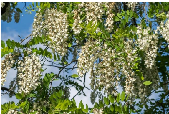
Slika 3. Cvatnja Robinia pseudoacacia L.

Bagrem cvate oko deset do petnaest dana. U Hrvatskoj bagrem počinje cvasti početkom svibnja i glavna je medonosna paša. Bagrem se smatra vrhunskom medonosnom biljkom, svrstavamo ga u šestu grupu (> 500 kg/ha) po količini izlučenog nektara. Pčele mogu imati dnevni prinos i do 15 kg meda, a ukupan prinos meda po košnici ide od 50 do 70 kg. Na 1 ha bagremove šume pčele mogu imati ukupan prinos meda i do 1 000 kg. Lučenje nektara je najbolje ukoliko ujutro ima rose i temperatura zraka iznosi 16°C, najpovoljnija dnevna temperatura iznosi 20°C do 25°C. Bagremov med je svijetao, staklasto proziran i bezbojan, slabog mirisa i ugodnog blagog okusa. Kako sadrži više voćnog nego groždanog šećera, vrlo dugo se nalazi u ne kristaliziranom stanju. Vrlo je kvalitetan med i pčele odlično prezimljuju na njemu (IP 6 ).