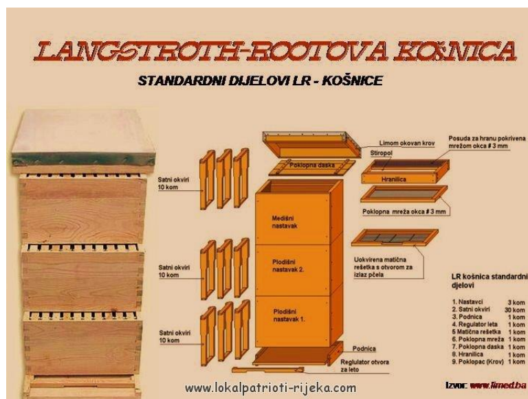
Slika 7. Langstroth – Roothova košnica