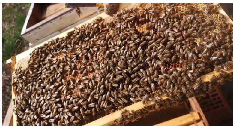
Slika 5. Pčele radilice na okviru

Pčele pripadaju jako velikim zajednicama koje mogu imati i do 80 000 jedinki i nekoliko stotina trutova te maticu. Za njihov opstanak je vrlo bitna ta zajednica. Ovise jedni o drugima i imaju uređenu hijerarhiju. Žive po principu jedan za sve i svi za jednog. Dijelovi pčelinje zajednice su pčele radilice, trutovi i matica.