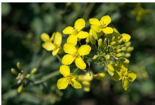
Slika 2. Cvijet Brassica napus L.

Prema kalendaru sjetve može biti ozima ili jara kultura. Ukoliko je ozima cvate u travnju dok jara cvate kasnije u lipnju. Dobra je medonosna biljka, nalazi se između četvrte (101 – 200 kg/ha) i pete grupe (201 – 500 kg/ha) po količini izlučenog nektara, i svrstavamo ju četvrtu grupu po količini proizvedene peludi (izvrсна). Ona omogućava da se pčelinje zajednice jako dobro razviju prije bagremove paše. Dnevni unos može biti do 5 kg, dok ukupan je oko 60 kg meda. Na 1 ha uljane repice pčele mogu skupiti do 200 kg meda. Med je slabije kvalitete, svijetlo žute boje i nakon vrcanja se brzo kristalizira što se događa zbog povećane količine grožđanog šećera umjesto voćnog.