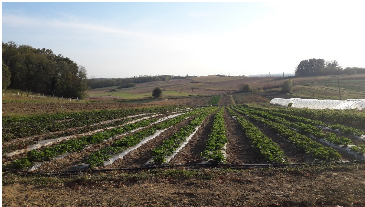
Slika 4. Imanje obitelji Iličić BIOMARA

uzgojenim povrćem. U početku su povrće uzgajali samo zbog sebe i vlastitih potreba, a kasnije su zbog potreba na tržištu počeli saditi veće količine ( slika 4. ). Trenutno uzgajaju oko 50 različitih vrsta povrtnih kultura godišnje. Imaju običaj svake godine uvesti po jednu ili dvije nove kulture u proizvodnju. To isključivo rade zbog želja kupaca i potražnje, ne radi vlastite znatiželje. Nisu nikada radili istraživanja o potražnji već su se uvijek vodili time da slušaju želje svojih kupaca. U kontakt s kupcima dolazili bi prisustvom na raznim sajmovima i oglašavanjem preko weba, prateći trendove po pitanju zdrave hrane. S obzirom da komuniciraju dosta i s drugim proizvođačima, često koriste i njihova iskustva u svemu. "Tako gospodin Željko kaže da se voli "igrati" sadnjom novih kultura te uvijek isprobavati nešto novo." ( Šok, 2018. ).