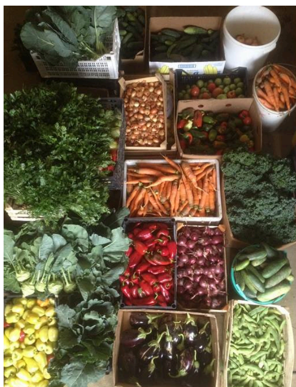
Slika 11. Pune košarice proizvoda za dostavu