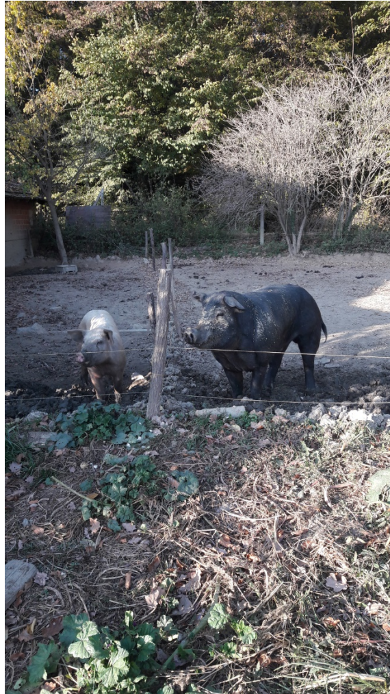
Slika 7. Uzgoj crnih slavonskih svinja na imanju BIOMARA

taj životinjski impuls. Ako imate životinje na imanju imate duhovni instinkt da imate neko drugo živo biće uza sebe na imanju i da brinete o njemu. Svinje uzgajamo za vlastitu upotrebu, jer se i mi hranimo njima." (Šok, 2018.).