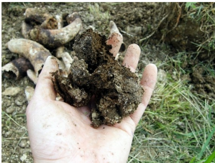
Slika 1. Gnoj iz roga na OPG Bolfan

zime, a vade se u proljeće. Kozmički i zemaljski utjecaji transformiraju ovo gnojivo u tamnu zemljastu masu. Rogovi će sadržavati gnojivo pretvoreno u rahli humus ugodna mirisa. To je tvar od kojeg se mala količina pomiješa s kišnicom, u malim dozama se prska tlo. Potiče rast korijena i stvara se humus. To je biodinamički aktivator. Preparat je potrebno sat vremena miješati u vodi, prije nego se rasprši po tlu da se oslobode eterične i astralne snage sačuvane u kravljem rogu. Snaga je beskorisna za biljke sve dok se ne oslobodi takvim dinamiziranim miješanjem. Miješanje se obavlja naizmjenično, u jednu i u drugu stranu uz pravljenje dubokih vrtloga u vodi, u neprekidnom trajanju od jednog sata spiralnim miješanjem, ritmičkim kretanjem sunca. Miješa se u glinenoj ili drvenoj posudi, drvenim štapom. Osnažuje tlo, potiče i hrani korijen. Funkcija preparata je da se aktiviraju korijenove dlačice, probudi razvoj bakterija i oslobode mikro elementi. Koristi se kravlja balega jer je bogata astralnošću, a kravu kao životinju karakterizira postojanost, spokojnost, vedrina i sklad. Također se smatra da je kravlji probavni sustav najsavršeniji na zemlji, pa se zbog toga koristi kravlji rog i njezina balega. Preparat se pohranjuje na hladnom i suhom mjestu. Za jedno jutro zemlje potrebno 35 grama preparata otopljeno u petnaest litara vode, koja mora biti mlaka, najbolje kišnica. Prska se pomoću prskalica ili se mogu koristiti metle ili četke za krečenje. Primjenjuje se direktno na tlo.