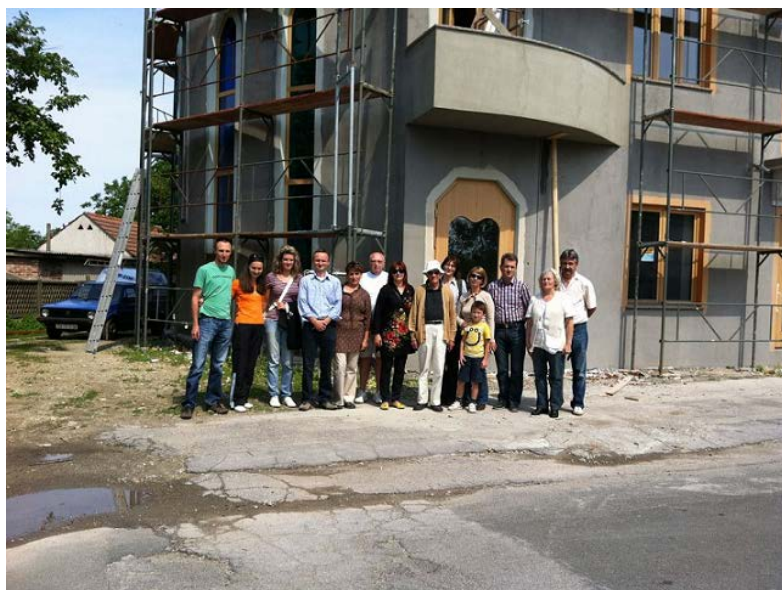
Slika 2. Renoviranje centra Rudolf Steiner