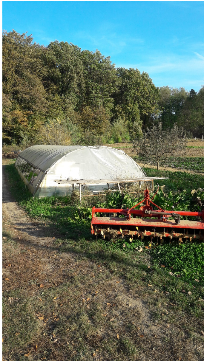
Slika 5. Priključak za kopačicu

kutem vrše tanjuranje gredica zvjezdastim tanjuračama ( slika 5. ). Osim ovih, koriste i klasične priključke od kojih im je najvažniji priključak podrivač jer zemlju ne oru, nego podrivaju. Biodinamičari koje su posjećivali, savjetovali su im da je zemlju bolje obrađivati podrivačem, nego plugom.