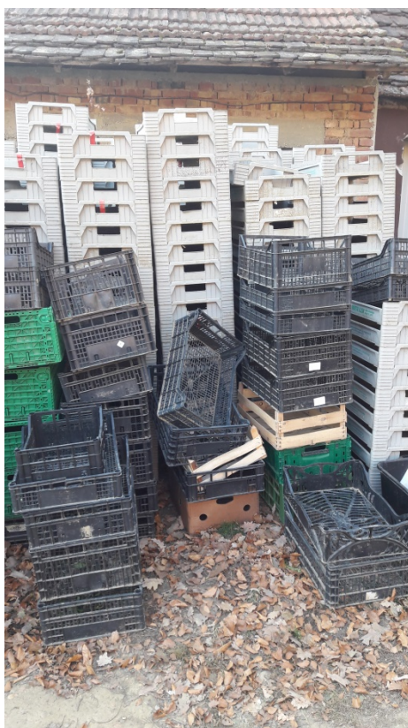
Slika 10. Slika košarica za pakiranje proizvoda

Proizvodi se pakiraju u košarice ( slika 10. ). Ono što kupac naruči, bere se taj dan dopodne tako da bude u potpunosti svježe. Zapakirana košarica ide na dostavu u kombi s kojim prevozi robi kupcu. Nemaju vlastitu pakiraonu kao što je to slučaj s većim centrima, već proizvode pakiraju sami. Gospodin Željko kaže da im je želja imati ekološke košarice za pakiranje, a ne one plastične. Ako kupuju ekološki proizvod u ekološkoj košarici ljudi bi razvili svijet o tome koliko je plastika štetna.