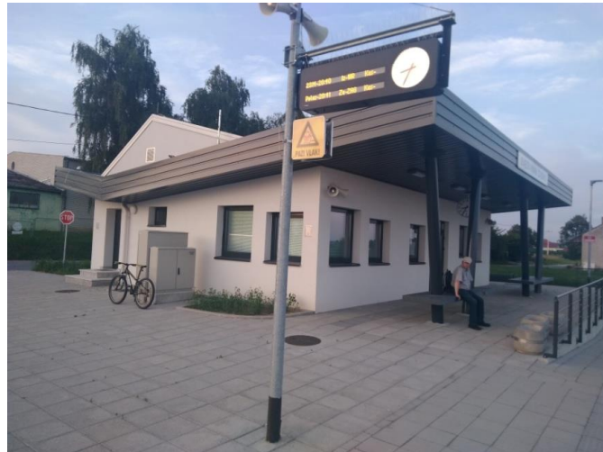
Slika 10 . Nova željeznička stanica u Sveti Ivan Žabno