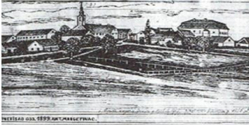
Slika 2. Sveti Ivan Žabno 1894. godine

Krstitelja. 30.srpnja 1954. Izvršno vijeće Sabora Hrvatske ukinulo je naziv Sveti Ivan. Skupština općine Križevci 21. lipnja 1990. ponovno je vratila mjestu puno ime Sveti Ivan Žabno. Općina Sveti Ivan Žabno je sve do 1993. godine bila u sklopu bivše općine Križevci, te se navedene godine osamostalila, ali nažalost općina nema svoju službenu zastavu ni službeni grb kao ostale općine. Svoj dan koji je ujedno i dan župe Svetog Ivana Krstitelja slavi 24. lipnja svake godine 9 .