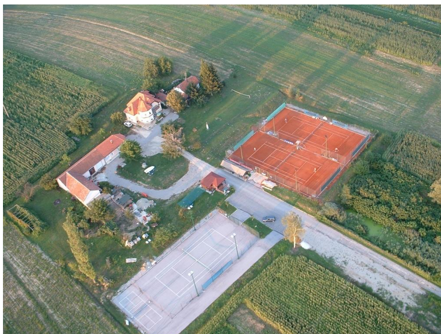
Slika 12. Sportsko-rekreacijski centar Cili

Idealnu destinaciju za aktivni odmor predstavlja Sportsko-rekreacijski centar Cili (Slika 12.) koji djeluje od 2000. godine. U želji promoviranja sporta i turizma na području općine aktivno djeluje Tenis klub Žabno sa mogućnošću korištenja dva zemljana terena koji su okruženi drvećem te pružaju gotovo cjelodnevni hlad i asfaltnim terenom na kojem je izuzev tenisa moguća i organizacija nogometa, košarke i drugih sportskih aktivnosti. Svi tereni imaju noćnu rasvjetu što pruža poseban ugođaj igre. Za dodatnu zabavu i rekreaciju obiteljskog karaktera postoji i malo dječje igralište te viseća kuglana. Uz igrališta postoji natkriven objekt sa terasom za posjetioce i igrače. Moguće je iznajmiti svu potrebnu opremu (rekete, lopte, tenisice, samopucajući top-izbacivač loptica ... ), individualno ili skupno organiziranje škole tenisa. Također, može se iznajmiti cjelokupni sportsko - rekreacijski centar u svrhu proslava rođendana, obljetnica, domjenaka i sl. zbivanja, uz korištenja plinskog roštilja po želji. Sportsko – rekreacijska ponuda upotpunjena je turističkim smještajem u zasebnom trosobnom apartmanu „Mir“ kategoriziranom s tri zvjezdice. Uz apartman postoji parkiralište, terasa i ograđen prostor za kućne ljubimce. U blizini nalazi se šuma, lovište, lovačka kuća, te poljski putevi za bicikliranje i šetnju 21 .