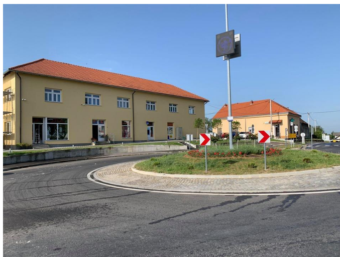
Slika 8. Izgrađeni kružni tok