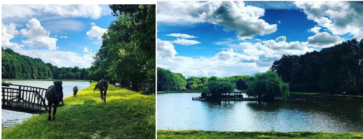
Slika 11. Obiteljsko izletišta „Novak“

Općina Sveti Ivan Žabno kroz svoju tradiciju i očuvanje kulturnih običaja svakako je jedan od potencijalnih centara razvoja ruralnog turizma u ovom području. Očuvanjem tradicionalnih događanja te uvođenjem novih trendova ruralnog turizma broj zainteresiranih se svake godine povećava. Općina je bogata prirodnim ljepotama te pruža velike mogućnosti za lov, ribolov, biciklizam, a također je bogata raznim tradicionalnim manifestacijama na kojima se zasniva razvoj ruralnog turizma i povećanje broja hrvatskih i stranih turista (Šramek, 2009). Turističku ponudu Općine Sveti Ivan Žabno čine: izletišta Novak Cepidlaki i Sportsko-rekreacijski centar Cili. U naselju Cepidlak koji je u blizini mjesta Sveti Ivan Žabno, smješteno je Obiteljsko izletišta „Novak“ (Slika 11.). Od Zagreba je udaljeno samo 40 km pa je to ujedno mjesto idealno za jednodnevne izlete u prirodi. Na imanju se nalazi restoran koji raspolaže sa 400 sjedećih mjesta i bogatom gastronomskom ponudom. U sklopu imanja „Novak“ nalazi se dječje igralište s ljuljačkama, klackalicama, pješčanikom i ostalim sadržajima koji vesele najmlađe te mali zološki vrt s konjima i ostalim prekrasnim životinjama. U parku ispred restorana nalaze se preko 200 godina stari predmeti kojim su se ljudi nekada služili u svakodnevnom životu 20 .