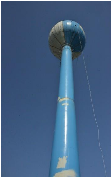
Slika 7. Vodotoranj u Svetome Ivanu Žabnu

regionalnog i ruralnog razvoja Republike Hrvatske u vrijednosti od 3.000.000,00 kuna. Načelnik općine rekao je da je... “ ovo najbitniji dio za to područje zbog opskrbe vodom. “