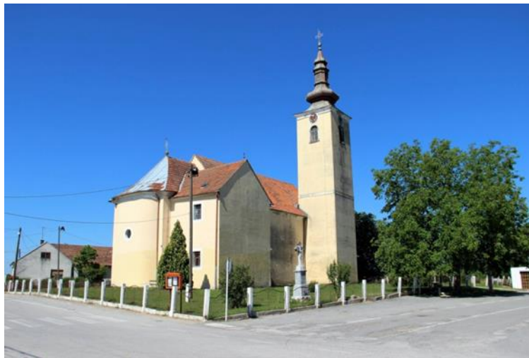
Slika 3. Crkva Pohođenja Marijina u Cirkveni

Kulturno-povijesnu baštinu općine Sveti Ivan Žabno čine najvrjedniji spomenici sakralne arhitekture, koji su zakonom zaštićeni spomenici kulture a to župna crkva Svetog Ivana Krstitelja u Svetom Ivanu Žabnu te crkva Sv. Julijane u Tremi jedna je od rijetkih ranobaroknih sakralnih građevina iz 16. i 17. st. koja je očuvala svoj prvotni izgled, kao župna crkva spominje se od 1667. g. do 1879. g. Župna crkva Sv. Petra u Svetom Petru Čvrstecu prvi puta se spominje kao župna crkva 1334.g no od nje su ostali samo poneki ostaci (zvonik- kula ispred pročelja). Crkva Pohođenja Marijina u Cirkveni (Slika 3.) nalazi se u središtu naselja, prvi puta se spominje već 1306.g. (Šramek, 1995).