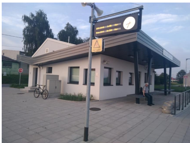
Slika 10 . Nova željeznička stanica u Sveti Ivan Žabno