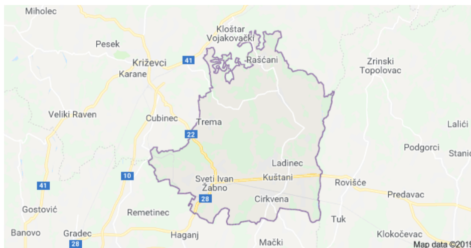
Slika 1. Karta općine Sveti Ivan Žabno

106,60 km 2 (10.660 ha), odnosno 6,10% ukupne površine Županije (koja iznosi 1.746,80 km 2 ) (Šramek, 1995).