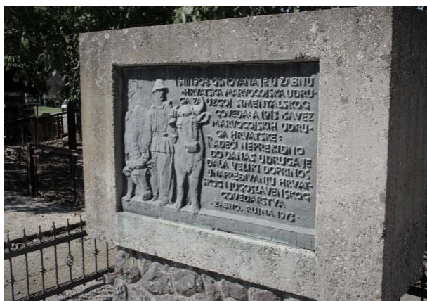
Slika 4. Sjećanje na osnivanje prva hrvatske stočarske udruge