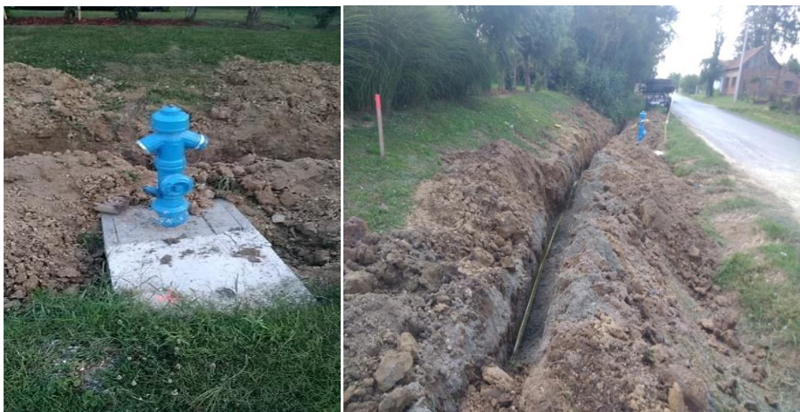
Slika 6. Gradnja vodovoda u Ulici Republici

Snabdijevanje vodom prostora općine Sveti Ivan Žabno vrši se putem „Grupnog vodovoda Križevci“. Snabdijevanje južnog dijela općine Sveti Ivan Žabno ostvareno je vezom na vodospremu „Bukovje“ koja je ostvarena izgradnjom cjevovoda Križevci – Poljana Križevačka - Brezovljani – Sveti Ivan Žabno u Trgu Karla Lukaša te u Ulici Republici (Slika 6.) sve do naselje Cirkvene pa i dalje cjevovodom prema Bjelovaru sve do naselja Markovac Križevački.