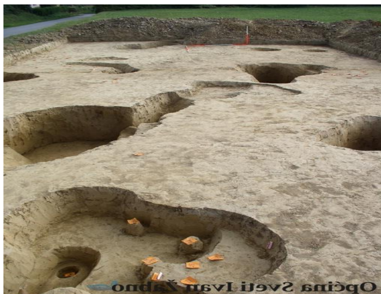
Slika 5. Nalazište u Brezovljanjima

U općini Sveti Ivan Žabno, u selu Brezovljani, nalazi se najpoznatije arheološko nalazište i zakonom zaštićeni spomenici kulture. Prilikom radova na proširenju ceste 1971. god. u Prvim Brezovljanima odnosno Mihajlicima 10 slučajno su otkriveni razni keramički i litički materijali, a među nalazima se posebno izdvajaju ulomci keramike ukrašeni crvenim i oker slikanjem te mala keramička stilizirana figurica žene koja je predstavljala Veliku Božicu Majku (Šramek, 1995).