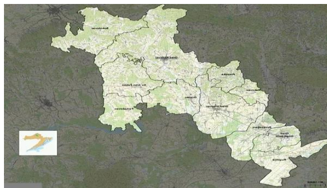
Slika 16. Karta LAG-a Prigorje

LAG „Prigorje“ (Slika 16.) je neprofitna organizacija, osnovana 6. lipnja 2012. u cilju unaprjeđenja kvalitete života ruralnog područja Zagrebačke županije, povezivanjem lokalnih sudionika iz civilnog, javnog i gospodarskog sektora. Rad LAG-a temelji se na LEADER 28 pristupu „Veze između akcija u ruralnom razvoju“ 29 . Nakon inicijalnog sastanka o osnivanju LAG-a koji je održan u Križevcima 19. rujna 2011. godine gradovi Križevci, Sveti Ivan Zelina i Vrbovec te općine Farkaševac, Gradec, Rakovec, Sveti Ivan Žabno i Sokolovac koncem 2011. godine donose odluke o osnivanju LAG-a Prigorje. Osnivačka skupština LAG-a održana 11. siječnja 2012. , a tijekom osnivačke skupštine donesen je statut. LAG područje obuhvaća gradove Križevce, Sv. Ivan Zelina, i Vrbovec te općine Frakaševac, Rakovec, Gradec, Sokolovac, i Sv. Ivan Žabno. Tijekom osnivačke skupštine drugog saziva LAG-A održana je u Križevcima, 29. travnja 2015. godine. Tijekom skupštine iz LAG-a isključen grad Sveti Ivan Zelina, a LAG-u pristupili grad Dugo Selo, općina Brckovljani, a kasnije 12. siječnja 2016. općina Rugvica. Novo sjedište LAG-a preseljeno je u Križevačku 4 u Vrbovcu (Slika 17.).