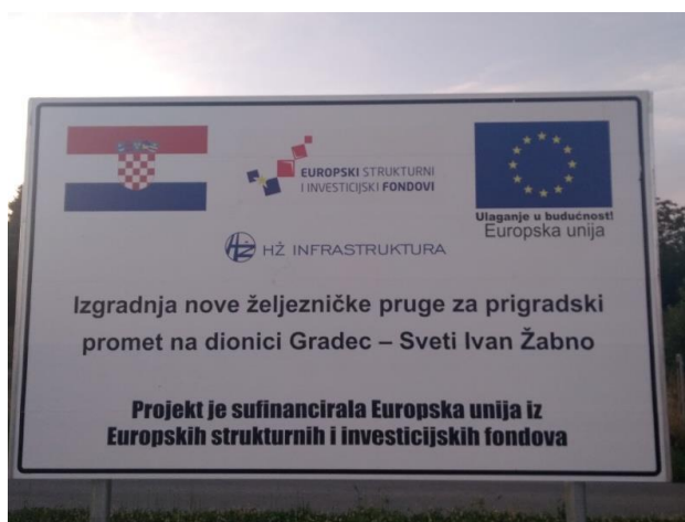
Slika 9. Tabla koja ukazuje da je projekt izgradnje željezničke pruge sufinancirala EU

Općina Sveti Ivan Žabno na početku je imala lošu željezničku povezanost koja se temeljila na željezničkoj pruzi Bjelovar – Križevci. Željezničkih stanica ima u naseljima Hrsovo, Cirkvena, Sveti Ivan Žabno, Škrinjari i Brezovljani. No, nakon odluke Ministarstva mora, prometa i infrastrukture pokrenuta je gradnja željezničke pruge Sveti Ivan Žabno-Gradec, koje je sufinancirano iz sredstava EU fondova (Slika 9.). Tijekom gradnje željezničke pruge u Svetome Ivanu Žabnu srušena je stara i izgrađena je nova željeznička stanica (Slika 10.), dok je u Škrinjarima željeznička stanica obnovljena. Nakon završetka izgradnje željezničke pruge, Općina će nakon dugog vremena napokon biti željeznički povezana s gradom Zagrebom, čime će se olakšati putovanje prema gradu Zagrebu.