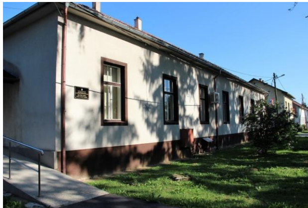
Slika 14 . Općinska zgrada

Prema riječima načelnika, „ općina ima Općinsko vijeće s 15 vijećnika kojim predsjedava predsjednik Općinskog vijeća“. Općinsko vijeće predstavničko je tijelo građana i tijelo lokalne samouprave koje donosi akte u okviru djelokruga općine te obavlja i druge poslove u skladu sa zakonom i statutom. Prema Statutu, Općinsko vijeće osniva stalne ili povremene odbore i druga radna tijela u svrhu pripreme odluka i sastanci se vrše u općinskoj zgradi (Slika 14).