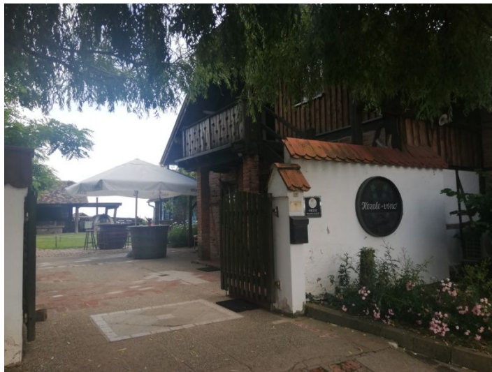
Slika 1. Ulaz u dvorište seoskog turizma Kezele