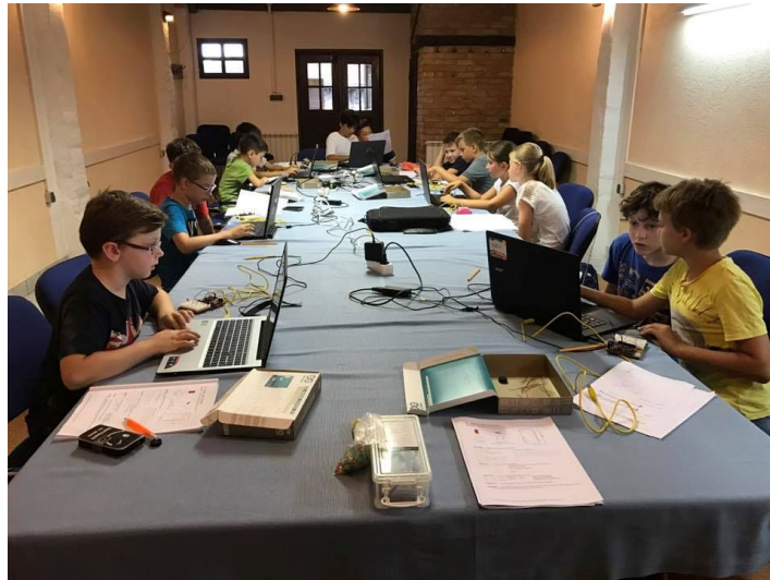
Slika 11. Ljetni kamp robotike na seoskom turizmu Kezele