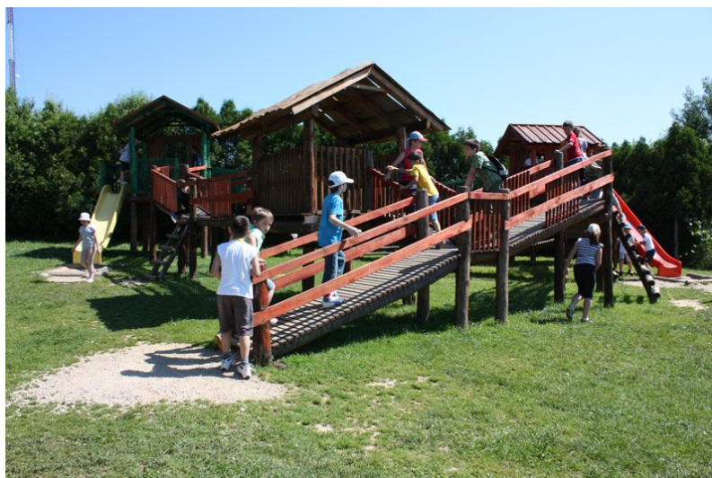
Slika 12. Dječje igralište

Za obitelji koje posjećuju imanje, seoski turizam Kezele u svojoj ponudi ima mnogobrojne dopunske aktivnosti koje čine posjet imanju zanimljivijim i odraslima i djeci. Na imanju se nalaze rekreacijski tereni na kojima gosti mogu uživati i rekreirati se. Tereni koji se nalaze na imanju su za mali nogomet, odbojku, košarku, badminton, te viseća kuglana. Za najmlađe na imanju se nalazi i dječje igralište (slika 12.) puno različitih mostića, kućica, ljuljački i penjalica.