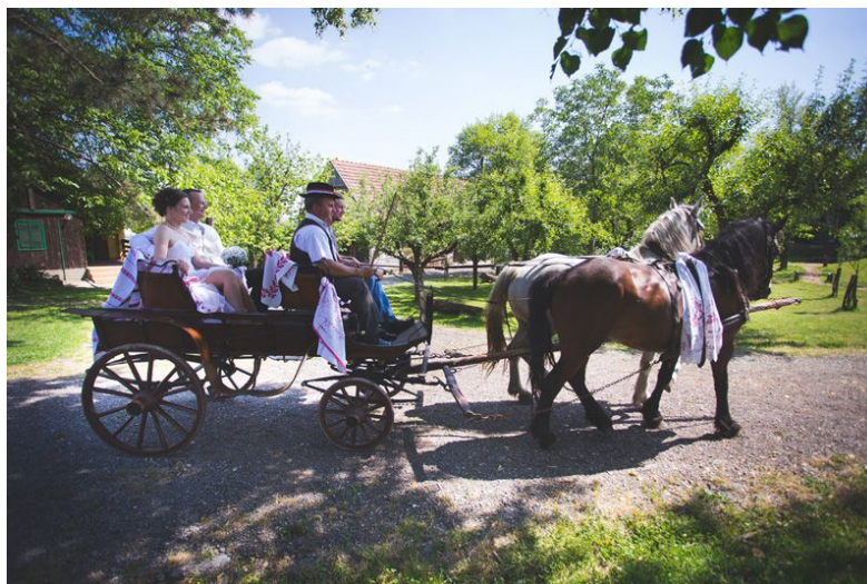
Slika 9. Vožnja mladenaca fijakerom