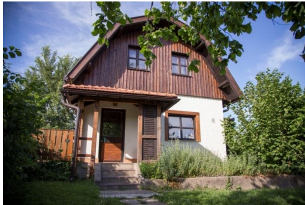
Slika 6. Kuća za odmor