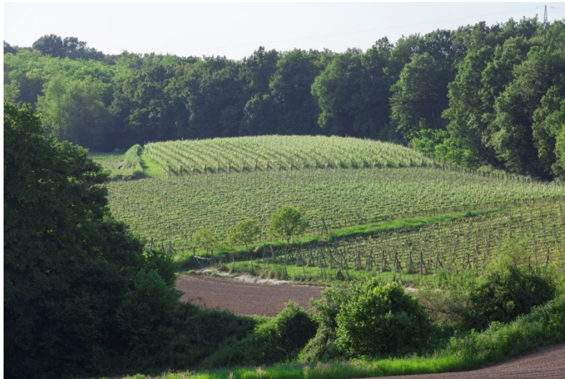
Slika 18. Vinograd obitelji Kezele