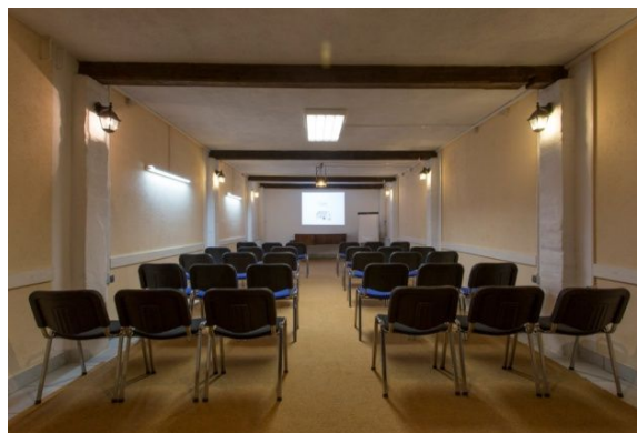
Slika 15. Poslovna dvorana

Seoski turizam Kezele nudi organizaciju jednodnevnih ili višednevnih poslovnih sastanaka, seminara ili radionice. Raspolazu sa tri poslovne dvorane (slika 15.) kapaciteta 72, 50 i 20 sjedećih mjesta koje su potpuno opremljene za potrebe poslovnih sastanaka. Osim toga, za poslovne grupe u ponudi imaju organizaciju ručkova, večera, prezentacija i treninga. Ukoliko se radi o višednevnom poslovnom posjetu, gosti imaju mogućnost noćenja na imanju. Nakon napornog radnog dana, gostima nude opuštanje šetnjom kroz šumu, rekreaciju na njihovim sportskim terenima, degustaciju vina ili nastup glazbenog sastava.