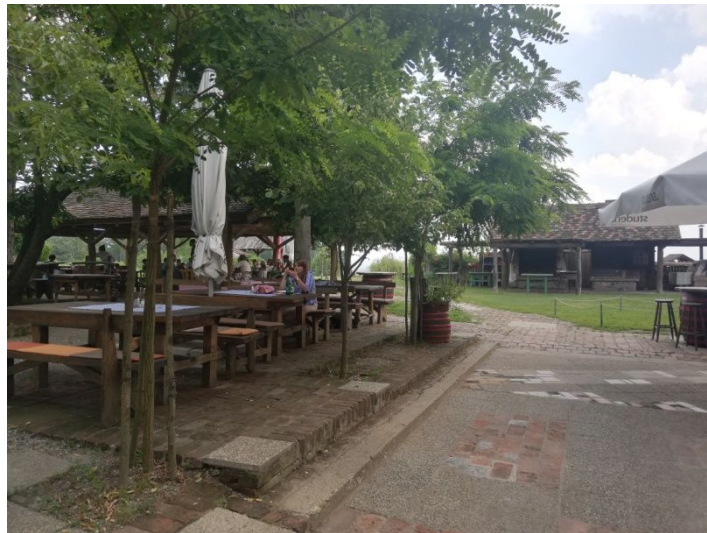
Slika 2. Dvorište restorana

prodaja vina, no najveći profit ostvaruju kroz turizam. Prema riječima vlasnika u 2018. godini imanje je posjetilo 30.000 gostiju. Imanje najčešće posjećuju obitelji koje vikendom dolaze na ručak kako bi uživali u odličnoj hrani i ambijentu. Svoje dojmove, pohvale i žalbe gosti mogu napisati u knjizi koja se nalazi na ulazu u restoran (slika 19., u prilogu). Kapacitet restorana je 150 osoba unutra (slika 21., u prilogu) i također toliko vani na terasi odnosno dvorištu (slika 2.). Također, velik broj posjetioca čine poslovne grupe koje imanje posjećuju kako bi održali poslovne sastanke/seminare, domjenke ili teambuilding. Osim poslovnih grupa, na izlete na imanje dolaze umirovljenici, djeca i obitelji preko različitih agencija koji će biti detaljnije opisani u narednom poglavlju.