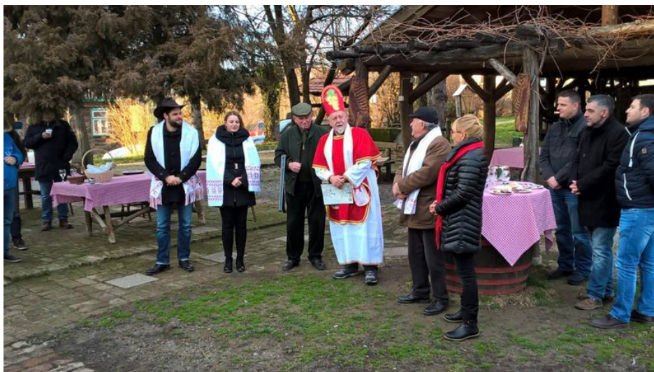
Slika 10. Martinje na seoskom turizmu Kezele