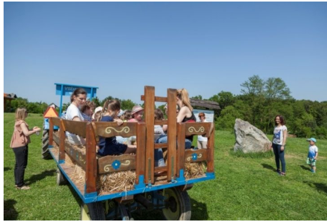
Slika 14. Vožnja traktorom