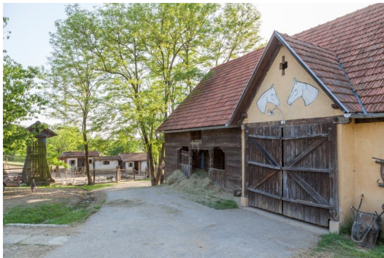
Slika 8. Staja s životinjama

doživljaj, naročito onima koji se još nikada nisu susreli s tim životinjama. Posjetioci u staji mogu vidjeti i autohtonu pasminu konja Hrvatski posavac kojega mogu i jahati.