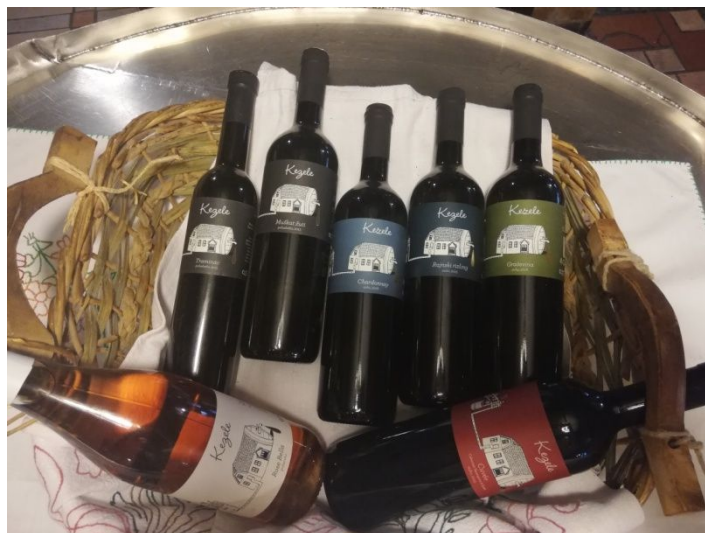
Slika 4. Vina Kezele

Vlasnik ističe kako je najznačajnija zlatna medalja koju su dobili za Škrlet na izložbi „Vina od davnina“ koju organizira Ministarstvo poljoprivrede. Također, još jedno važno priznanje za njih je bilo na svjetskoj izložbi „Decanter“ gdje je njihov Škrlet osvojio brončanu medalju. Za ostala vina su također dobivali nagrade.