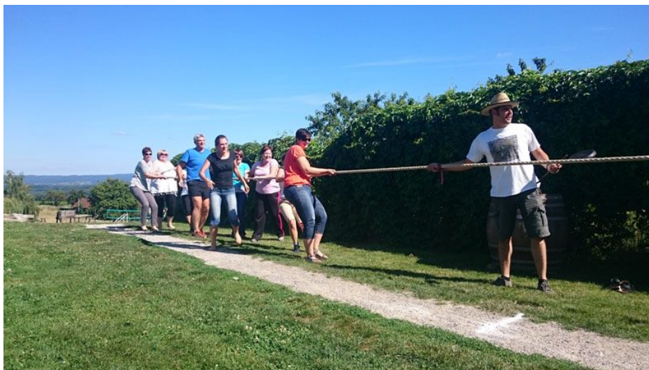
Slika 17. Povlačenje užeta

Stare seoske igre se sastoje od potezanja užeta (slika 17.), bacanja potkove, skakanja u vrećama, trčanja s jajetom u žlici, tjeranja šine, štafete s metlom i sl. u kojima se učesnici natječu raspodijeljeni u ekipe. Trajanje seoskih igara je oko sat vremena.