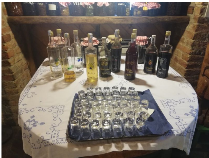
Slika 3. Rakije i likeri Kezele