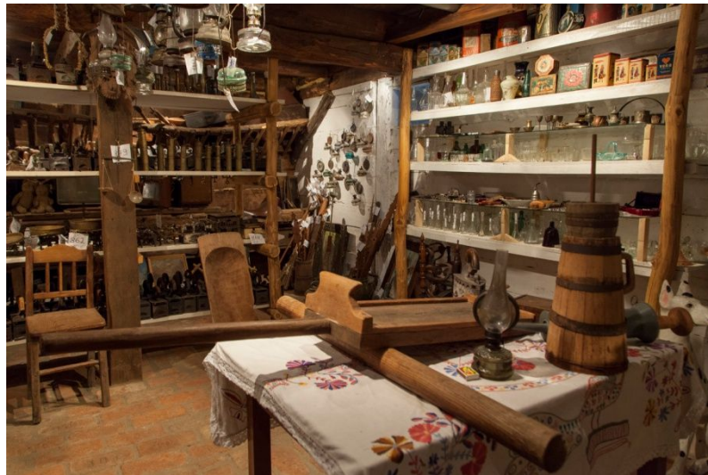
Slika 13. Etno zbirka

Ukoliko gosti žele, seoski turizam Kezele im nudi obilazak imanja koji uključuje posjet etno zbirci (slika 13.) u kojoj se nalazi preko 4.000 starih predmeta koji su se koristili u poljoprivredi, kućanstvu, vinariji, tradicionalnim obrtima i u mlinovima. Etno zbirka se nalazi u drvenoj staji staroj 100 godina.