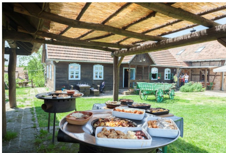
Slika 7. Moslavački stol obitelji Kezele

Uz brojna jela iz njihove a la carte ponude vikendom nude i Moslavački stol (slika 7.). Moslavački stol je inačica švedskog stola na način obitelji Kezele gdje se mogu pronaći mnogobrojna tradicionalna domaća jela koja se poslužuju na tanjuru za kotlovinu. Cijena Moslavačkog stola je 135 kn za odrasle, a za djecu od 3-10 godina 65 kn po osobi. U tu cijenu je uključena juha, glavno jelo, salata, kruh i desert.