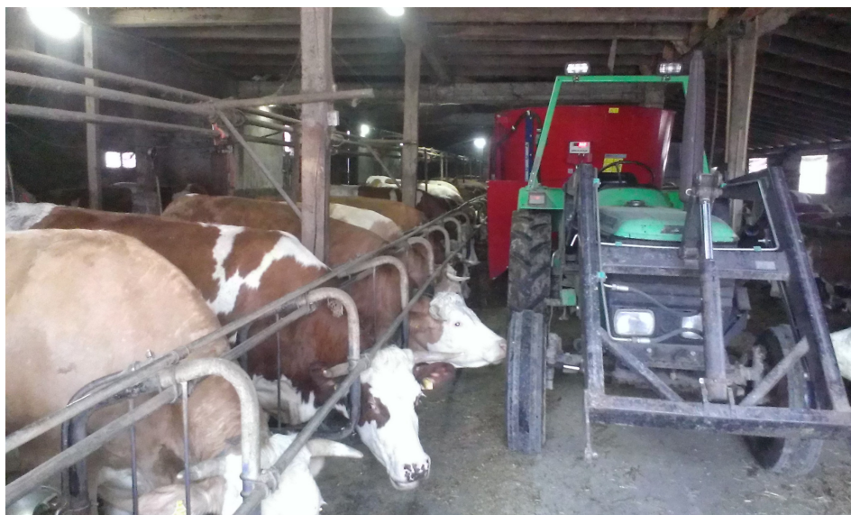
Slika 12. Hranjenje muznih krava mikser (TMR) prikolicom

i sjenažom. Junice su se pripuštale u dobi od 15-17 mjeseci i težini oko 380 kg. Nakon pripusta dnevni prirast junica ne prelazi 650 grama. U posljednja dva mjeseca graviditeta preporučuje se isti način hranidbe koji se primjenjuje kod gravidnih krava s puno voluminozne krme ako je krma odlične kvalitete. Kukuruzna silaža nije preporučljiva, a ako se mora davati, ne smije prijeći 8 kg na dan, ali onda uz nju se daje barem 3 kg slame na dan i obavezno se dodaje 50-80 grama mineralno-vitaminskih dodatka. Zadnja 3 tjedna prije teljenja junice su se hranile kao i krave prije teljenja. Postupno se uvodila najbolja voluminozna krma i 2 kg smjese za suhostaj na dan.