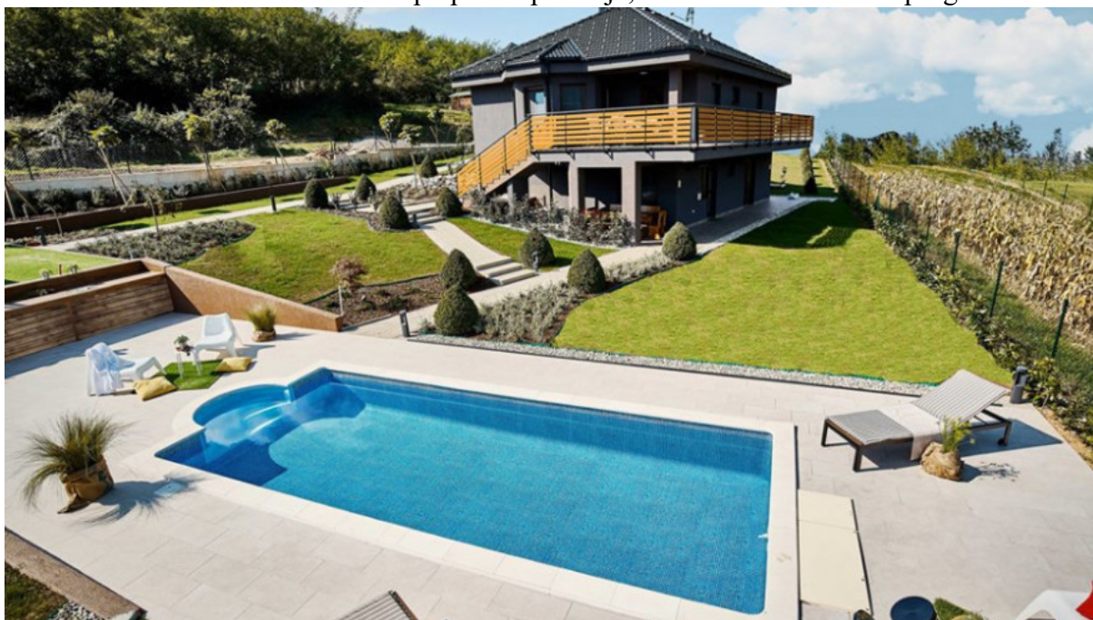
Slika 3. Mala kuća Mia za odmor i potpuno opuštanje, financirano iz IPARD programa