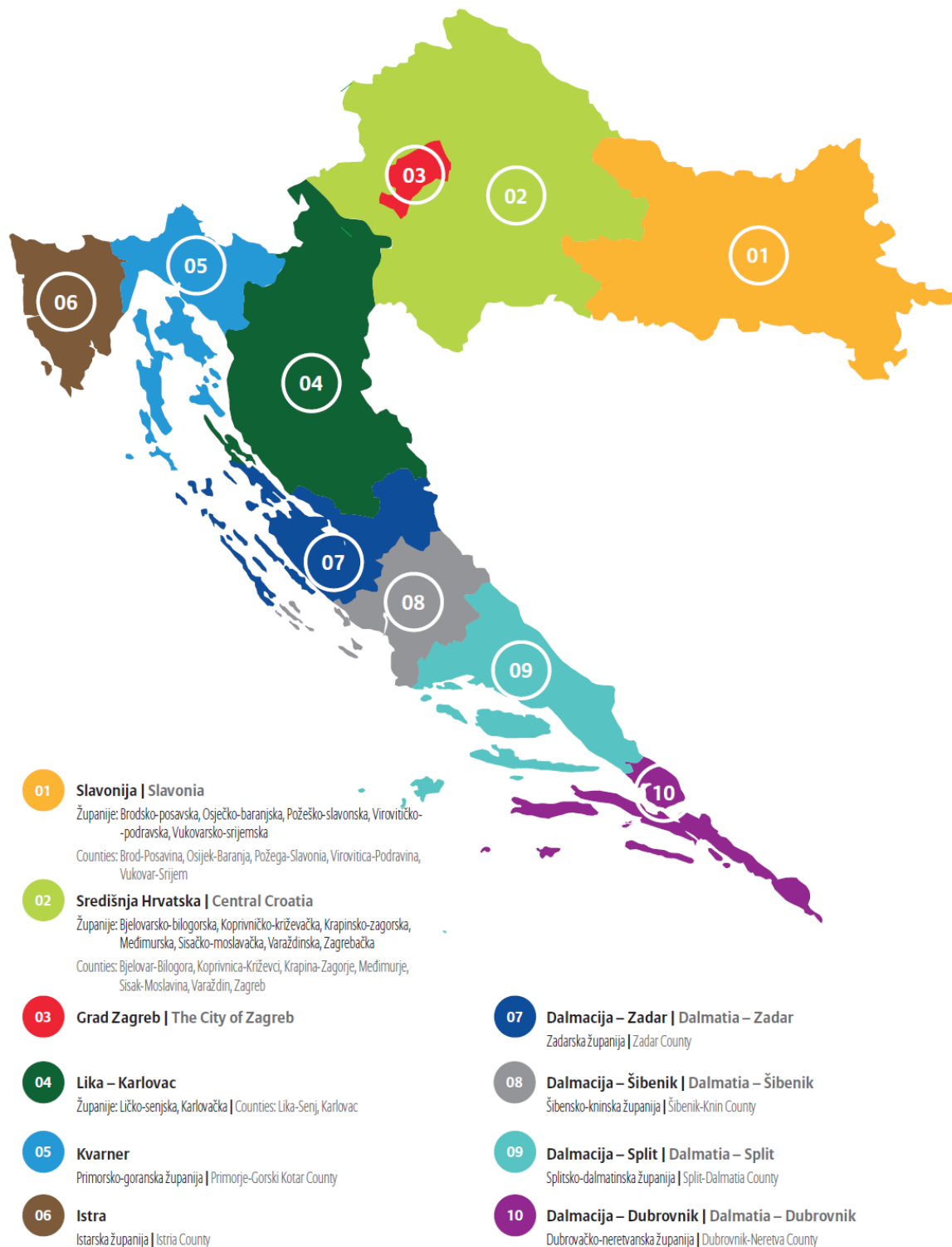
Slika 1. Turističke regije RH