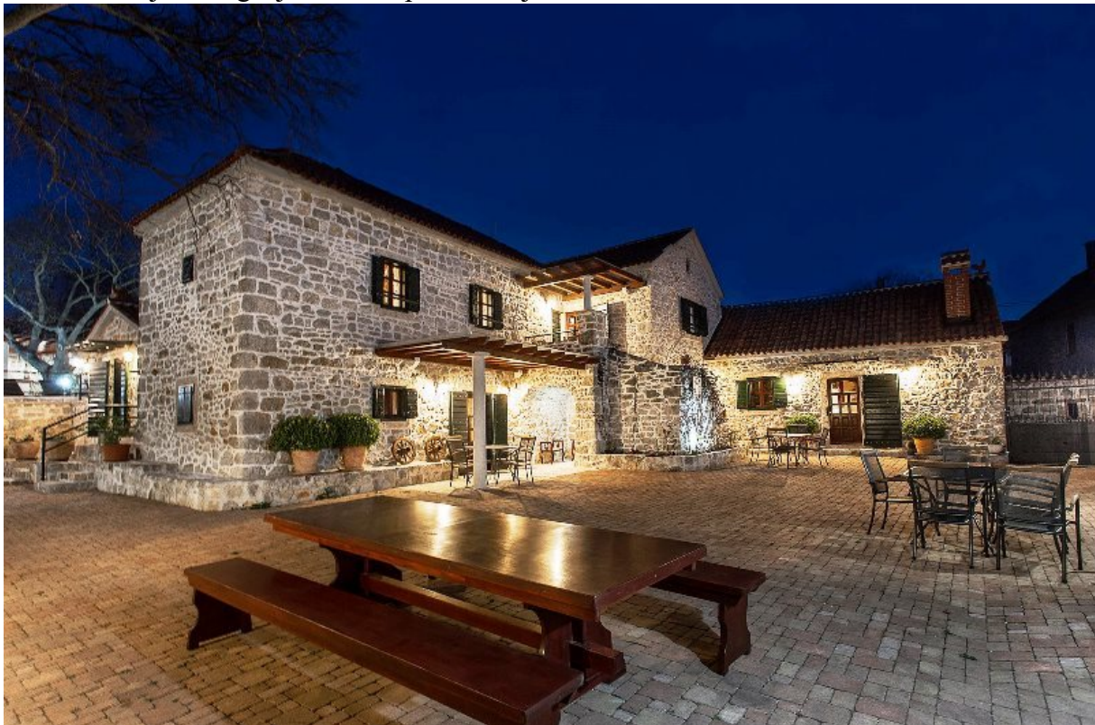
Slika 2. Višnjani ulaganja d.o.o., isplata za mjeru 302.