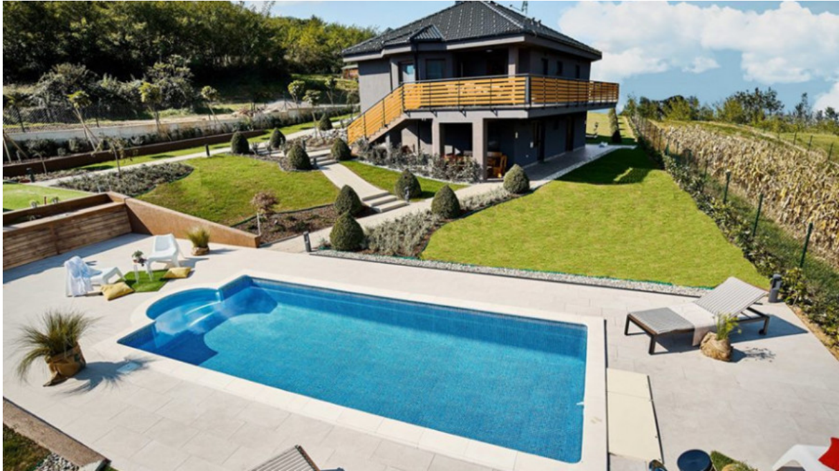
Slika 3. Mala kuća Mia za odmor i potpuno opuštanje, financirano iz IPARD programa