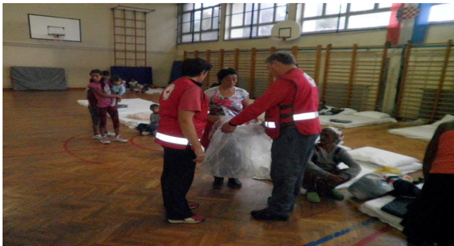
Slika 12. Crveni križ pomaže nesretnima u poplavi

U sportskoj dvorani bilo je smješteno 64 pripadnika romske nacionalnosti te je time petnaest obitelji iz romskog naselja bilo smješteno na sigurno. Gradsko društvo Crvenog križa Koprivnica i Interventni tim županijskog Crvenog križa osigurali su madrace, posteljinu i spužve kako bi se osigurali adekvatni uvjeti smještaja za evakuiranih osoba. Isto tako Gradsko društvo Crvenog križa Koprivnica osiguralo je potrebne higijenske potrepštine, dječju hranu, pelene, ručnike te potrebnu odjeću (Slika 12.). Djelatnici škole su pomagali kod podjele obroka koji se pripremao u Obrtničkoj školi, odnosno učenici koju pohađaju Obrtnički školu smjer kuhar, su na praktičnom djelu nastave pripremali obroke za smještene osobe.