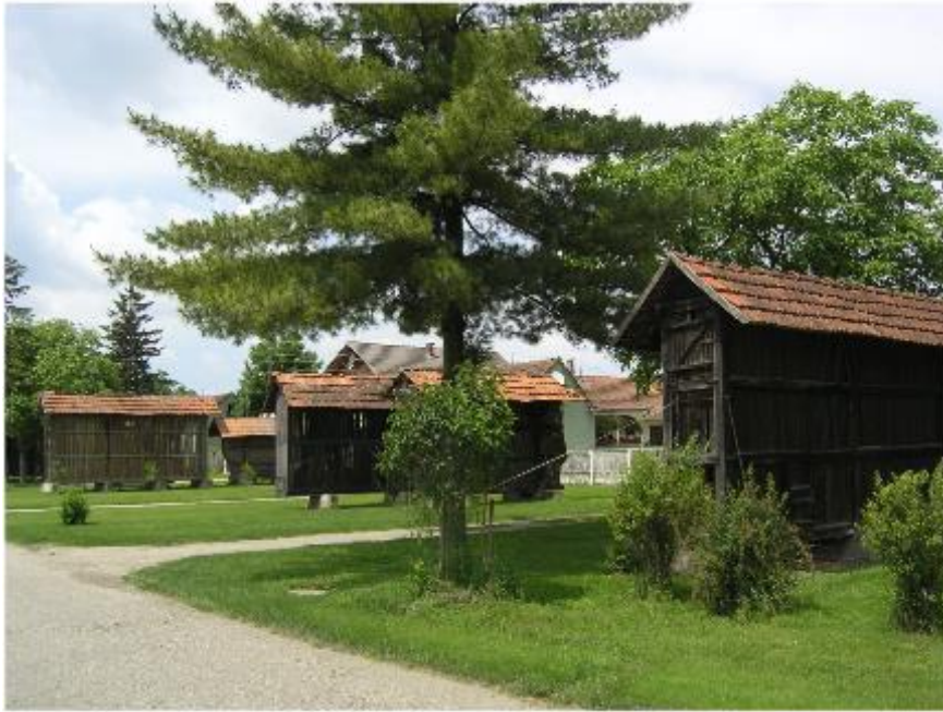
Slika 5. Koševi za kukuruz, Torčec