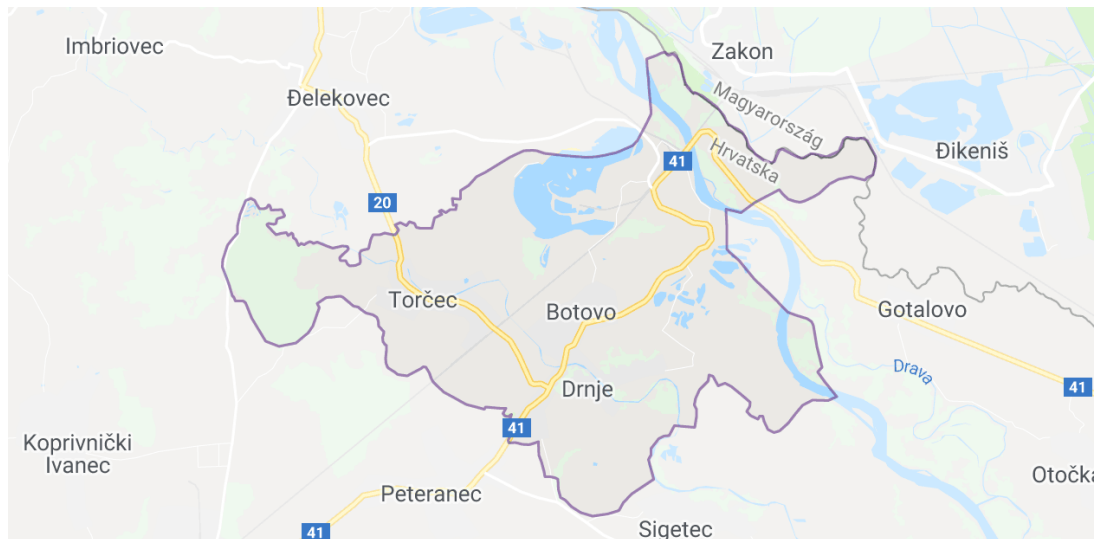
Slika 2. Karta općine Drnje

mlinovima, dok su kovači potkivali konje ili popravljali poljoprivredna pomagala. Općina Drnje osnovana je 1898. godine izdvajanjem iz općine Peteranec, a kasnije su joj pridodana mjesta Botovo i Torčec. Godine 1963. općina Drnje pridodana je općini Koprivnica, a ponovno proglašenje samostalne općine dogodilo se 1993. godine. Blizina grada Koprivnice, procesi deagrarizacije i industrijalizacije dovode do promjene strukture stanovništva te je iz godine u godinu sve veći broj zaposlenika u sekundarnom sektoru. (Petrić, 2000.).