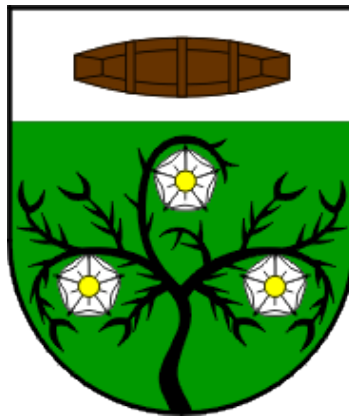
Slika 1. Grb općine Drnje

skupinu prema indeksu razvijenosti čija je vrijednost indeksa razvijenosti između 50% i 75% prosjeka Republike Hrvatske, odnosno stupanj razvijenosti općine Drnje je 73,97 %. Grb općine Drnje (slika 1.) odobren je 2001. godine, a sastoji se od srebrno/bijelo zelenog štita, u gornjem srebrno/bijelom dijelu nalazi se smeđi drveni čamac aludirajući na rijeku Dravu dok u zelenom podnožju štita izrasta crna stabljika trnja s tri bijele heraldičke ruže (trnje je usporedba sa nazivom općine) (Petrić, 2000.).