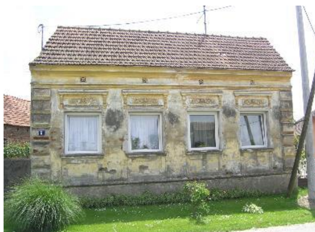
Slika 4. Stambene građevine Torčec