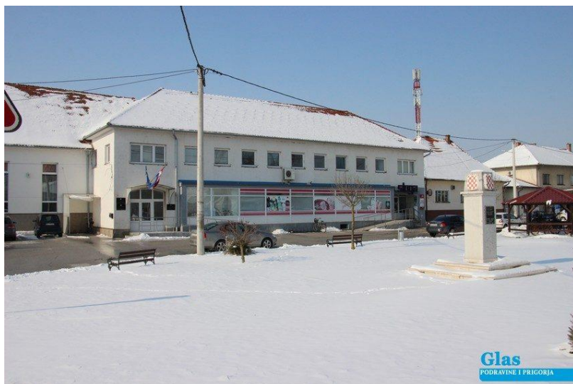
Slika 7. Općinska zgrada