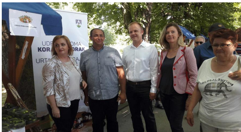
Slika 13. Udruga Roma „Korak po korak“