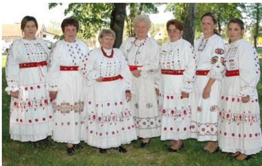
Slika 8. Članice Udruga žena „Hrvatsko srce“ iz Drnja