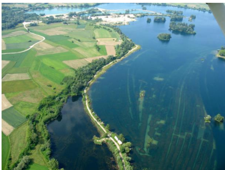
Slika 6. Jezero Šoderica na području Općine Drnje