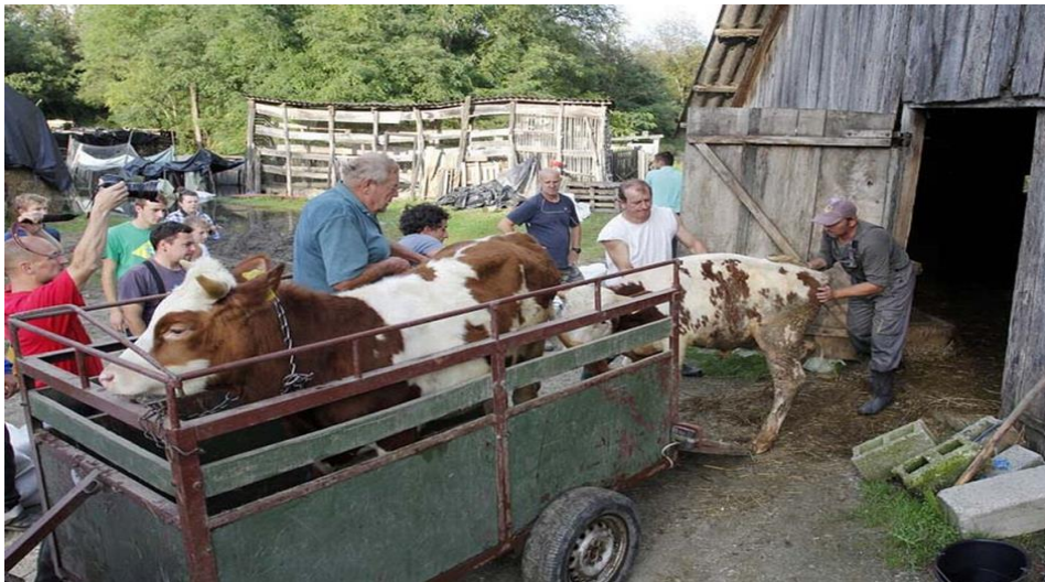
Slika 10. Evakuirana stoka

Rijeka Drava je rasla iz sata u sat i pokazala koliko štete može učiniti. Zadnja zabilježena poplava datira iz 1827. godine kada je rijeka Drava spojila dva susjedna mjesta, Sigetec i Peteranec te su stanovnici Drnja jedva uspjeli spasiti svoje živote. Naime, Drava je bila toliko visokog vodostaja da se od sela do sela putovalo čamcima. Nakon toga vrlo su se aktivno počele provoditi mjere regulacije rijeke Drave. U ovoj poplavi posebno je bio zahvaćen dio Općine Drnje koji se naziva Židovaroš, odnosno Dravska ulica. To je područje kroz koje protječe potok Gliboki, s jedne strane dok se na kraju spomenutog područja nalaze poljoprivredna područja i naselje Roma. Stanovnici Drnja su vrlo brzo shvatili kako nabujali potok i viski nivo rijeke Drave ne znače ništa dobrog. Županijski stožer zaštite i spašavanja, čelni ljudi Općine Drnje te stanovnici ugroženog područja prvo su evakuirali stoku (Slika 10.).