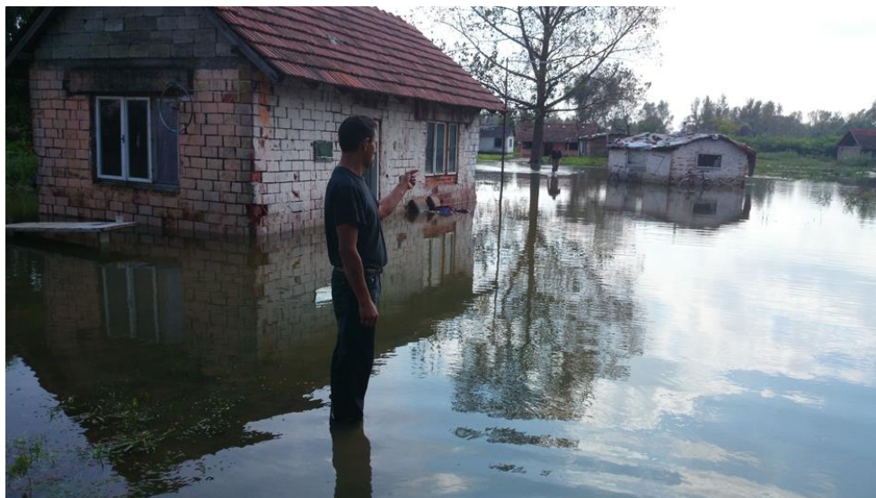
Slika 11. Romi u borbi protiv poplave

Kako se naselje Roma nalazilo na kraju ovog područje te mu je prijela poplava i od strane rijeke Drave, ali i potok Gliboki bi naselje odsjekao od sela, došlo je do organizirane evakuacije cijelog romskog naselja u sportsku dvoranu Osnovnu škole „Fran Koncelak“ Drnje.