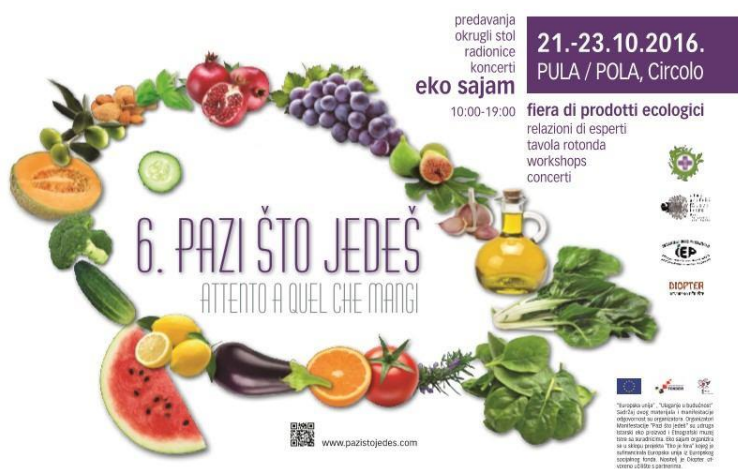
Slika 2. Prikaz plakata manifestacije „Pazi što jedeš“

„Pazi što jedeš“ manifestacija je koja se održava u Puli od 2011. godine (slika 2). Manifestacija je edukativnog i sajmenog karaktera na kojoj izlažu eko proizvođači iz cijele Hrvatske. 2017.g. tema sajma bila je „Znanje i okus“-prenošenje znanja i očuvanje okusa, a naglasak je bio na tradicijskim receptima karakterističnim za Istru. Organizator ovog sajma je Etnografski muzej Istre.