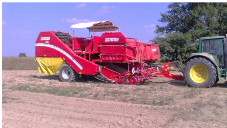
Slika 8. Vađenje krumpira iz zemlje

U izradi ovoga završnog rada praćen je rad dvorednog vučenog kombajna GRIMME SE 260 koji je spojen preko priključnog vratila s vlastitim spremnikom za prihvat gomolja. U jednom pohodu kombajn izvadi gomolj iz zemlje (slika 8., slika 9.), potresa zemlju (slika 10.) i gomolje sprema u spremnik (slika 11.).