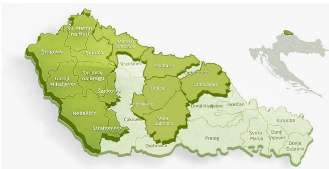
Slika 6. Prikaz jedinica lokalne samouprave u sastavu LAG-a „Međimurski doli i bregi“

Lokalna akcijska grupa „Međimurski doli i bregi“ osnovana je 22. listopada 2012. godine, a okuplja preko stotinu predstavnika javnog, gospodarskog i civilnog sektora s područja četrnaest jedinica lokalne samouprave zapadnog i središnjeg dijela Međimurske županije. U počecima rada LAG (slika 6) se prostirao na osam jedinica lokalne samouprave zapadnog, brdovitog Međimurja (Općina Gornji Mihaljevec, Općina Nedelišće, Općina Selnica, Općina Strahoninec, Općina Sveti Juraj na Bregu, Općina Sveti Martin na Muri, Općina Šenkovec i Općina Štrigova). Godine 2015. područje LAG-a širi se na istok županije. U lipnju iste godine LAG obuhvaća Općinu Podturen i grad Mursko Središće, a kod drugog proširenja koje se zbilo u lipnju 2016. godine LAG je obuhvatio dio središnjeg Međimurja (Općina Belica, Općina Domašinec, Općina Mala Subotica i Općina Pribislavec). Konačno područje LAG-a prostire na površini od 404,72 km 2 , ima 56.384 stanovnika u 90 naselja. Slika 1. Prikazuje jedinice lokalne samouprave u sastavu LAG-a „Međimurski doli i bregi“.