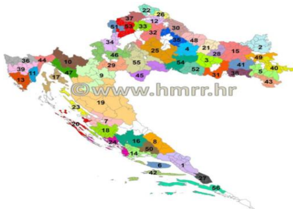
Slika 3. Karta Hrvatskih LAG-ova

U Hrvatskoj postoji 56 LAG-ova (slika 3). Rasprostiru se na površini od 52.190,05 km 2 , što čini 92,30% ukupne površine Hrvatske. Na području LAG-ova živi 2.446.567 stanovnika, što čini 57,10% ukupnog stanovništva Hrvatske. Hrvatski LAG-ovi obuhvaćaju 531 jedinicu lokalne samouprave (121 grad i 410 općina), što čini 95,50% ukupnog broja jedinica lokalne samouprave u Hrvatskoj 9 .