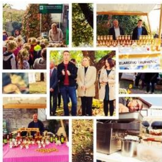
Slika 8. Sajam „Z domačeg vrta“

Svetom Martinu na Muri, s ciljem održive turističke valorizacije, a što je nedavno završeno. Također, u sklopu istog projekta će se u listopadu 2018. godine organizirati međunarodni sajam „Z domačeg vrta“ (slika 8 i 9). Na sajmu će se nuditi plodovi rada vrijednih međimurskih ruku, povrtlara, voćara i vinogradara, med i pekmezi, domaći začini, vina, sokovi, voćne rakije, izvorni međimurski specijaliteti i domaće slastice, ali i tradicijski predmeti.