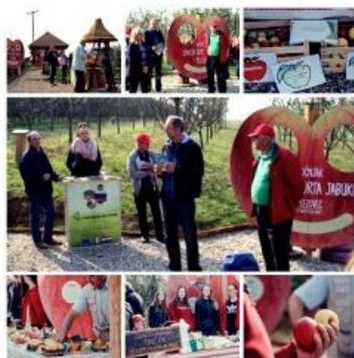
Slika 9. Izložba jabuka starinskih sorti