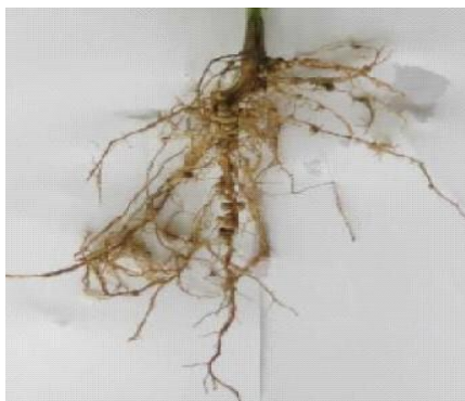
Slika 3. Prikaz korijena soje

Korijen soje je vretenastog oblika. Na gornjem kraju glavnog korijena izbijaju mnogi sitni korjenčići do 2 m duljine. Prvi dio sitnih korjenčića ide obično u dubinu od cca 30 cm, drugi 50 – 70 cm (Gutschy , 1950).