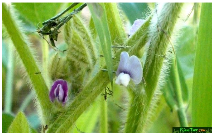
Slika 7. Cvijet soje.

Cvijet soje građen je kao i drugih zrnatih mahunarki. Cvjetovi se oblikuju u pazuhu listova, i to po nekoliko. Cvjetovi se oblikuju od baze stabljike, prvih donjih grana, pa prema vrhu. Ako se cvjetovi oblikuju previše pri dnu stabljike, nakon oplodnje će razviti mahune nisko pri zemlji, pa će u žetvi kombajnom ostati nepokošene. Zato se biraju kultivari koji oblikuju prve cvjetove i mahune desetak i više centimetar od tla. Cvjetanje traje dugo. U nepovoljnim uvjetima dosta cvjetova može otpasti. To se dešava pri ekstremno visokom temperaturama ili temperaturama ispod 10 C. Oplodnja je autogamna (samooplodnja) (Gagro, 1997).