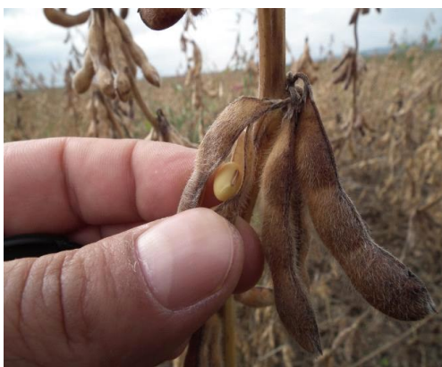
Slika 8. Mahuna soje.

Mahuna soje srpastog, okruglog ili spljoštenog oblika. Značajno varira po veličini i na istoj biljci, kao i između sorata, uz veliko djelovanje vanjskih činitelja. Oblik mahune vezan je za broj i oblik sjemenki. to znači ako ima više sjemenki u mahuni, mahune su duže, a ako je zrno okruglo, mahune su okrugle. mahune spljoštenog zrna su više spljoštenog oblika. Mahuna sadrži od jednog do pet zrna. Duljina mahune je između 2 i 7 cm, a širina je između 1 i 1,5 cm. Prema ispitivanju Vratarić (1983.) na više sorata u području Osijeka produkcija mahuna po biljci kretala se od 12,60 do 56,10, ovisno o godini. Konačan broj mahuna po biljci najviše je ovisio o vlažnosti tla u vrijeme mahunjanja i nalijevanje zrna (Vratarić i Sudarić, 2008).