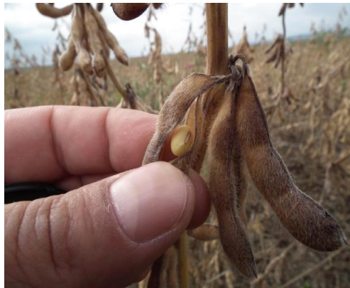
Slika 8. Mahuna soje.

Mahuna soje srpastog, okruglog ili spljoštenog oblika. Značajno varira po veličini i na istoj biljci, kao i između sorata, uz veliko djelovanje vanjskih činitelja. Oblik mahune vezan je za broj i oblik sjemenki. to znači ako ima više sjemenki u mahuni, mahune su duže, a ako je zrno okruglo, mahune su okrugle. mahune spljoštenog zrna su više spljoštenog oblika. Mahuna sadrži od jednog do pet zrna. Duljina mahune je između 2 i 7 cm, a širina je između 1 i 1,5 cm. Prema ispitivanju Vratarić (1983.) na više sorata u području Osijeka produkcija mahuna po biljci kretala se od 12,60 do 56,10, ovisno o godini. Konačan broj mahuna po biljci najviše je ovisio o vlažnosti tla u vrijeme mahunjanja i nalijevanje zrna (Vratarić i Sudarić, 2008).