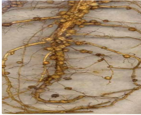
Slika 4. Kvržice na korijenu soje