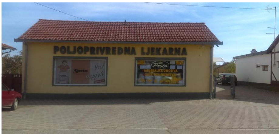
Slika. 9 Trgovina Prvča P.Z Koprivnica

Strateški partneri, odnosno glavni dobavljači Prvče su: Bayer, Basf, Syngenta, Genera, Danon, Agrochem Maks, Medical Intertrade, Sano, TSH Čakovec, Valpovka, BC Institut, KWS Sjeme, Maisadour, Poljoprivredni institut Osijek, Pioneer Sjeme, Sjeme Split, Marcon, Unichem, Belchim, Orchem, Poljodar tim i dr.