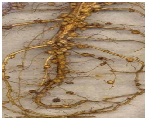
Slika 4. Kvržice na korijenu soje