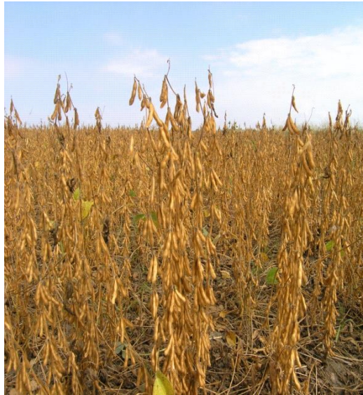
Slika 5. Indeterminirani rast stabljike soje

biljke. Stabljike su nešto niže i sa većom mogućnošću grananja. Zameću više prvu mahunu i otpornije su na polijeganje (Vratarić i Sudarić, 2008).