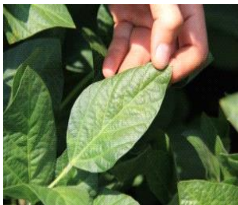
Slika 6. List soje