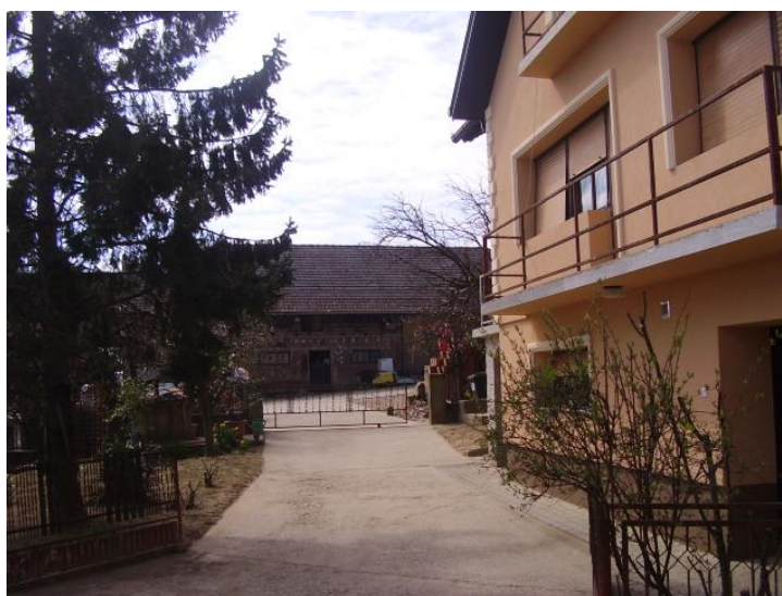
Slika br. 3. Slika gospodarstva Peklić

Gospodarstvo se intenzivnijom proizvodnjom mlijeka počelo baviti 1993. godine i to uzgojem prije svega simentalске i holstein pasmine goveda. Proizvodnja mlijeka se zasniva na 23 muzne krave. Mlijeko otkupljuje mljekara Dukat.