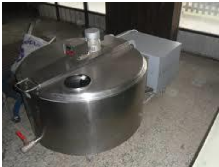
Slika br. 4. Laktofriz na OPG Peklić