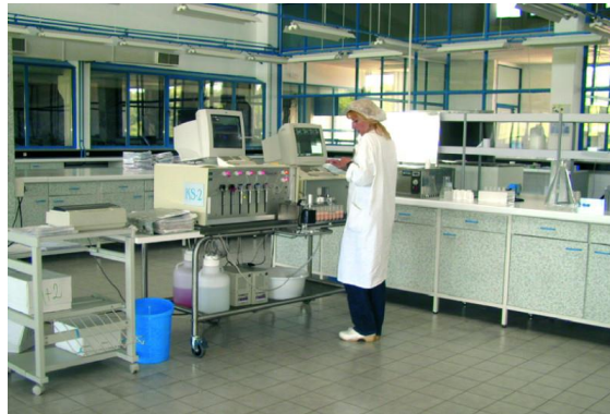
Slika 2. Središnji Laboratorij za kontrolu mlijeka u Križevačkoj Poljanki

U uvjetima ekstenzivne proizvodnje mlijeka minimalna je higijenska kvaliteta mlijeka pa je rizičan broj mikroorganizama i somatskih stanica, te dopuštene količine rezidua antibiotika i hormona, a osobito je rizična prisutnost drugih zabranjenih materija. Stoga sirovo svježe kravlje mlijeko, kao komercijalno mlijeko namijenjeno tržištu za daljnju preradu i korištenje, mora udovoljavati uvjetima kvalitete propisane međunarodnim standardima. Europska unija donijela je 1992. propise-direktive o uvjetima proizvodnje i prodaje sirovog mlijeka, preradi mlijeka i proizvodnji mliječnih proizvoda. U odnosu na broj somatskih stanica i mikroorganizama, mlijeko je rangirano u kvalitetne razrede (Tomše-Đuranec i sur., 2008)