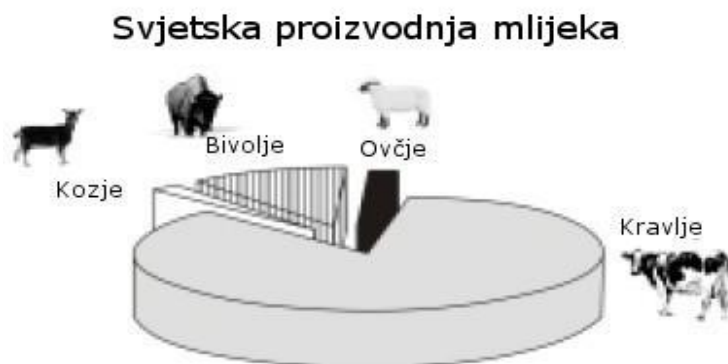
Slika br.1. Udio vrsti stoke u proizvodnji mlijeka u svijetu

Proizvodnja mlijeka ima izuzetan proizvodno gospodarski značaj jer je namijenjena prehrani stanovništva. Proizvodnja mlijeka mnogim je poljoprivrednicima egzistencijalno zanimanje. Mlijeko se kao sirovina prvenstveno koristi za preradu u mljekarskoj industriji ali i u pripremanju druge hrane. Mlijeko je oduvijek upotrebljavano i cijenjeno, a životinje koje proizvode mlijeko dignute su na nivo božanstva (Hindu. narod). Iako se upotrebljava mlijeko krava, bivola, ovaca, koza, deva i kobilica, ipak je u prehrani i proizvodnji dominantno kravlje mlijeko. Na proizvodnju mlijeka utječe niz faktora: agro-ekološki klimatski faktor, stupanj razvoja gospodarstva, vjerska struktura stanovništva, tradicijski aspekt te navika konzumiranja mlijeka i mliječnih prerađevina.