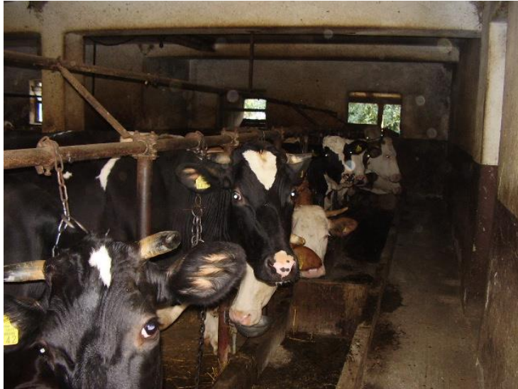
Slika br. 6. Unutrašnjost staje na OPG Peklić