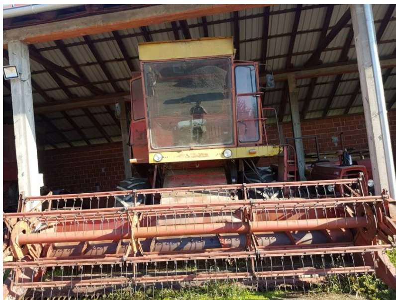
Slika 17. Kombajn i žitni adapter

Kombajn za žetvu marke Zmaj 170 godina proizvodnje 1985. Na kombajnu se nalazi žitni adapter radnog zahvata 5,5 m. Ulaz za žetvenu masu je 130 cm a zapremina bunkera za zrno je 2 t.