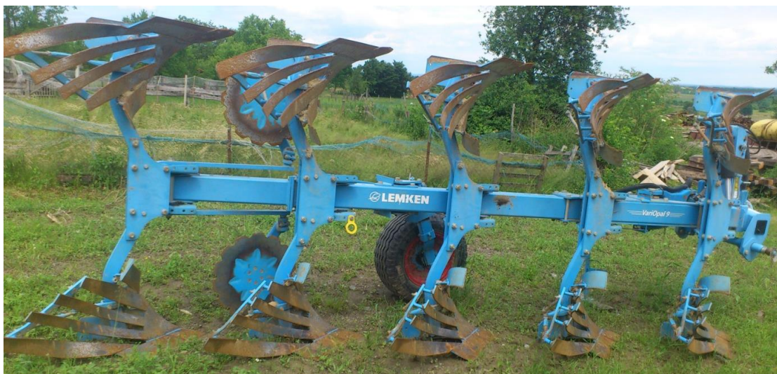
Slika 14. Plug

Plug je marke Lemken variopal 9 premetnjak koji ima 5 brazdi. Plug je podesivi od 25 – 55 cm radne širine jedne brazde. Oranje tim plugom je dosta jednostavnije jer se ore u ravnicu i daska pluga je letvičasta i samim tim brazda nakon okretanja nije slijepljena već rahlije strukture.