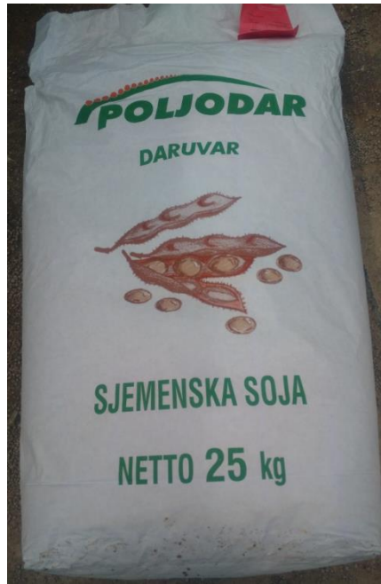
Slika 21. Vreća sjemenske soje