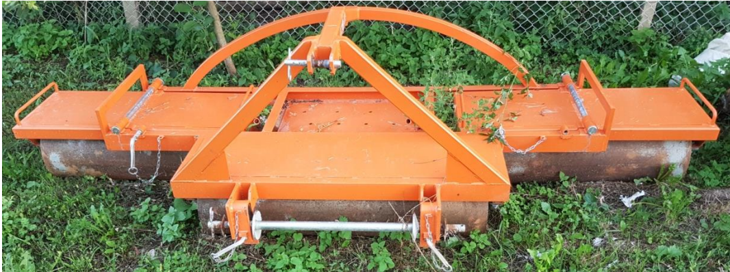
Slika 16. Valjak

Valjak širine radnog zahvata 3 m, sklopiv je radi lakšeg transporta. Koristi se za valjanje soje nakon sjetve tako da se postigne što bolji dodir tla sa sjemenom. Valjak sadrži valjka od po 1m radnog zahvata te srednji valjak je fiksiran dok su bočni valjci pokretni i prate oblik terena. Valjak je napunjen vodom koja mu daje dodatnu težinu za bolji pritisak i poravnavanje tla.