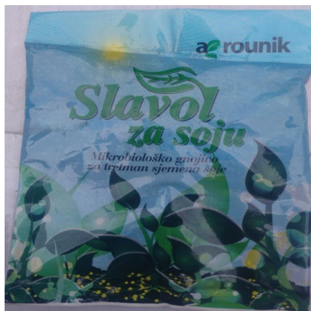
Slika 19. Bakterije za inokulaciju sjemena soje