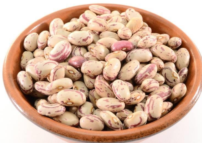
Slika 1. Sjeme graha Trešnjevca