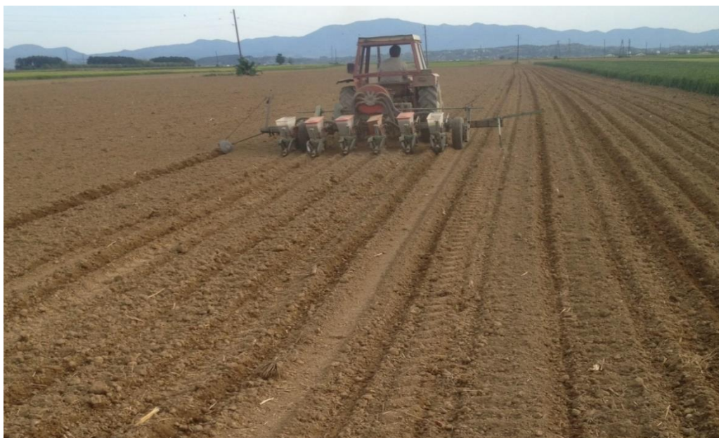
Slika 3. Sjetva graha pomoću kombinacije traktora Massey Fergusona 135 i pneumatske sijačice OLT