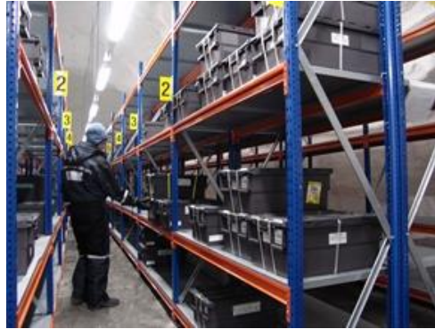
Slika 3. Skladišni prostor