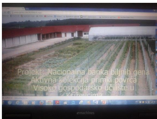
Slika 6. Kolekcijsko polje na VGUK, te prikaz Internet stranice aktivne kolekcije primki povrća na VGUK

kolekciji i koje su spremne za daljnju regeneraciju. Kad se odlučimo koju vrstu i sortu želimo sve nam je lijepo opisano sa slikom i njenim deskriptorom, kako bi nam što lakše bilo uzgojiti i pratiti njezin rast.