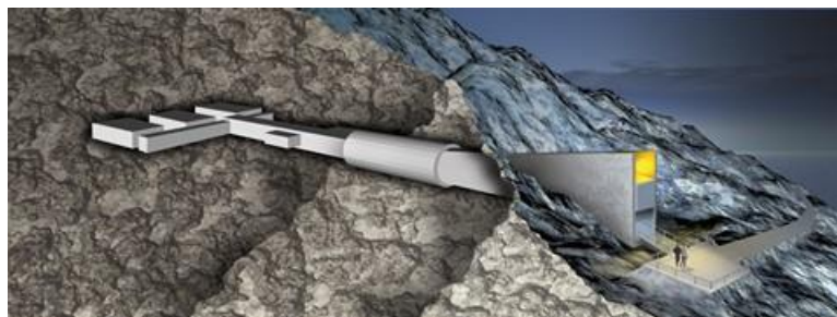
Slika 2. Nacrt Globalnog skladišta sjemena na Svalbardu

Banke sjemena su ustanove koje pohranjuju sjeme različitih vrsta biljaka kako bi ih se očuvalo od različitih prirodnih katastrofa kao što su ratovi, bolesti, potresi i slični događaji zbog kojih bi sjeme moglo nestati. U njima se čuvaju različite vrste usjeva pa sve do sjemena rijetkih i najugroženijih vrsta koje bi mogle iskorijeniti (Salkić, B., 2014).