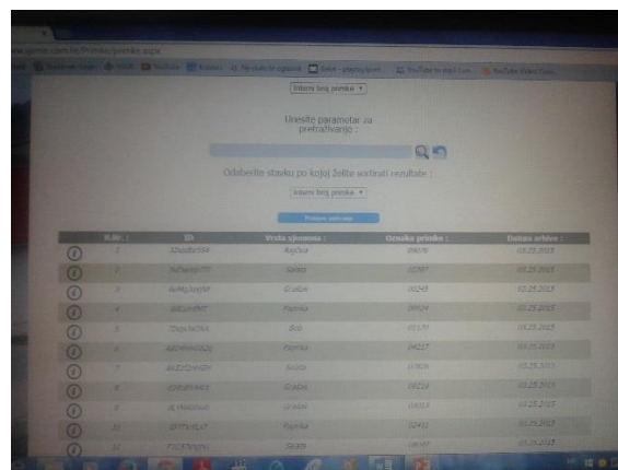
Slika 7. Prikaz primki u aktivnoj zbirci