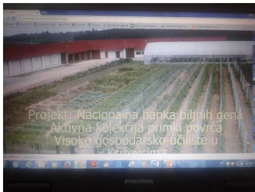
Slika 6. Kolekcijsko polje na VGUK, te prikaz Internet stranice aktivne kolekcije primki povrća na VGUK

kolekciji i koje su spremne za daljnju regeneraciju. Kad se odlučimo koju vrstu i sortu želimo sve nam je lijepo opisano sa slikom i njenim deskriptorom, kako bi nam što lakše bilo uzgojiti i pratiti njezin rast.