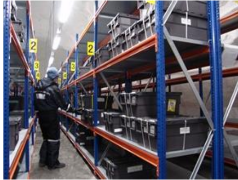
Slika 3. Skladišni prostor