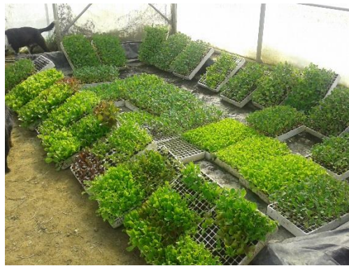
Slika 5. Presadnice spremne za sadnju

Nakon sadnje, mora se pažljivo i temeljito brinuti o svakoj vrsti posebno da dobijemo najbolje što ta biljka može dati, okopavanjem, zalijevanjem, plijevljenjem, te zaštitom. Tijekom rasta biljki, sva opažanja moraju se zabilježiti u deskriptor od morfoloških do fenoloških značajki.