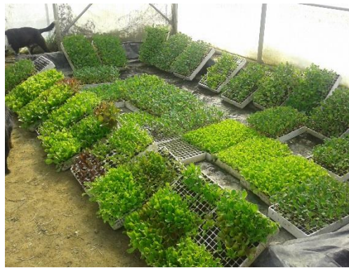
Slika 5. Presadnice spremne za sadnju

Nakon sadnje, mora se pažljivo i temeljito brinuti o svakoj vrsti posebno da dobijemo najbolje što ta biljka može dati, okopavanjem, zalijevanjem, plijevljenjem, te zaštitom. Tijekom rasta biljki, sva opažanja moraju se zabilježiti u deskriptor od morfoloških do fenoloških značajki.