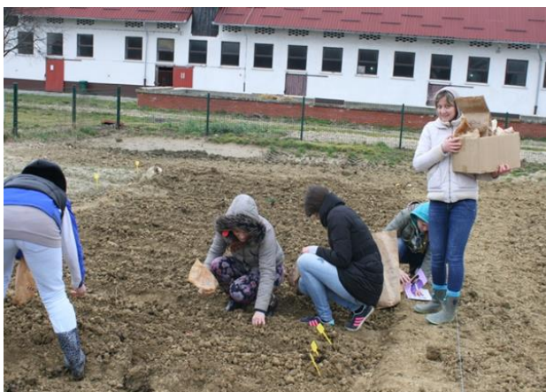
Slika 6. Sadnja luka i češnjaka