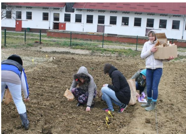
Slika 6. Sadnja luka i češnjaka