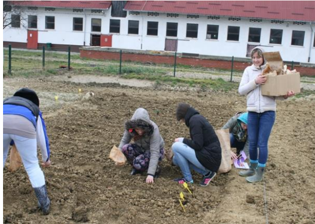
Slika 6. Sadnja luka i češnjaka