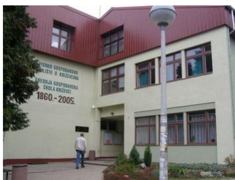
Slika 1. Visoko gospodarsko učilište u Križevcima

Kako bi se one očuvale od trajnog nestajanja, zbog sve veće komercijalizacije i uvoza hibridnog sjemena, Visoko gospodarsko učilište u Križevcima (VGUK) jedno je od institucija u Republici Hrvatskoj koje to žele spriječiti, te su se uključili u očuvanje biljnih genetskih izvora te stvorili jednu od najveće Nacionalne banke biljnih gena u Hrvatskoj. Kako biološko nasljeđe propada mnogo brže od nekog drugog nasljeđa, jednom izgubljenom sortu ili ekopopulaciju nemoguće je vratiti.