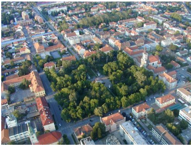
Slika 1. Grad Bjelovar iz zraka

Bjelovar od davnih dana ima velik broj vrhunskih sportaša u rukometu, nogometu, atletici te odbojci. Ali prije svega važno je istaknuti kako su 1972. godine rukometaši Bjelovara osvojili titulu Europskoga prvaka te još desetak titula prvaka u Hrvatskoj i izvan nje.