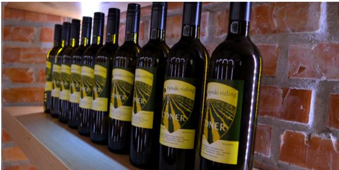
Slika 8. Vino vinarije Coner

Gastronomska ponuda restorana je zaista posebna, a njihov moto kaže „ Od ljubavi prema zemlji do ljubavi prema vinu “. U restoranu se mogu pronaći tradicionalna bilogorska jela koja budu pripremljena na ekskluzivan i suvremen način. Namirnice, naravno koje mogu, uzgajaju na svojem ili se uzgajaju na obližnjima imanjima te ih koriste u svome restoranu. U tome uvelike pomaže i velik broj zaposlenih ljudi, njih 22 izvan sezone te u punoj sezoni radova čak i 35 ljudi. Od ukupnog broja zaposlenih, u restoranu stalno radi desetero radnika, dok su ostali radnici razmješteni na poslovima u vinogradu i vinskom podrumu. U timu su vrhunski kuhari, enolozi i agronomi koji se redovito educiraju na različitim specijaliziranim seminarima i tečajevima, kako bi vino i sve vezano uz vinariju napravili još boljim. Vlasnik ponosno ističe da je tim vrhunskih i stručnih djelatnika njihovo najveće bogatstvo.