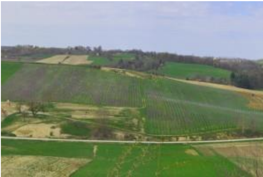
Slika 6. Vinogradi vinarije Coner

Vinarija za sada može pružiti ugodno provedeno vrijeme s obitelji nakon nedjeljnog ručka ili gostima mogu priuštiti zanimljivi spoj tradicionalnog i modernog u smislu pripremanja tradicionalnih jela te posluživanja istih na moderan način. Vinarija je poznata po organiziranju svadbenih svečanosti, a odličan marketinški odmak je bio u tome što se 2015. godine u Restoranu i vinariji Coner organizirala svadbena svečanost poznate hrvatske pjevačice Indire iz grupe Colonia . Također se organiziraju svečanosti povodom krizme, prve svete pričesti i slično.