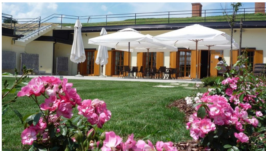
Slika 5. Restoran i vinarija Coner

Osim toga, Bilogora i okolica obiluju biljnim i životinjskim svijetom, ali i kulturnim sadržajima. Gosti se mogu baviti lovom, ribolovom, jahanjem, sudjelovati u zabavnim kulturno-povijesnim manifestacijama, obići Bilogorsku vinsku cestu, posjetiti lječilišta s termalnom vodom, umjetničke galerije, stare utvrde i arheološka nalazišta kraja koji je naseljen od kako su prvi ljudi stigli u Europu.