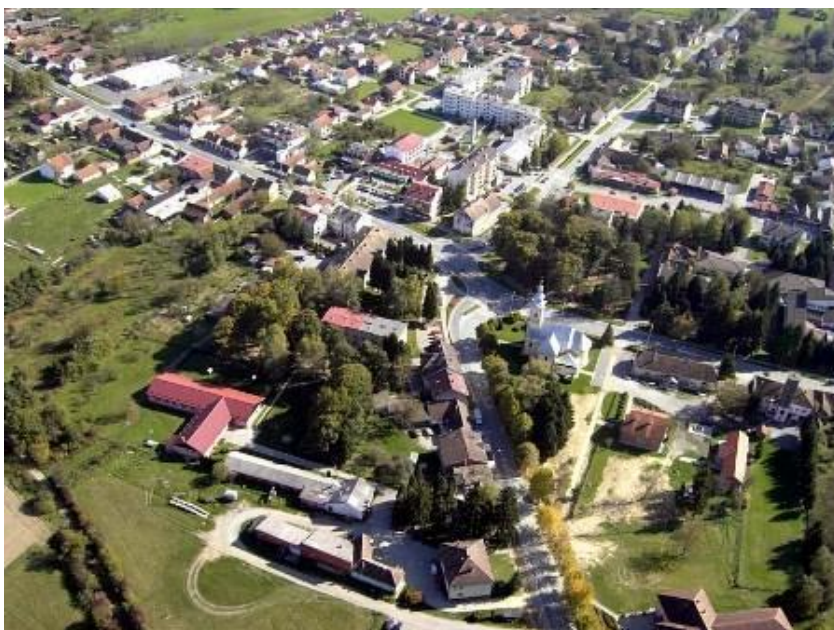
Slika 4. Grad Grubišno Polje