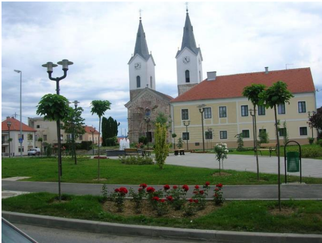
Slika 3. Crkva Sv. Marije Magdalene u Čazmi

to prepoznati te posjetiti imanje Salaj u istom broju kao i za Božić. Čazma ima jednu od najljepših crkvenih građevina u Hrvatskoj – crkvu sv. Marije Magdalene iz 13.st. (slika 3.).