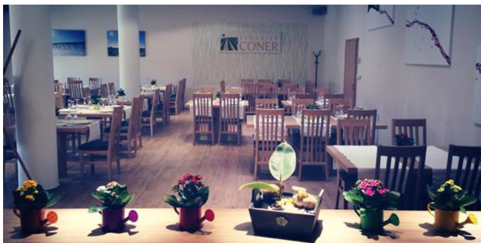
Slika 7. Restoran

U restoranu Coner mogu se kušati tradicionalna jela bilogorskog kraja pripremljena na ekskluzivan i suvremen način, od namirnica proizvedenih na njihovom imanju na Bilogori ili seoskim gospodarstvima u okolici. Sve što mogu, uključujući ručno proizvedenu tjesteninu, poslužuju domaće. Uz jela s karte, u ponudi su specijaliteta s ražnja i iz krušne peći. U dvije dvorane mogu primiti do 160 gostiju. I kao najnovija ponuda, vrše i uslugu dostave hrane za više ljudi, poznati „catering“ 16 .