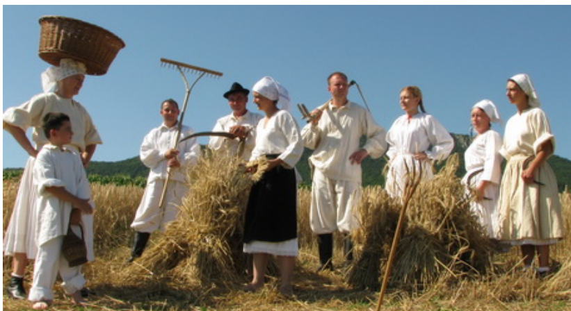
Slika 4. KUD Kalnik