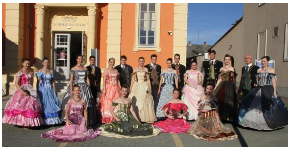
Slika 5. Potkalnički plemenitaši